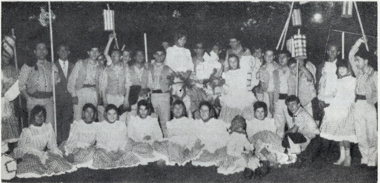
A graça e o colorido de Benfica foram novamente (e galhardamente) postos à prova no desfile das marchas deste ano