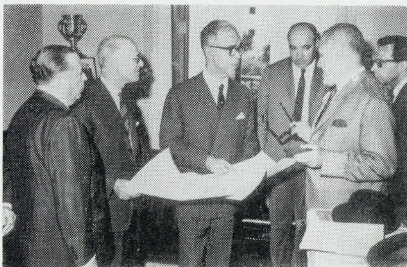
O sr. ministro das Obras Públicas quando apreciava, no Governo Civil de Castelo Branco, os projectos dos trabalhos a executar no distrito