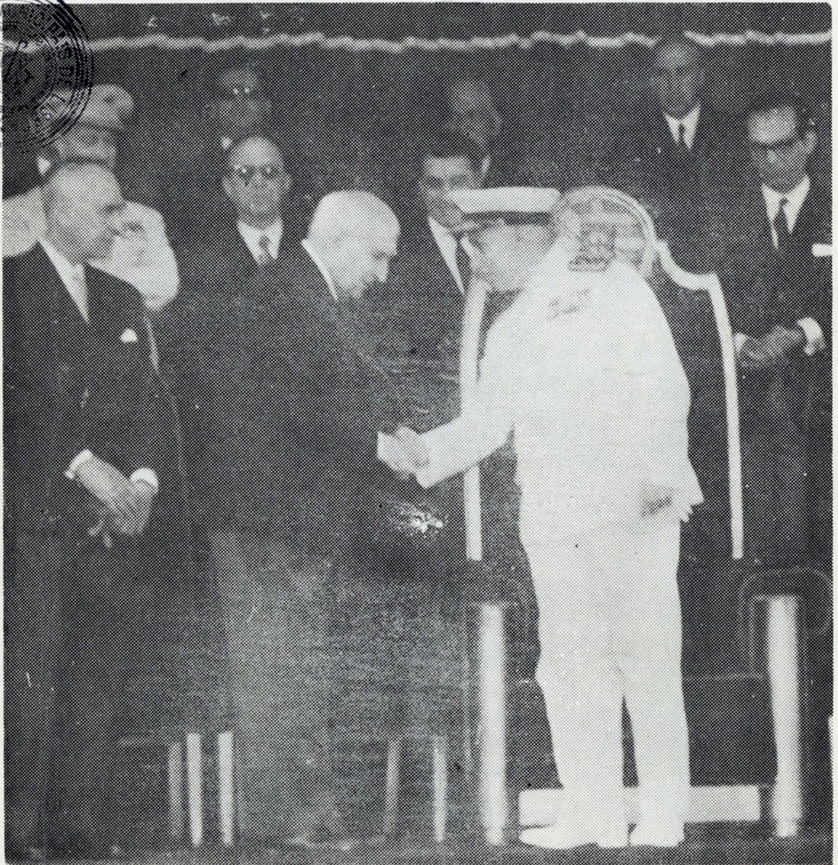
Na tribuna de honra, o sr. Presidente da República e o Chefe do Governo trocam saudações, momentos antes do desfile militar