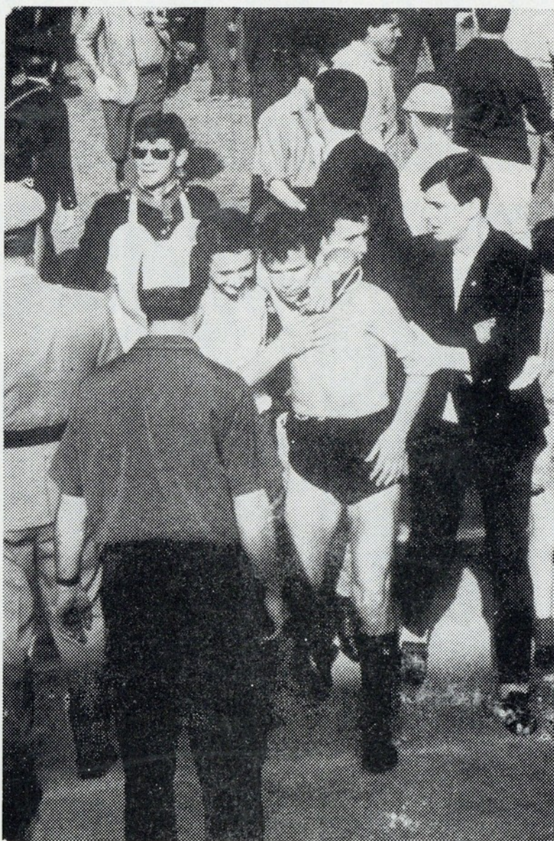
Visivelmente emocionados os jogadores casapianos regressam ao vestiário