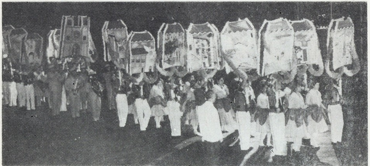
Alfama teve o 1.º prémio de Marcação, com justos aplausos para a gente de um dos pedaços mais lisboetas da Lisboa velha