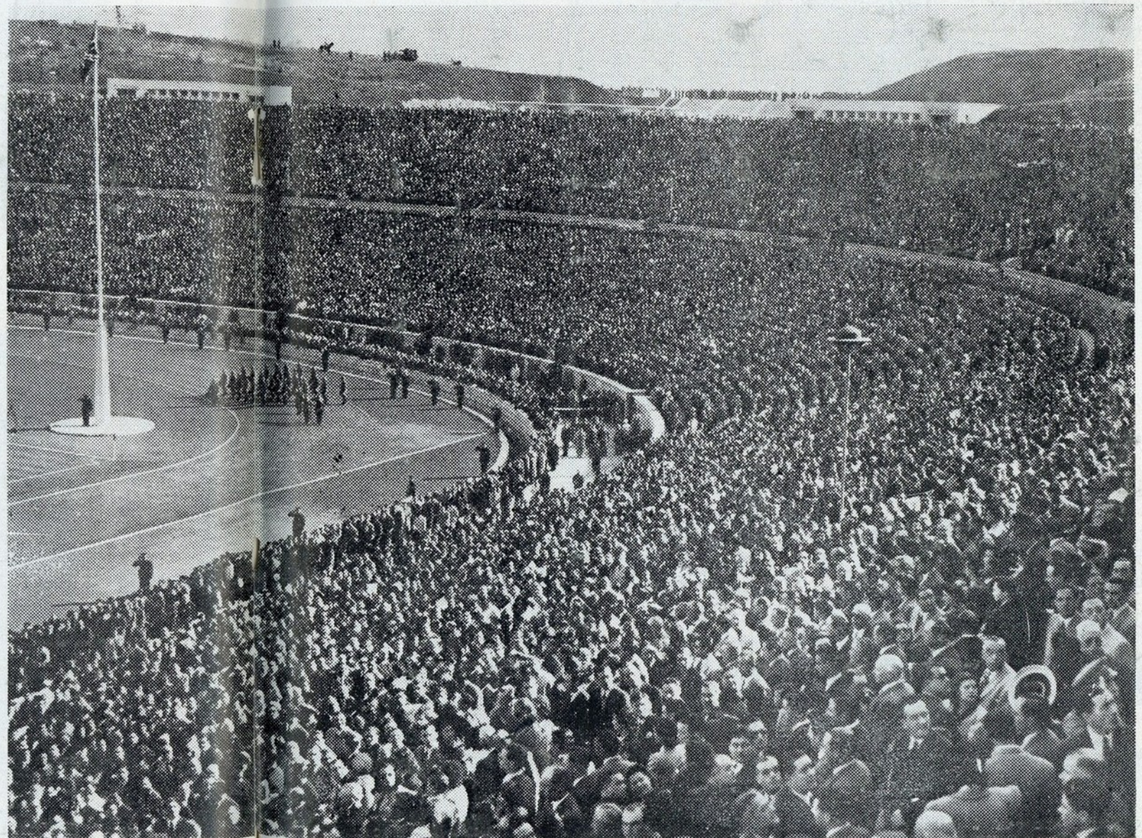
Maravilhoso aspecto do Estadio no momento de ser içada a bandeira inglesa no mastro de honra