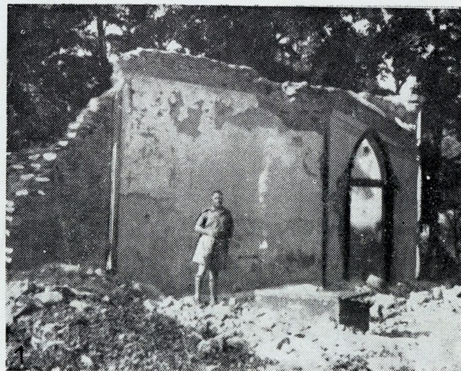
Do edifício do Banco Ultramarino nada mais resta