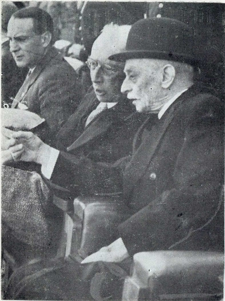
O sr. Presidente da República conversando com o sr. Embaixador da Inglaterra, durante o desafio