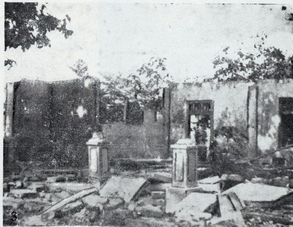
Da sede do Sporting restam de pé apenas algumas colunas e paredes