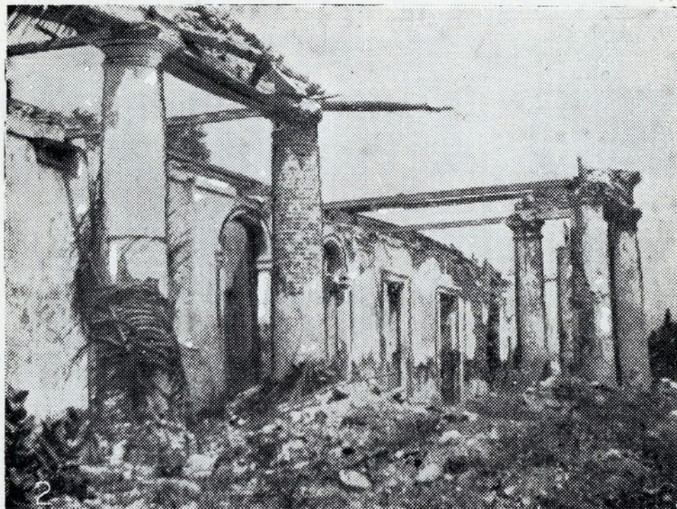
O que resta do antigo Pelácio do Governo