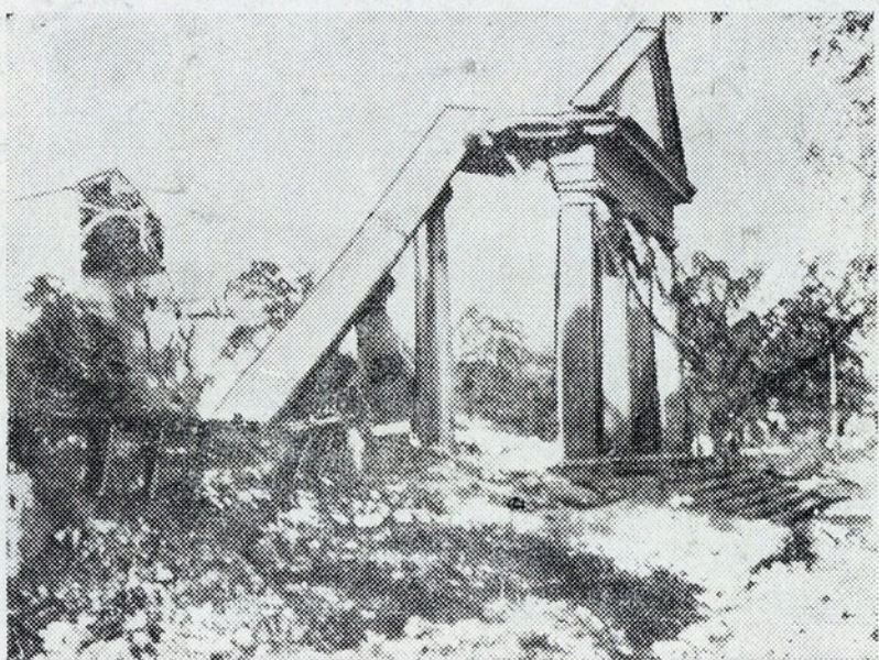
O edifício da Câmara Municipal ficou reduzido a este trágico montão de ruínas