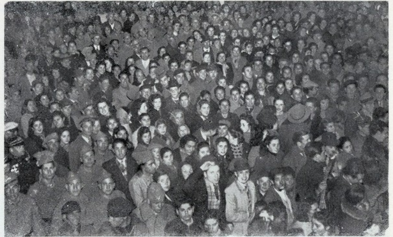
A enorme multi.ão que aclamou o sr. Presidente da R. publica, em frente da cidadela de Cascais, por ocasião da homenagem prestada a Sua Excele.ia, pelo povo daquela vila, no dia seguinte ao da sua reeleição