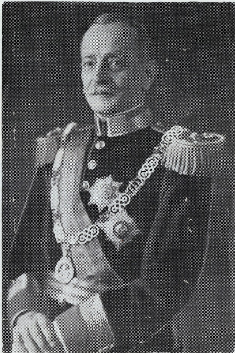
SR. GENERAL CARMONA

eleito Chefe do Estado, pela terceira vez, em 8 de Fevereiro findo