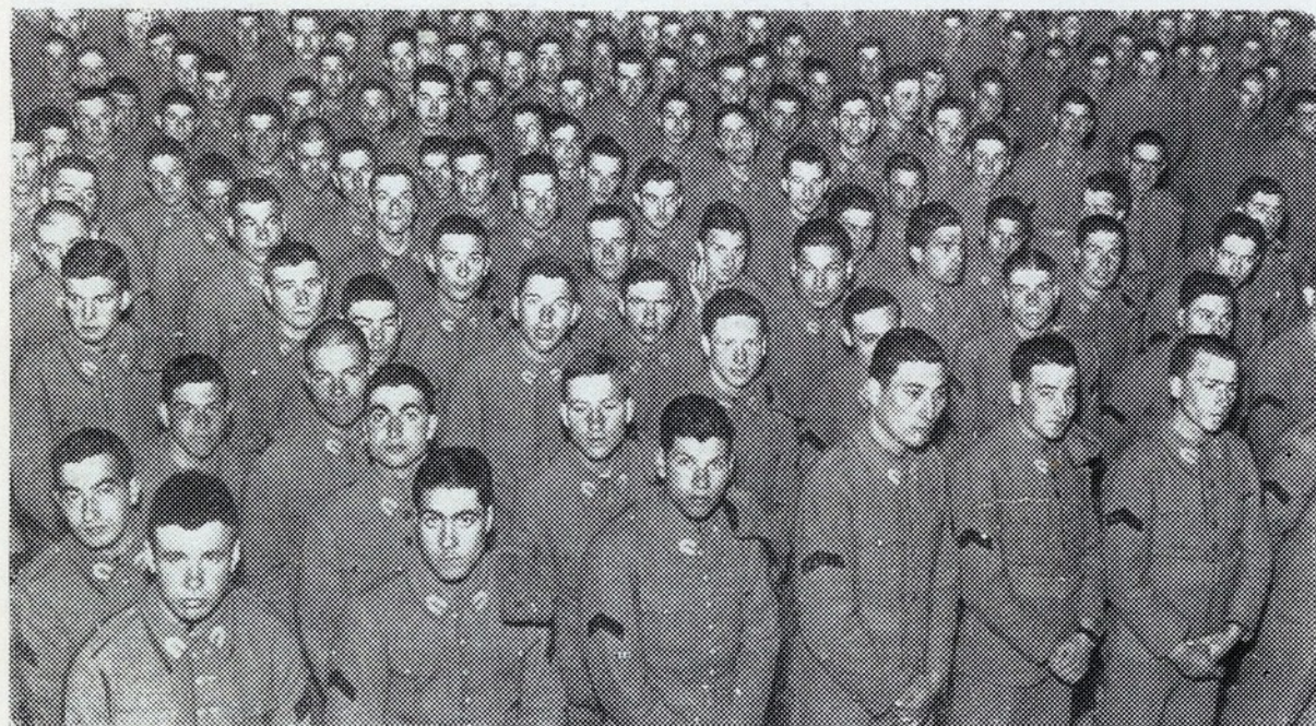
Os soldados do contingente expedicionario que seguiu para Lourenço Marques, no dia 14 de Fevereiro findo, ouvindo missa na igreja da Graça