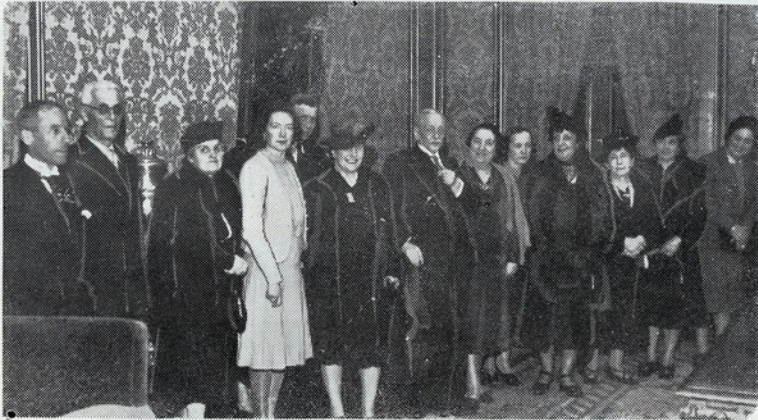
O sr. Presidente da Republica e sua esposa com algumas das numerosas pessoas que, após a reeleição, o foram cumprimentar