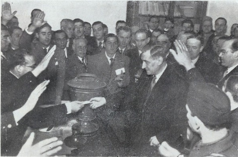
O sr. dr. Oliveira Salazar calorosamente saudado pelos outros eleitores. ao votar na Assembleia da Escola Machado de Castro