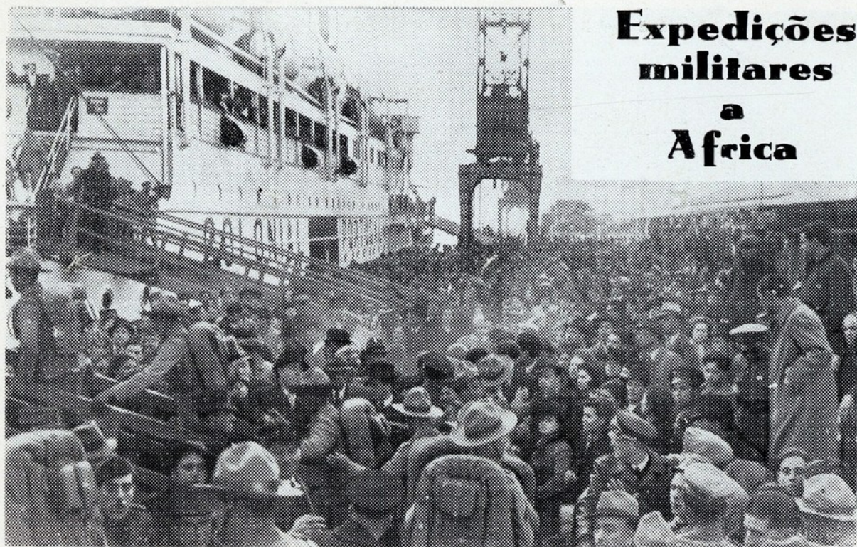
Embarque no «Colonial», entre as carinhosas manifestações do povo, do contingente de infantaria 11, de Setúbal, que seguiu para Cabo Verde no dia 8 de Janeiro proximo findo