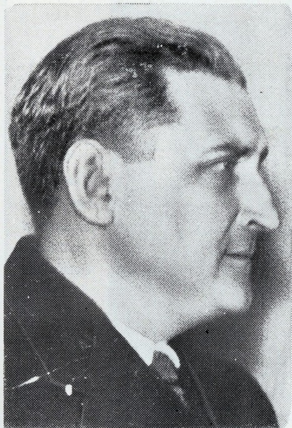
DR. OLIVEIRA SALAZAR