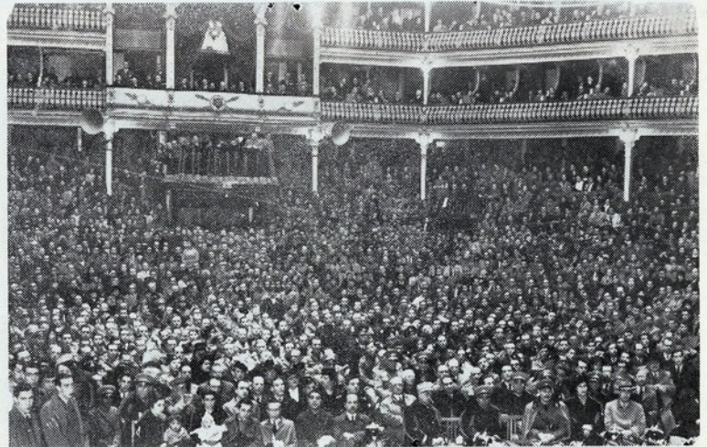
Aspecto da sala do coliseu dos Regentes quando da sessão de homenagem ao sr. General Carmona, ali realizada no dia 5 de Fevereiro