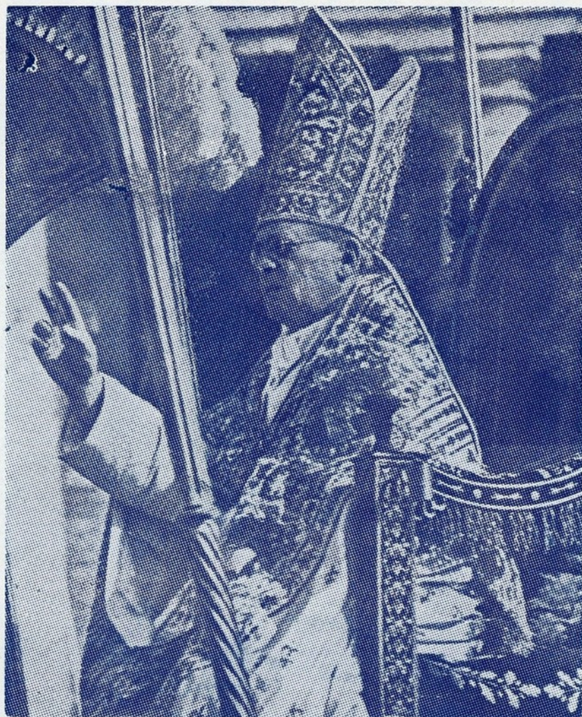
Sua Santidade Pio XI