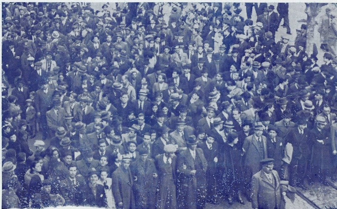
O pessoal do «Século» largamente representado na manifestação ao sr. Presidente do Conselho