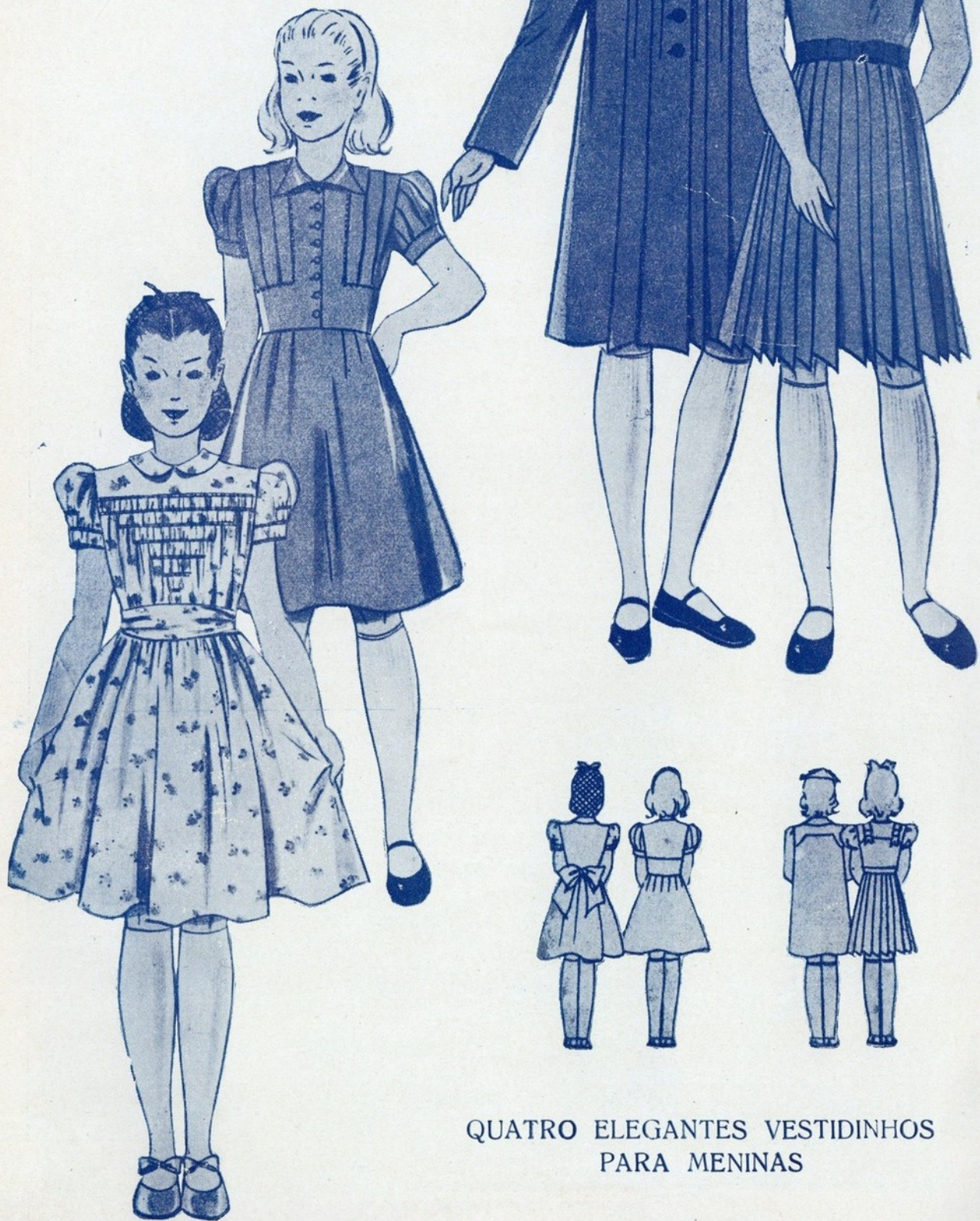
QUATRO ELEGANTES VESTIDINHOS PARA MENINAS