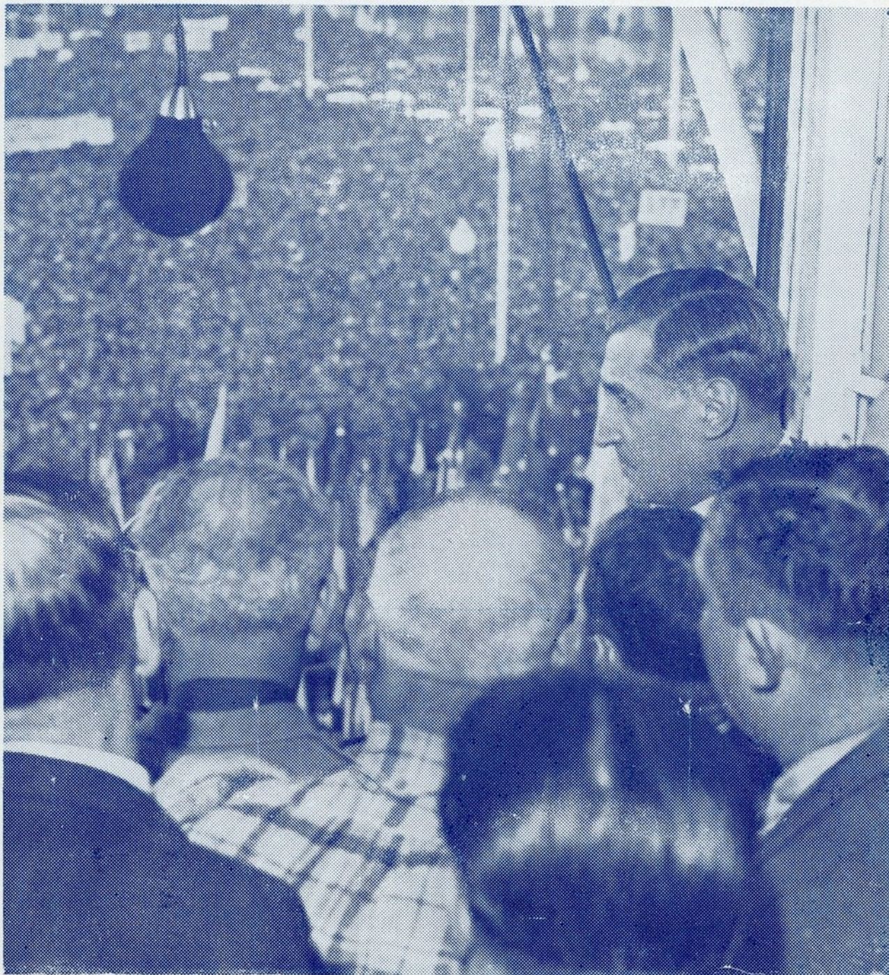
O sr. Presidente do Conselho assiste, da janela do Subsecretariado das Corporações, á manifestação em sua honra, de 28 do mês findo, promovida pelos Sindicatos e Grémios corporativos