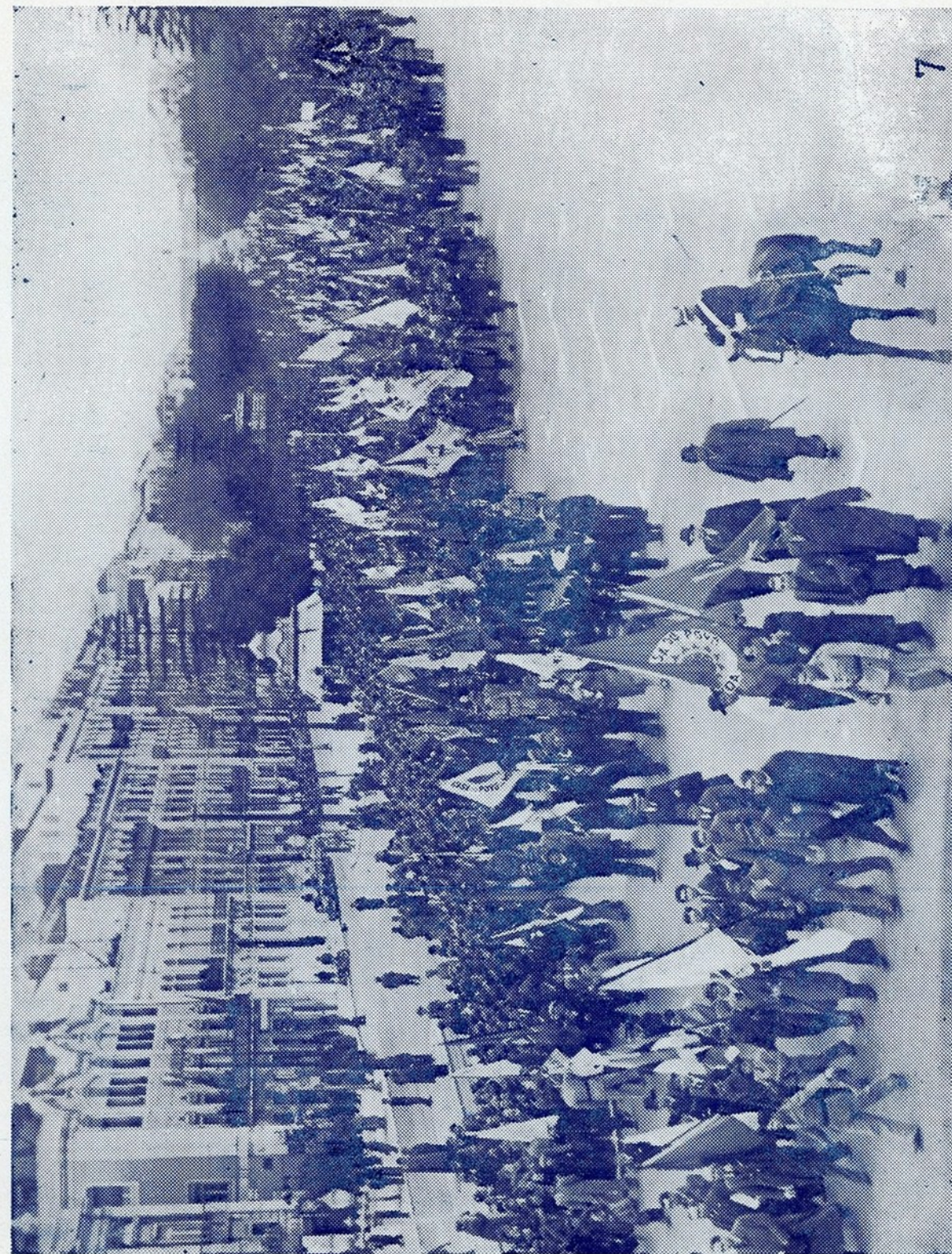
Desfile, na Praça dos Restauradores, dos estandartes dos Sindicatos Nacionais