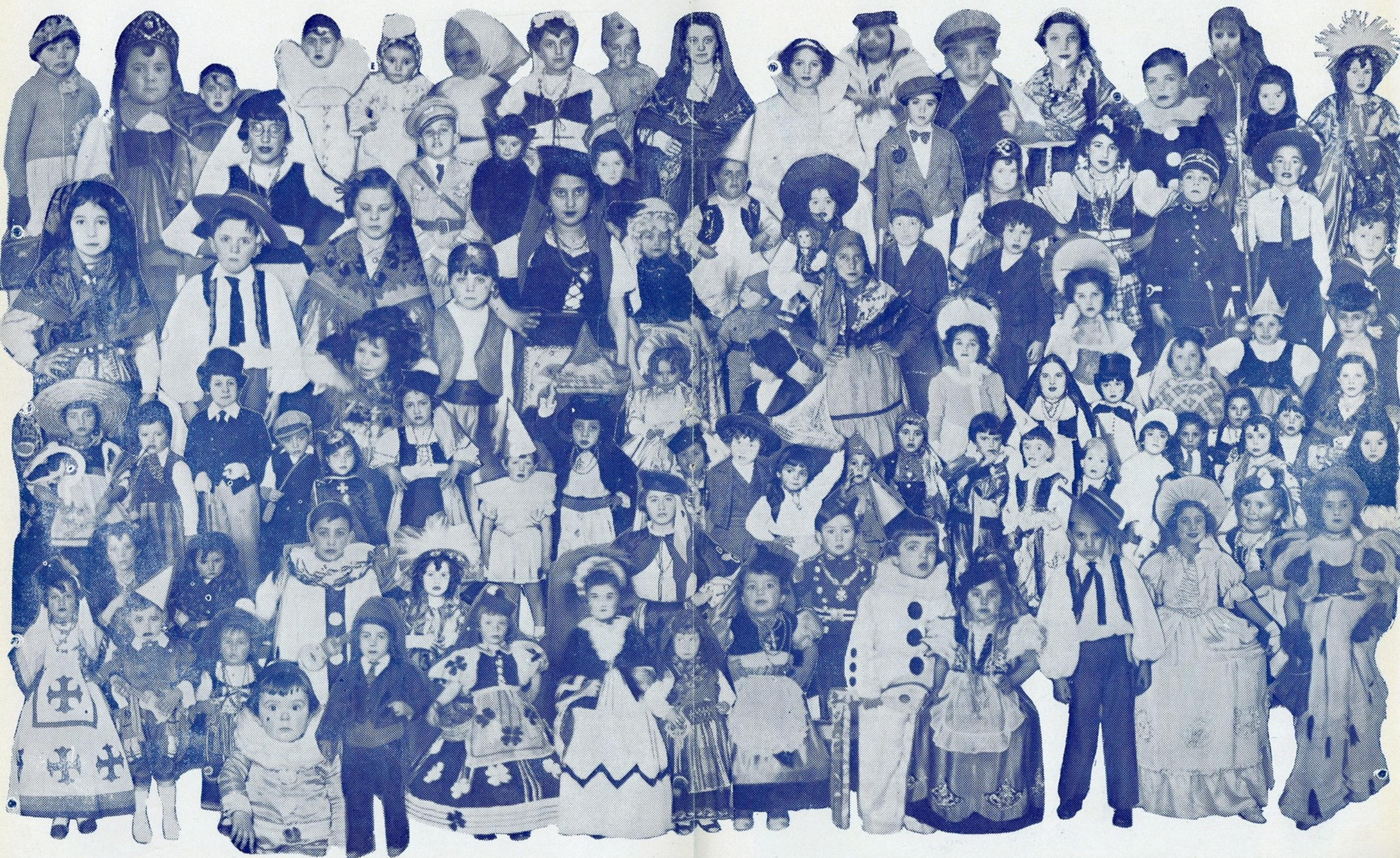
Algumas das crianças mascaradas que visitaram a redacção do «Século»