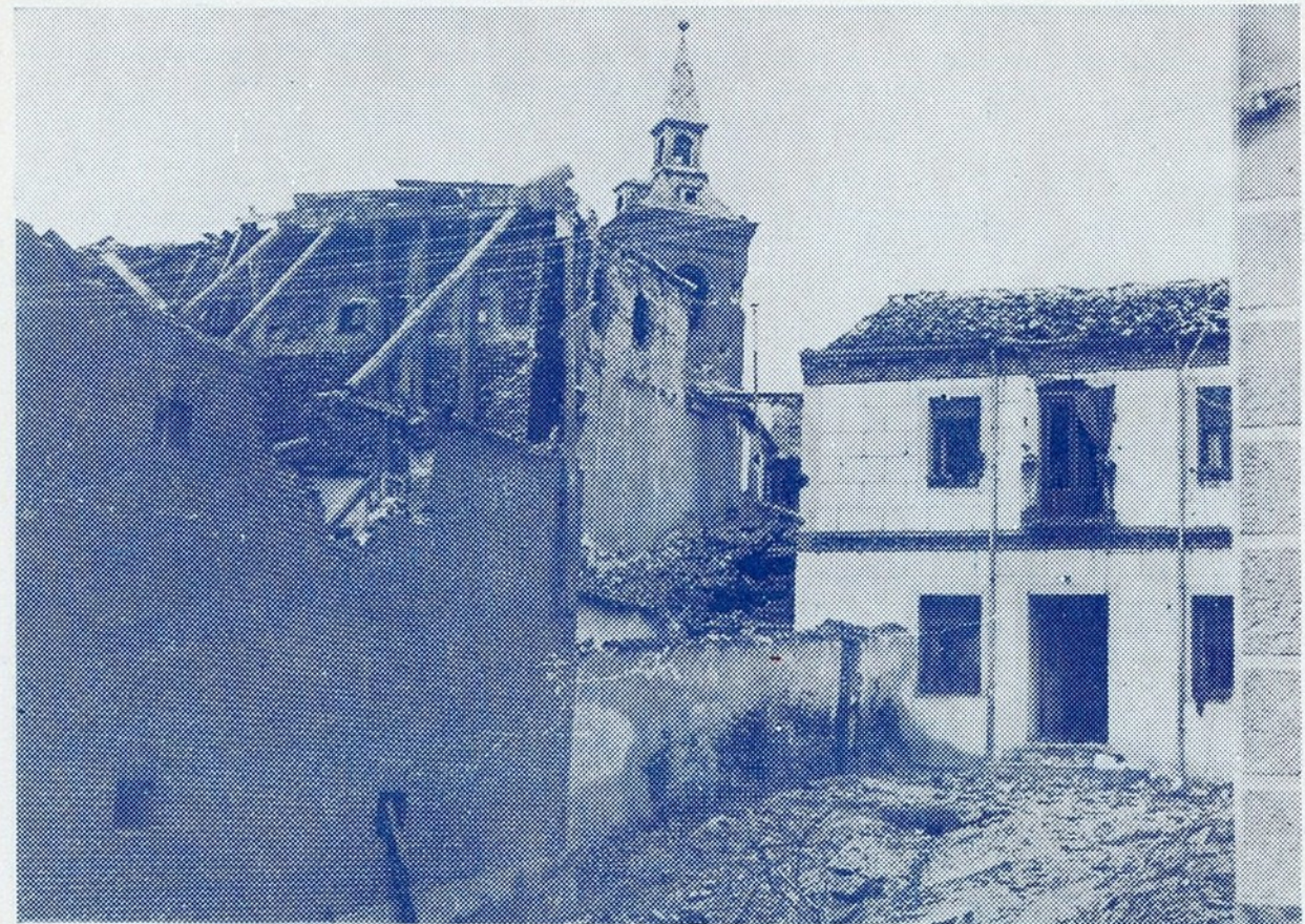
Em Pozuelo de Alarcón, na «frente» de Madrid, os vermelhos visaram em especial, com o seu fogo de artilharia, a igreja e as casas que a rodeiam. Eis um doloroso aspecto da vila, outrora sorridente e hoje semeada de escombros