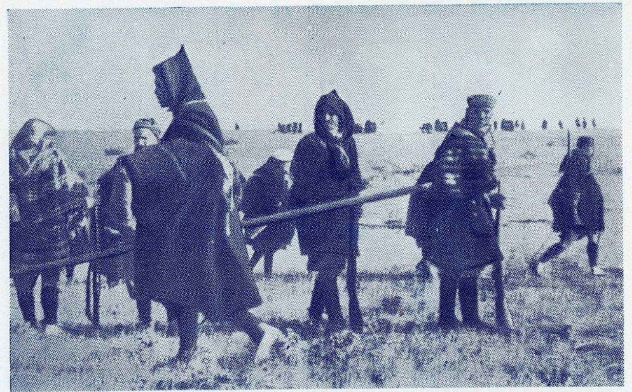
A rendição das sentinelas marroquinas, no sector da Casa de Campo, em Madrid