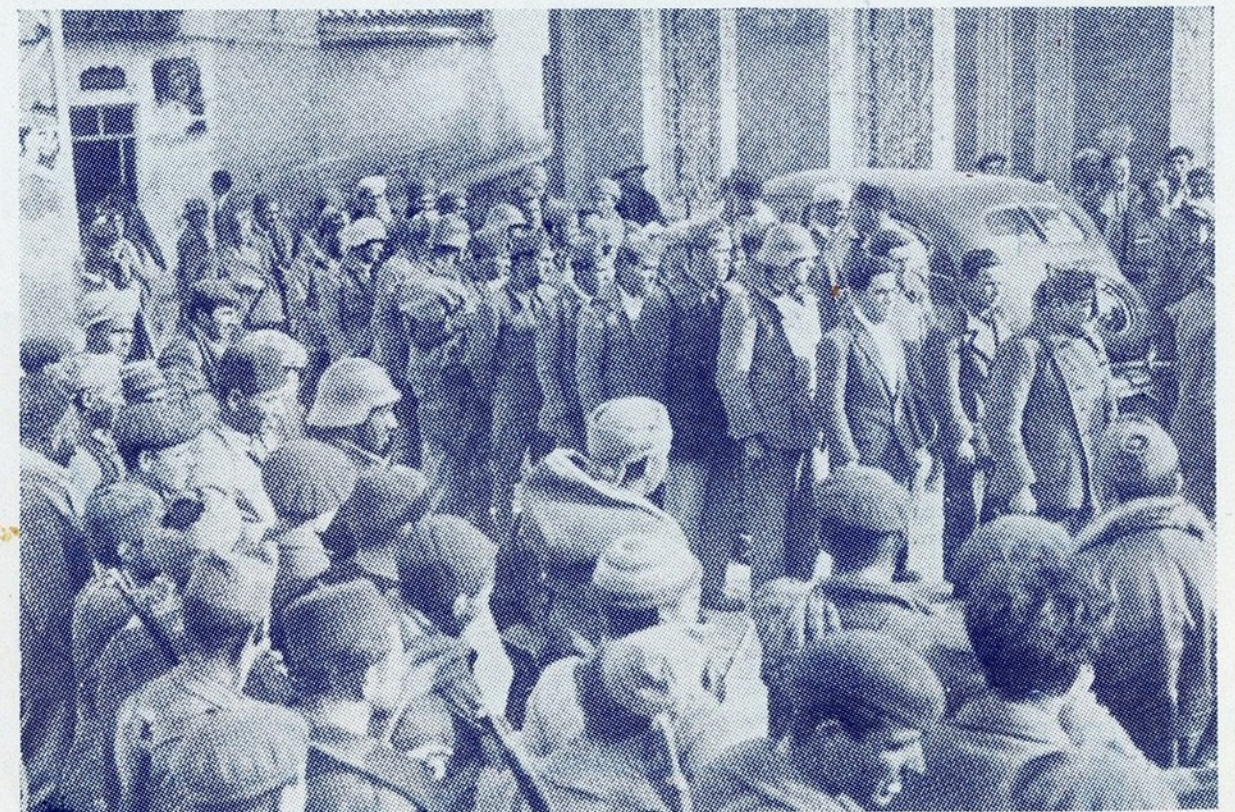
Entre alas de soldados nacionalistas, passam os prisioneiros que aqueles fizeram na região de Porcuna