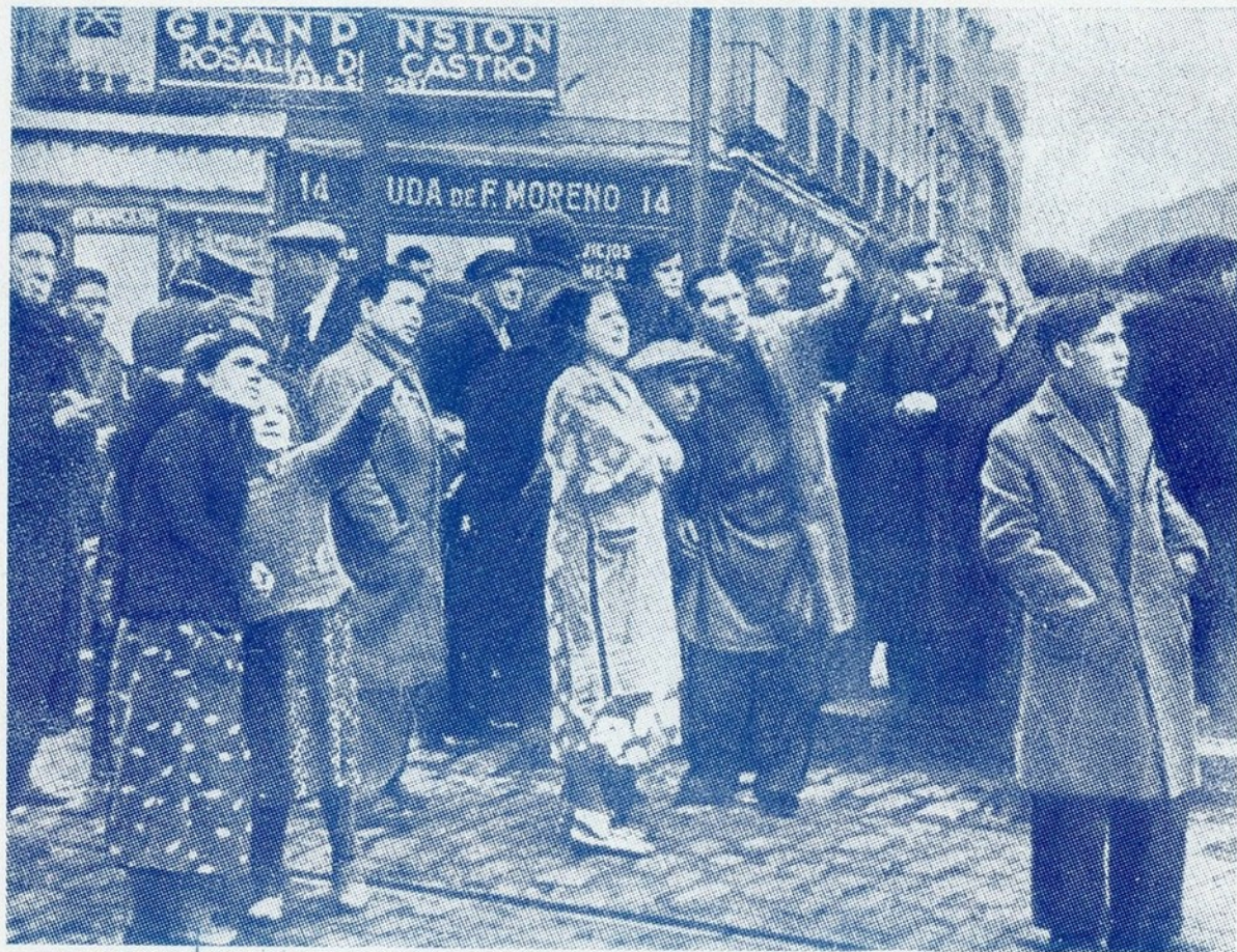
Na zona neutra de Madrid, criada pelo general Franco para servir de abrigo à população não combatente, os madrilenos assistem ansiosamente às evoluções dos aeroplanos nacionalistas