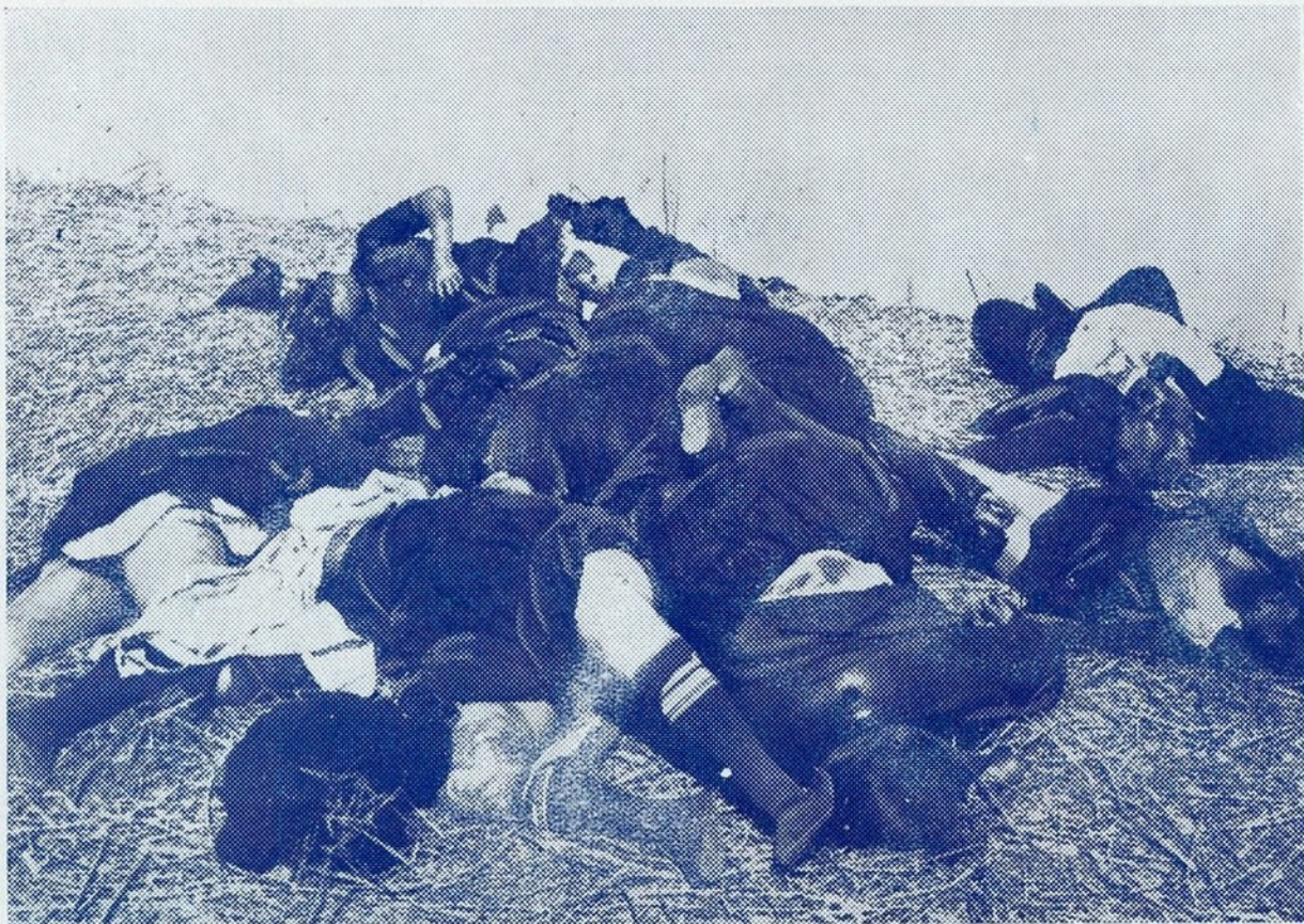
Em Almuñecar, os anarquistas procederam a um massacre horroroso. Famílias inteiras foram chacinadas com requintes de ferocidade. Mulheres, crianças, homens — todos foram sacrificados. A gravura apresenta o monte de cadáveres dos componentes duma família — sete mulheres, uma delas de 14 anos, e um homem