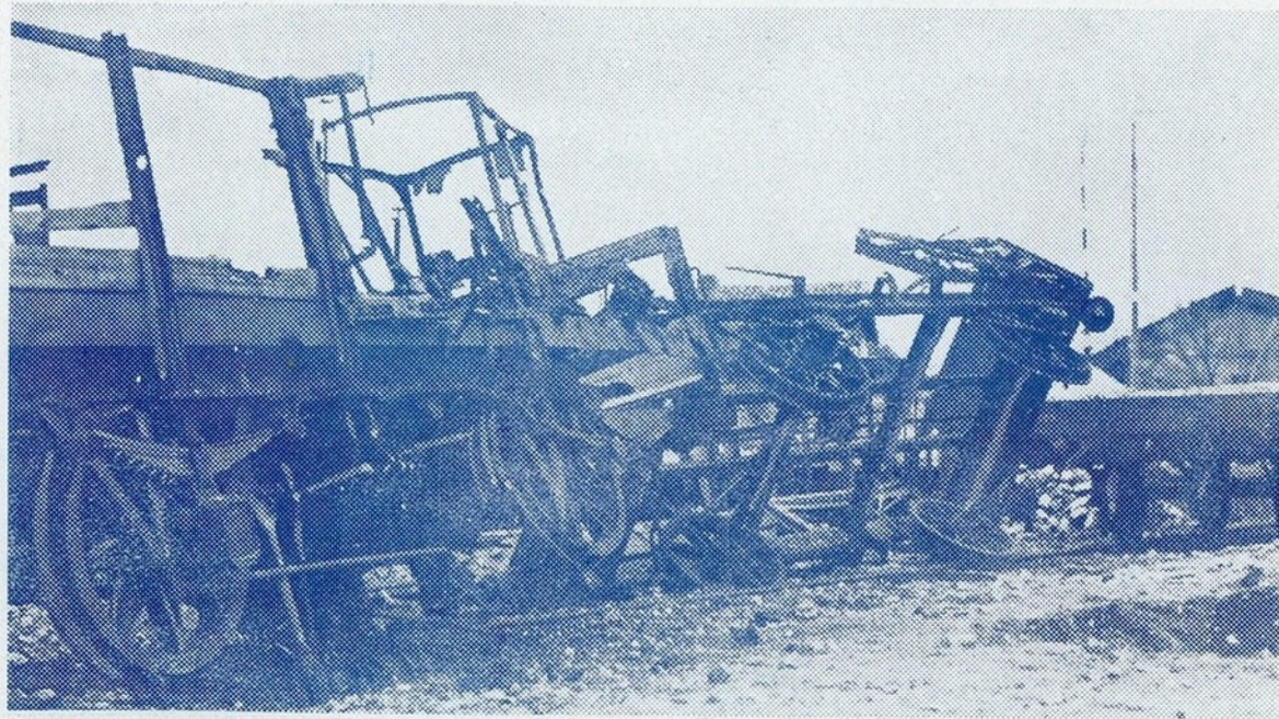
Ao verem-se perdidos, os milicianos marxistas de Pozuelo entregaram-se à destruição. Na linha ferrea estacionavam muitos vagões que eles, com dinamite, reduziram a montes de destroços, na ânsia bárbara de não deixar um só intacto