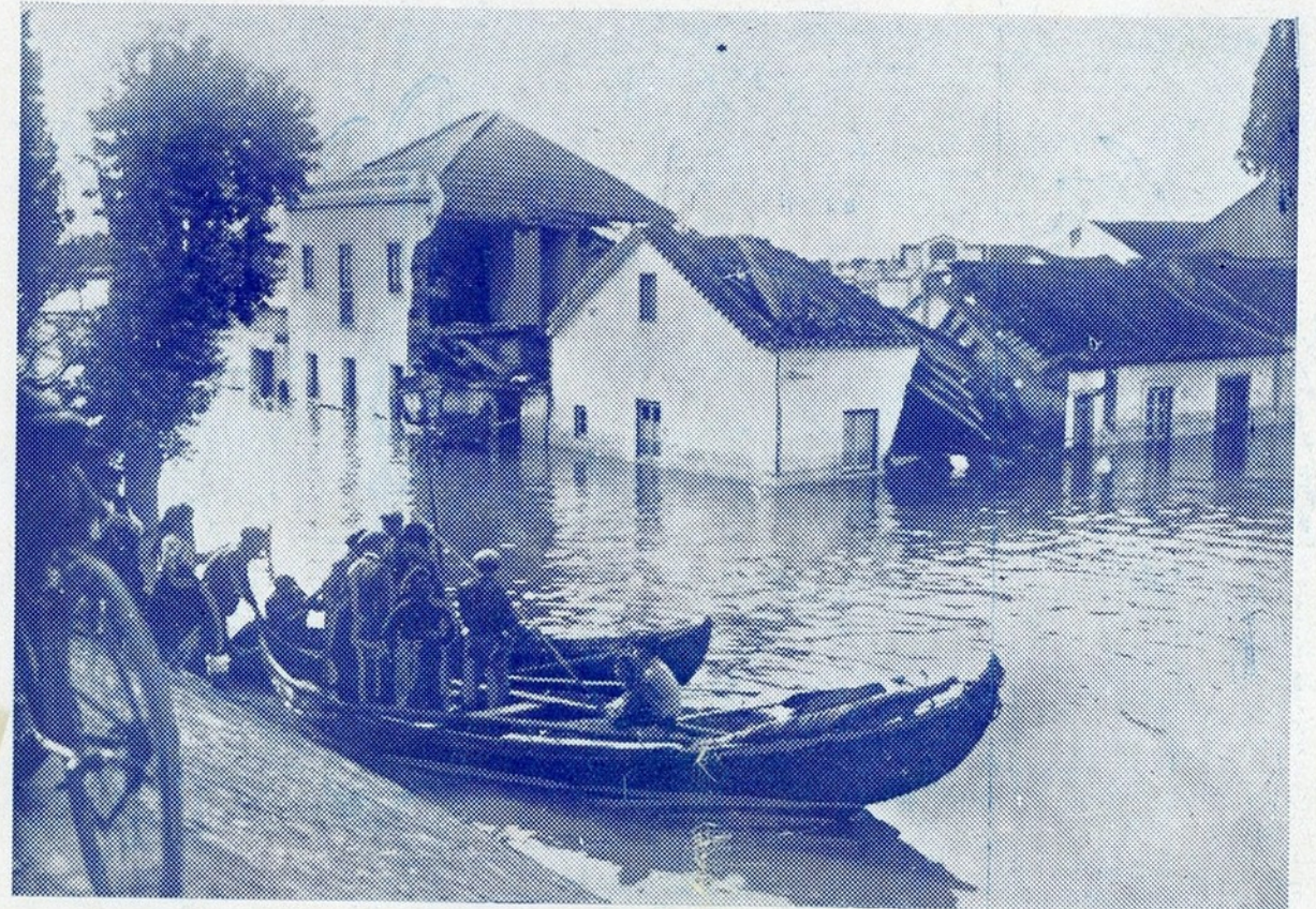
Uma casa desmoronada em Valada e as ruas inundadas, por onde só se consegue transitar de barco