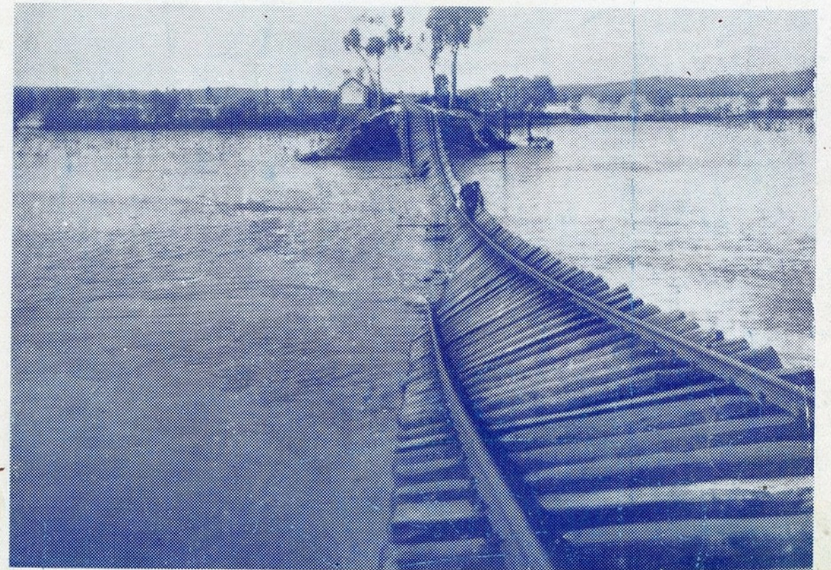
Um dos aspectos mais flagrantes e que dá bem idéa da fúria das inundações, é este que nos oferece a linha ferrea do Setil, junto ao apeadeiro do Morgado, cujo aterro foi arrastado pela água