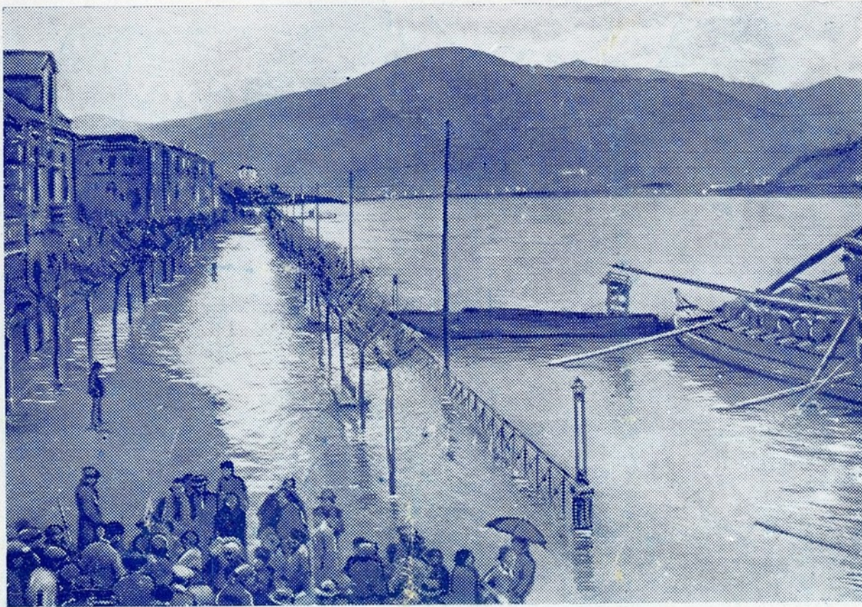
Um aspecto da cheia na Régua