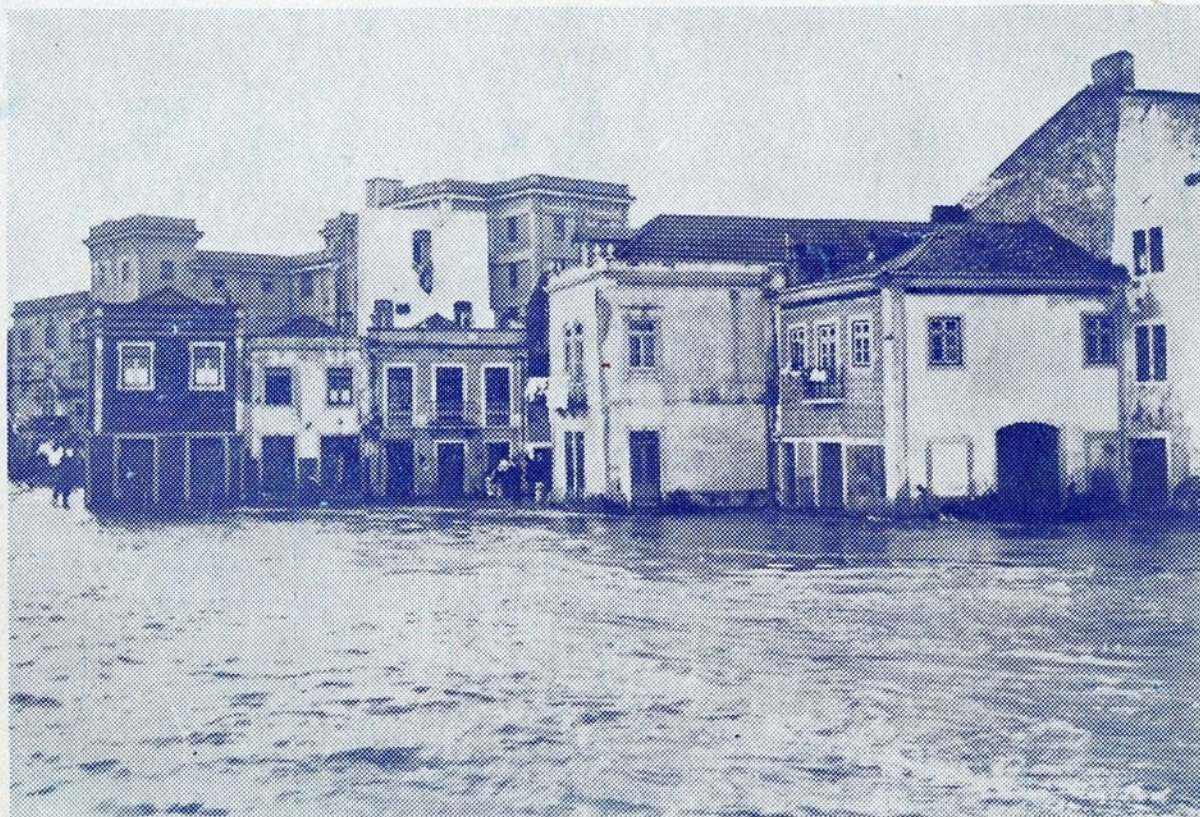
Aspecto duma rua marginal de Vila Franca de Xira, inundada pelo Tejo