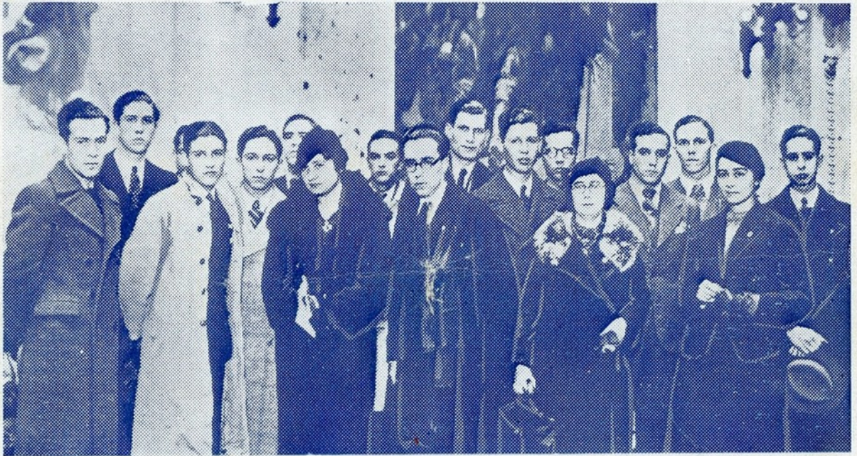
A comissão de estudantes da Universidade e dos Liceus de Lisboa que, no dia 14 do mês findo, entregou ao presidente da Assembleia Nacional uma mensagem de concordância com a reforma