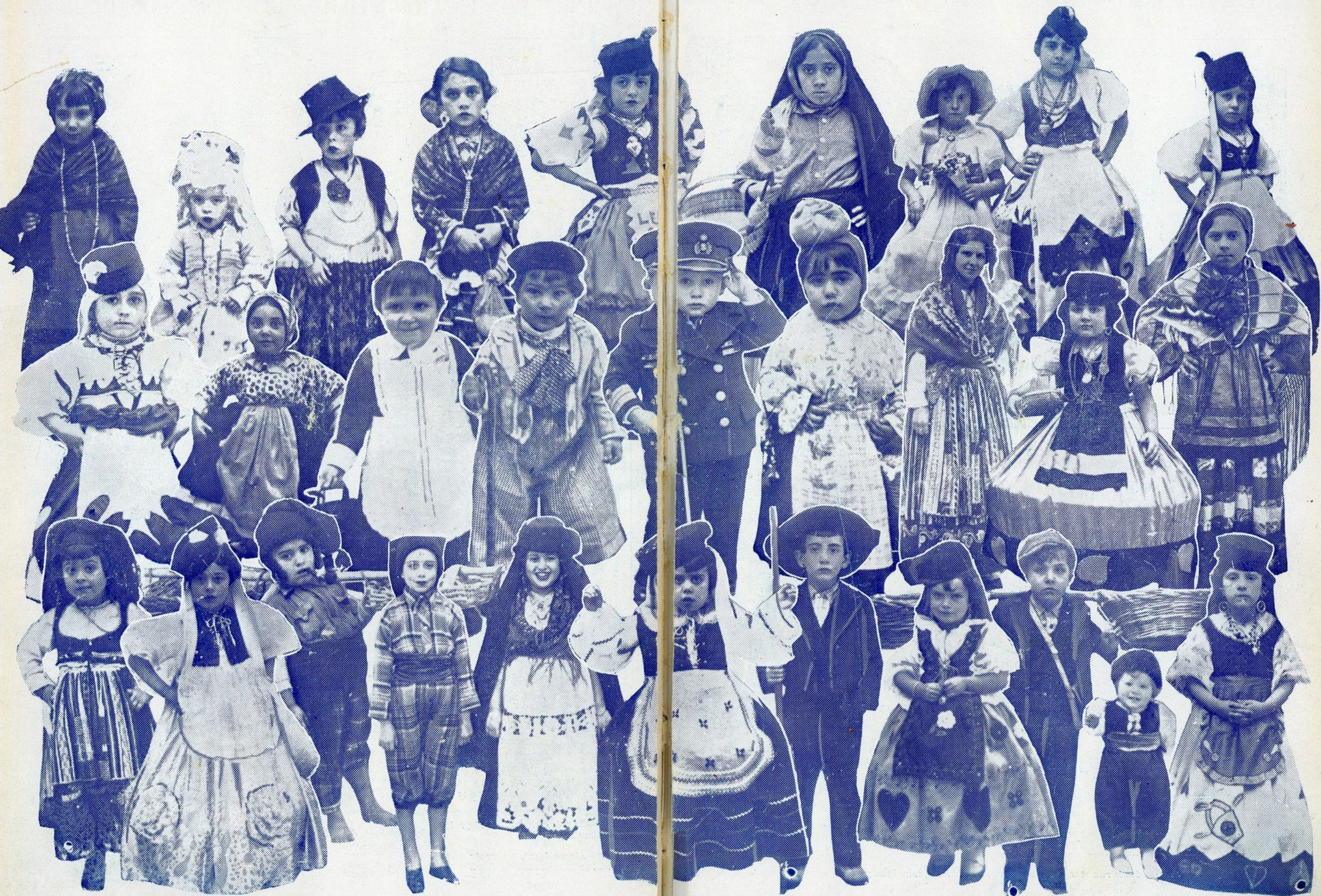
Algumas das inúmeras crianças que visitaram