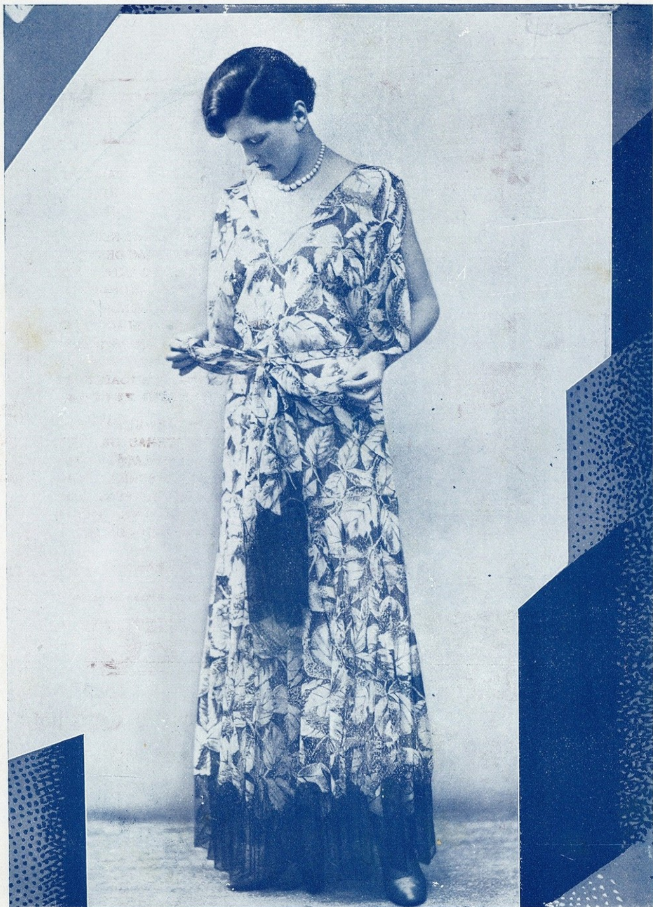
Modernissimo pijama em georgette estampado em varios tons, guarnecido a musselina preta