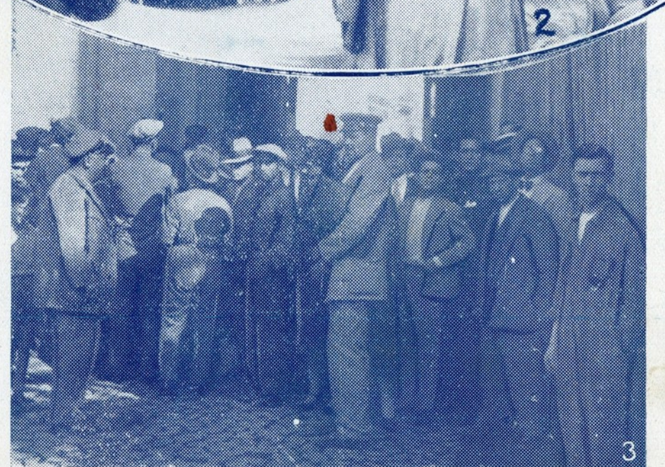
3—O povo, acumulado à porta do Necrotério, por ocasião do reconhecimento dos cadáveres das vítimas