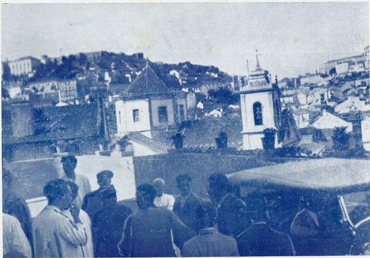
Chegada dum automovel com feridos ao hospital de S. José