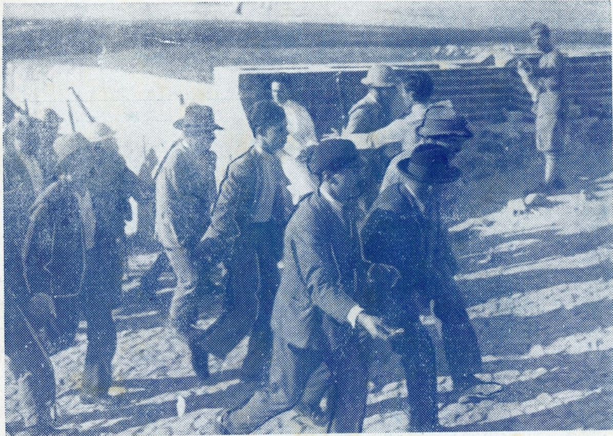
Civis revoltosos que foram aprisionados num automovel, com armamento, na estrada das Laranjeiras