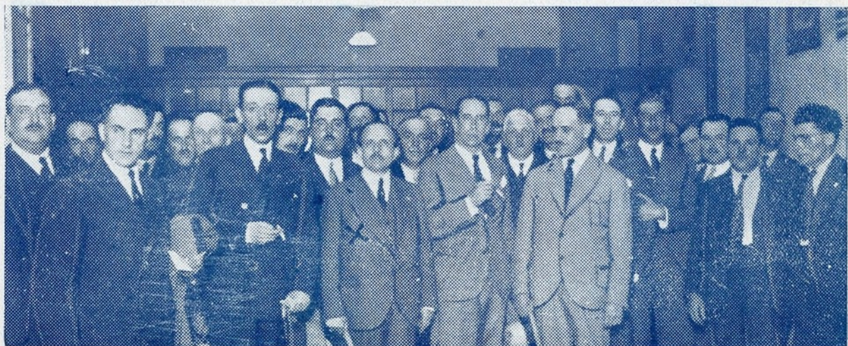
A comissão de representantes de 65 sindicatos agrícolas do norte que, sob a presidência do sr. conde de Agueda (X), veio a Lisboa pedir ao governo diversos benefícios em favor da lavoura.