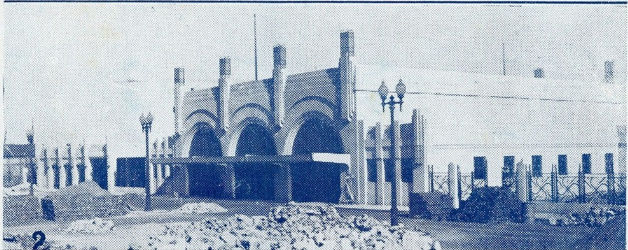
1 — A velha estação do Caminho de Ferro do Sul e Sueste, que vai ser apeada. 2 — A estação nova (ainda em obras) que será inaugurada ainda este ano.