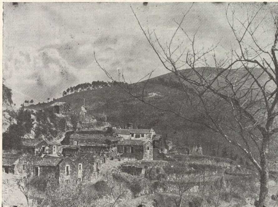
ARCOS DE VALDEVEZ — Um aspecto curioso da povoação