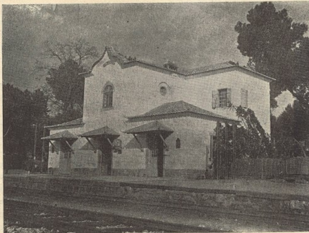
ALMOUROL — Apeadeiro

O problema é, como se vê, muito complexo e só em cada caso pode ser resolvido.