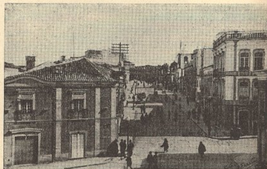
LOULÉ — Largo Dr. Bernardo Lopes

Os louletanos, com a organização das suas Festas carnavalescas, não se esque-