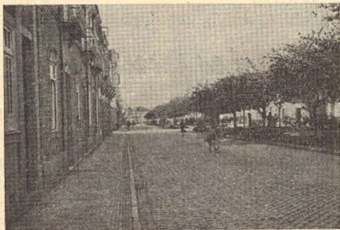
LOULÉ — Avenida José da Costa Mealha (Lado esquerdo)

As festas que a Vila de Loulé realiza, todos os anos, pelo Carnaval, em benefício da Santa Casa da Misericórdia e Hospital