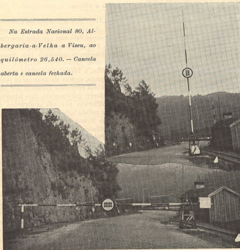
Na Estrada Nacional 80, Albergaria-a-Velha a Viseu, ao quilómetro 26,540. — Cancela aberta e cancela fechada.

Fizeram-se 20 encerados para cobrir vagões.