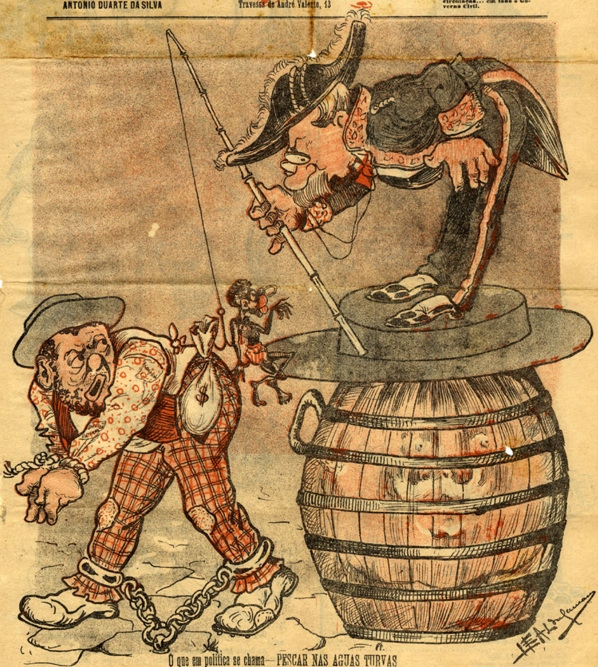
O que em politica se chama — PESCAR NAS AGUAS TURVAS

A CORJA é o Jornal de maior circulação... com todo o Go- verno Civil.