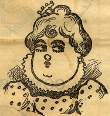
O rol da roupa suja e cartas ás modistas