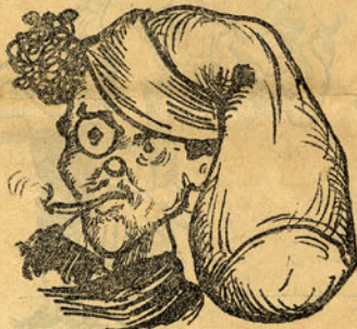
Cartas á familia pedindo dinheiro