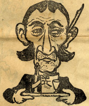
Listas de café