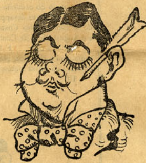
Cartas de namoro

(60 mortes, 127 tentativas de assassinato, 324 suicídios, 1234 desastres e o ultimo acto passado no outro mundo por terem morrido todos os actores!)