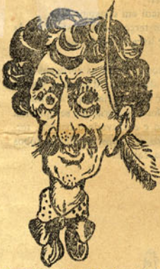
Dramas para o Príncipe Real

(60 mortes, 127 tentativas de assassinato, 324 suicídios, 1234 desastres e o ultimo acto passado no outro mundo por terem morrido todos os actores!)