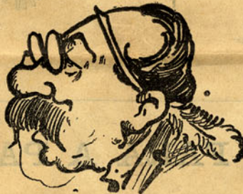
[ Decretos disparatados