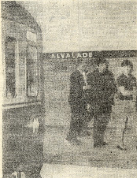
Alguns dos primeiros (poucos, aliás) passageiros do Metropolitano que chegaram esta manhã, pela primeira vez, à estação de Alvalade

Terminado o encontro, os «futebolistas» e as famílias que os acompanharam reuniram-se num piquenique, comendo cada grupo segundo as suas convicções alimentares. Não faltou o arroz integral, os croquetes de vegetais e as maçãs assadas. A acompanhar, à laia do vinho, chá de Mu e como licor, chá dos Três Anos.