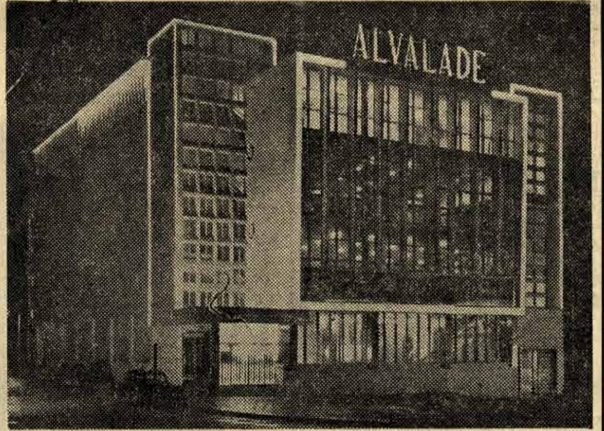
O Cinema Alvalade, que se inaugura amanhã

que, amanhã, se inaugura com o filme «O Cangaceiro», é um belo edifício apetrechado com todas as comodidades