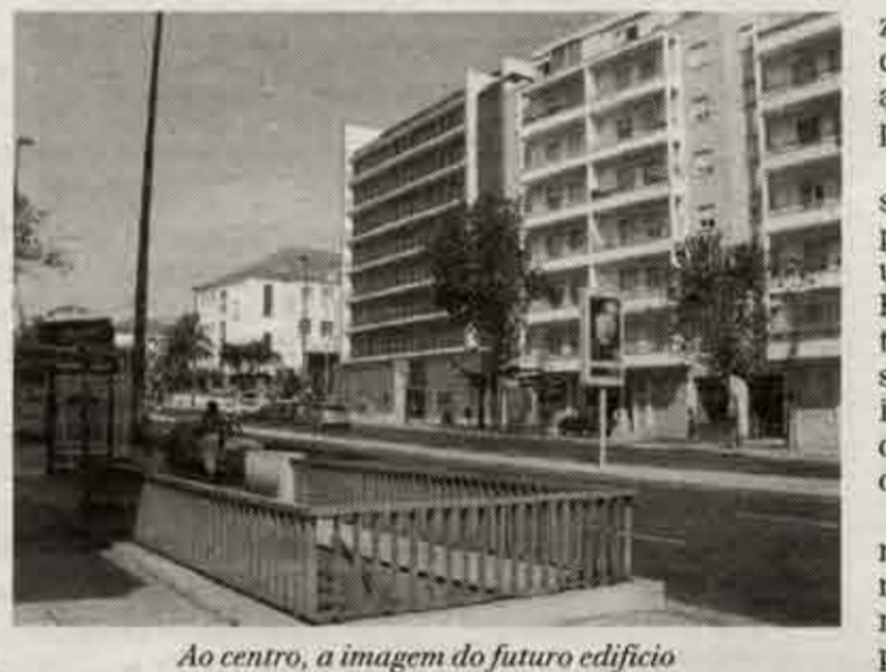
Ao centro, a imagem do futuro edifício

"São as construções já existentes que, definem as alturas do novo edifício. As dimensões são idênticas e correspondem às dos edifícios