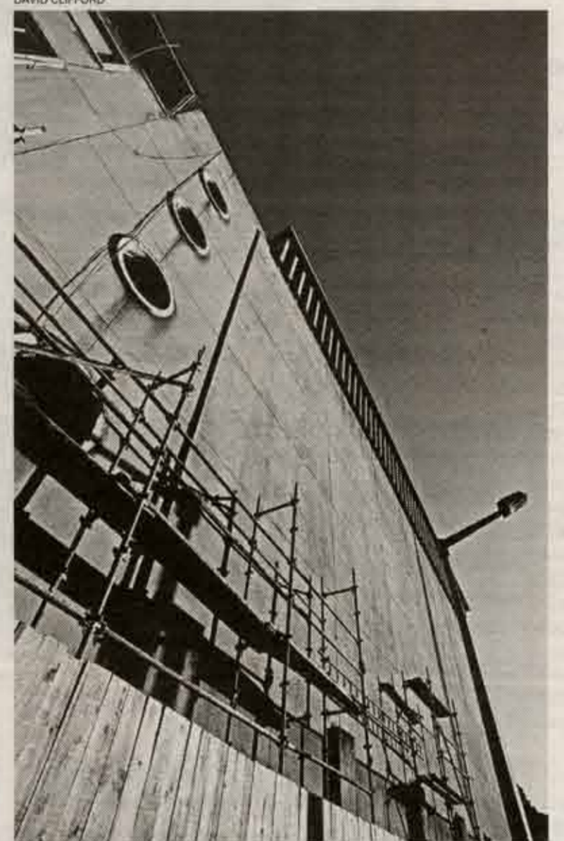
O cinema já se encontra rodeado de andaimes do a qual a manutenção da "Trata-se de uma zona con-

Embora o projecto de arquitectura "já aprovado pela câmara, seja o de um edifício único, em que se manterá a verticalidade da fachada e as suas linhas modernas", a nova edificação "não terá cores homogéneas". Os di-