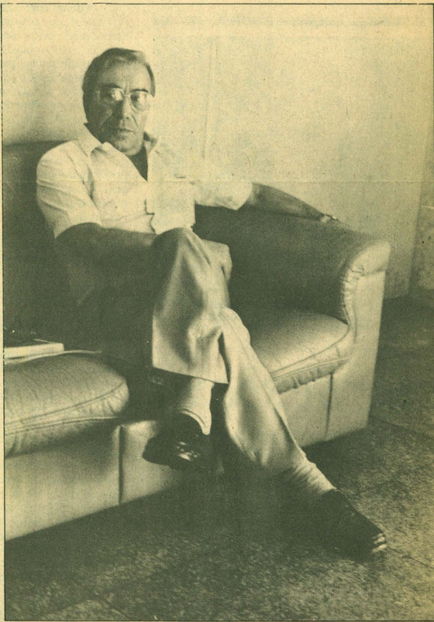
"A palavra fim não existe no bom romance".

ideal, moldado. Isso seria quase um protocientificismo, um atestado de impotência da narrativa. Quando entro na história, chamo o leitor a construir. E, se o leitor está interessado, ele não tem senão o remédio de prosseguir. É bom deixar claro que me considero em causa com o leitor. Gosto muito do filme e também do livro Laranja Mecânica , de Anthony Burgess. No hotel em que se desenrola a ação, está o escritor frustrado. De repente, ele olha o bar e vê um retrato de várias pessoas. E ele se descobre no meio. Isso é importantíssimo, porque a partir daí se instala o conflito.