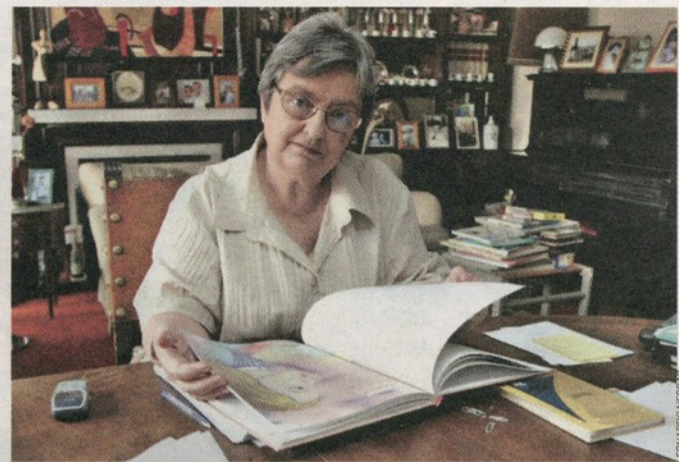
Escritora vai ser homenageada pela editora Leya