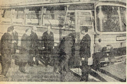
As comités dos dirigentes da Icesae, algumas entidades participaram num circuito inaugural através da rede de arruamentos de Santo António dos Cavaleiros.