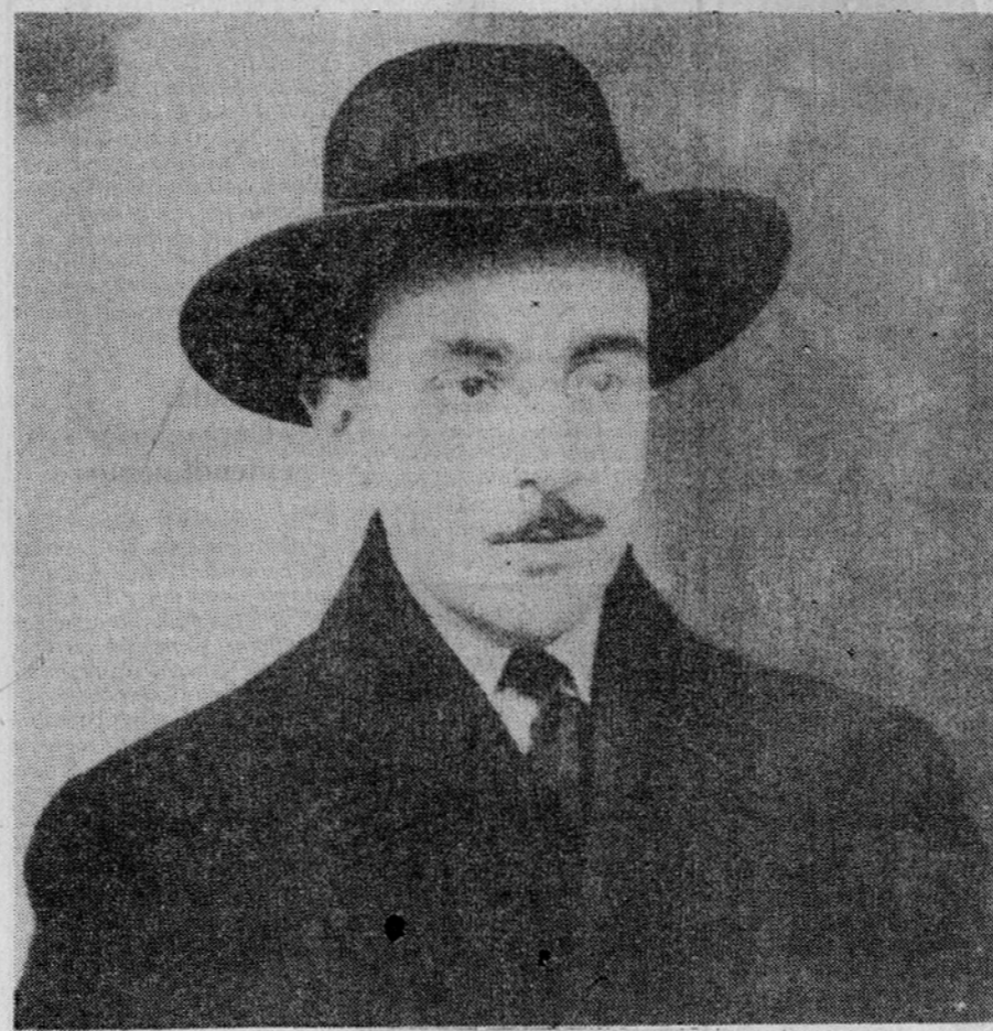
Retrato oferecido por Pessoa à sua tia Anica em 1914.

Comçando por uma recensão ao já referido Inquérito do seu agora director, aliás com uma liberdade crítica que era bem livre da sua independência, logo Pessoa se assinalou por uma rubrica — «Crónica da vida que passa» — que iria