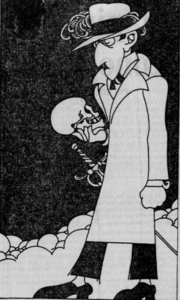
Fernando Pessoa na pena de João Abel Manta.