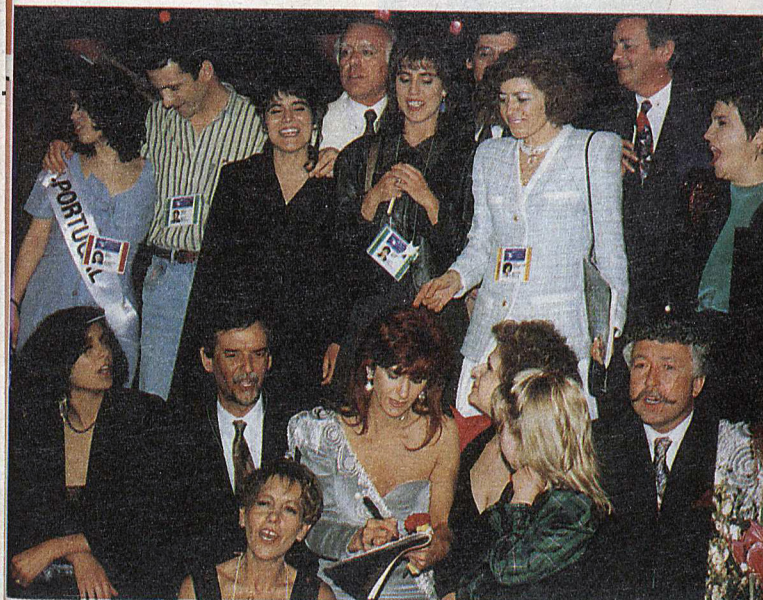
A comitiva portuguesa em convívio com a vencedora Linda Martin e Johnny Logan

Apesar de vencer o Festival RTP da Canção 92, Dina mostrou-se pouco surpreendida com a vitória alcançada, de parceria com a letra de Rosa Lobato Faria em Amor D'Água Fresca . Efectivamente e apesar da sempre relatividade de critérios nestas questões de competição, houve quem discordasse