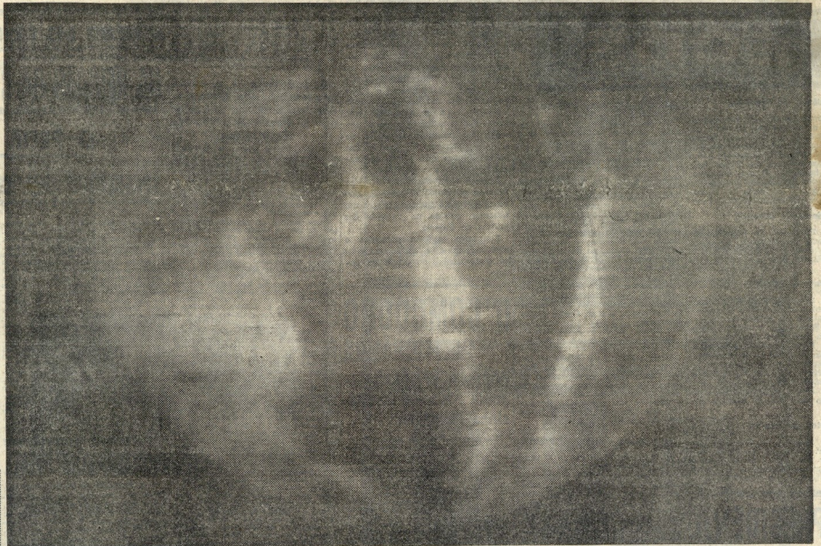
Os tripulantes da nave «Apolo-11» enviaram, ontem, para a Terra esta imagem do velho planeta que habitamos, enquanto o veículo voava a caminho da Lua. O polo Norte aparece, na imagem, à esquerda

Na 15.ª e 16.ª páginas: DA MULHER E DO LAR