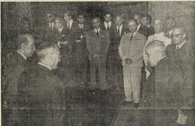
O Chefe de Estado com o Presidente do Conselho e os membros da sua comitiva na visita ao Brasil, durante a recepção de ontem, no Palácio de Belém