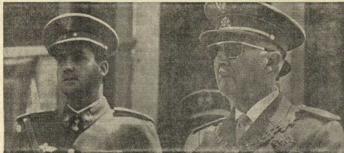
O Generalíssimo Franco e o Príncipe D. João Carlos, lado a lado, assistindo a um desfile militar em Madrid