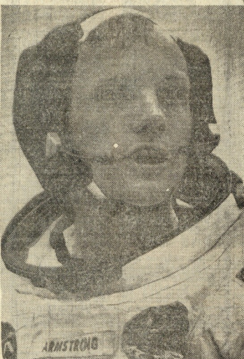
O comandante Neil Armstrong que, dentro de dias, será o primeiro homem a pisar a Lua. Dele diz a sua mãe: «A mão de Deus não é estranha à escolha do meu filho... E por isso que não tenho medo»