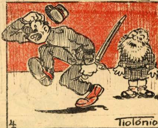
Nisto o guarda de serviço, ao ver, assim, um fedelho já de barbas como um velho, foge com medo ao feitiço!