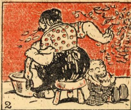
Ao pé duma cosinheira depenando um pato ganso, vai sentar-se o grande tanso todo entregue à petisqueira.