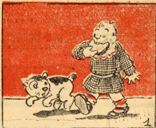
De bochecha lambuzada, e até lambendo o nariz, vai comendo este petiz um naco de marmelada.