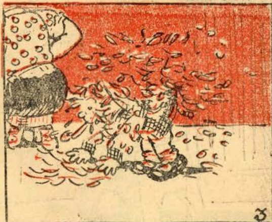
Mas a penúgem do pato, vai voando pelo ar; e acaba por se pegar às bochechas do gaiato,