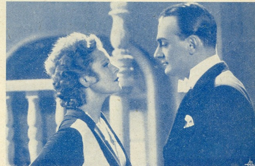
Liane Haid e Willy Forst numa cena de «O Príncipe da Arcádia», um filme-opereta encantador, que vamos vêr dentro de poucas semanas.