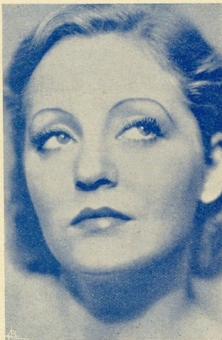
Tallulah Bankead, cujos caprichos e extravagancias surpreendem Hollywood.

Esta, por sua vez, não esboçou o menor gesto, mas retirou-se poucos minutos depois. E no dia seguinte, quando os jornalistas lhe perguntaram que tal lhe tinha parecido Greta, limitou-se a dizer. «Tam cheia de personalidade como no «écran». Não obstante, recebi uma decepção com as suas pestanas». E quando lhe perguntaram que defeito encontrara nas pestanas de Greta, respondeu com firmeza que «eram falsas». O interessante, porém, é que desde