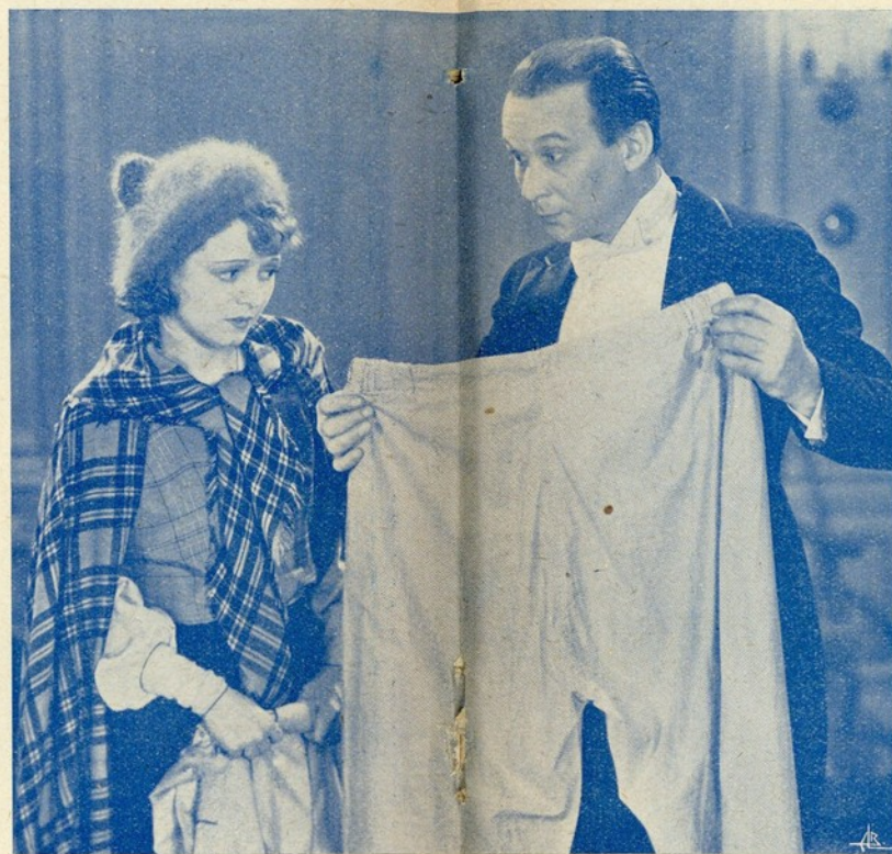
El Brendel, o célebre cómico de «1980», «Um Sonho Cór de Rosa», «Mulheres de Todas as Nações», etc., está mostrando a Janet Gaynor — a nossa inolvidável Janet — uma peça de roupa que ela tem que vestir, mas que, positivamente, não foi feita por medida.. Cena de «Deliciosa», uma produção da «Fox», com música de George Gershwin (vocês já ouviram a canção «Delishouse»?), realização de David Butler (o homem que fez «Sonho Cór de Rosa» e «1980») e interpretação de Janet Gaynor, Charles Farrell, El Brendel, Raoul Roulien e Virginia Cherrill.

Jean Harlow, que tornou famoso o loiro platina em tóda a América e mesmo na Europa, adopta um estilo próprio. Os seus cabelos, de um comprimento mediano, não frisados, mas formando largas ondas, constituem uma deliciosa aureola de luz em volta da sua graciosa cabeça, encobrem totalmente as orelhas e caem, numa curva graciosa, sobre um lado da fronte. O segredo deste estilo está, simplesmente, em dar ao cabelo uma onda muito larga, passando-lhe em seguida o pente até que a mesma onda desapareça em absoluto e se forme uma espessa madeixa, suave e esponjosa. Se a leitora tem o cabelo loiro platina e a expres-