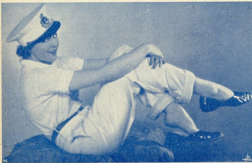
Há que tempos que a gente não vê a Liane Haid! Uma das mais encantadoras actrizes da Alemanha! Liane Haid é a protagonista, com Willy Forst — um dos primeiros galãs germânicos — do filme-opereta «O Príncipe da Arcádia», com música de Robert Stolz, que veremos brevemente.

A casa americana «Christie», que há 16 anos trabalhava em comédias, acaba de se considerar em estado de falência.