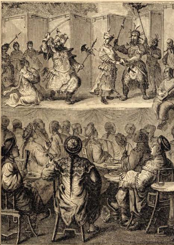
O THEATRO NA CHINA