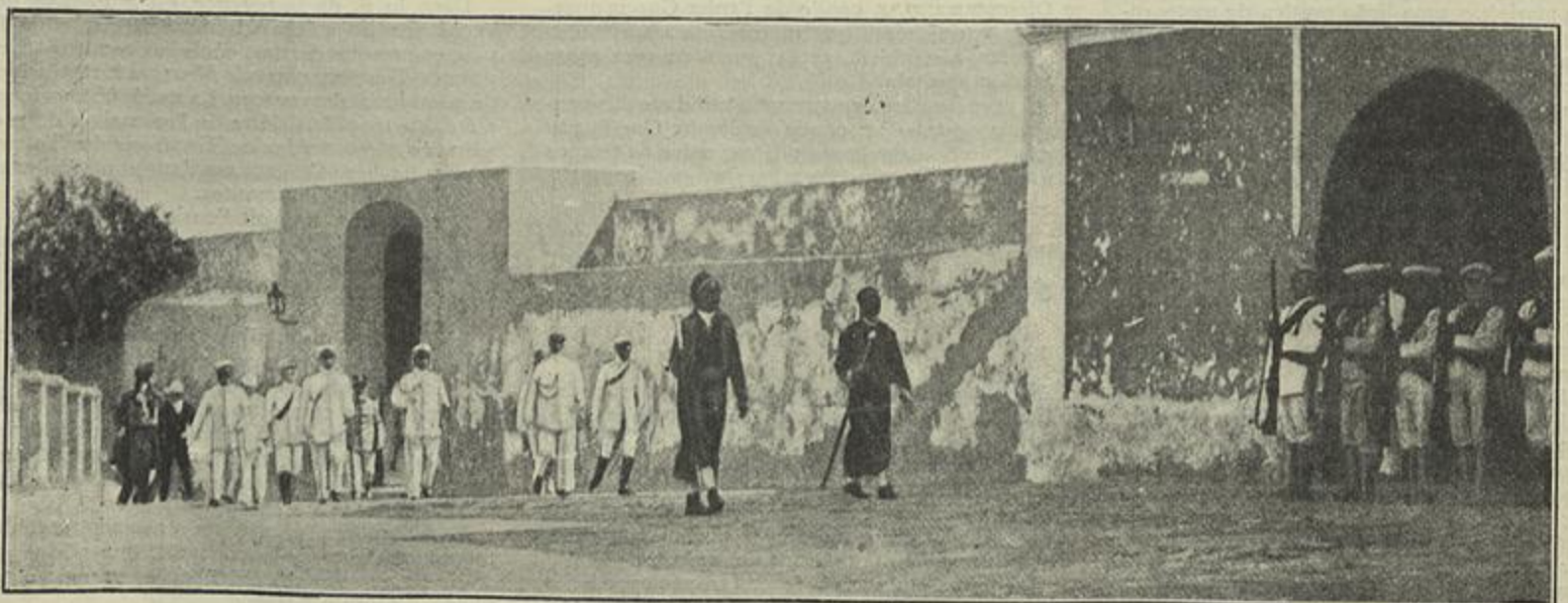
A GUERRA ITALO-TURCA—TRIPOLI—O POSTO DE BOU-MILIAN OCUPADO PELOS MARINHEIROS ITALIANOS—A BANDEIRA ITALIANA ARVORADA NA CIDADE —O ESTADO-MAIOR DA ESQUADRA ITALIANA ENTRANDO NO ANTIGO CASTELO DOS GOVERNADORES TURCOS—