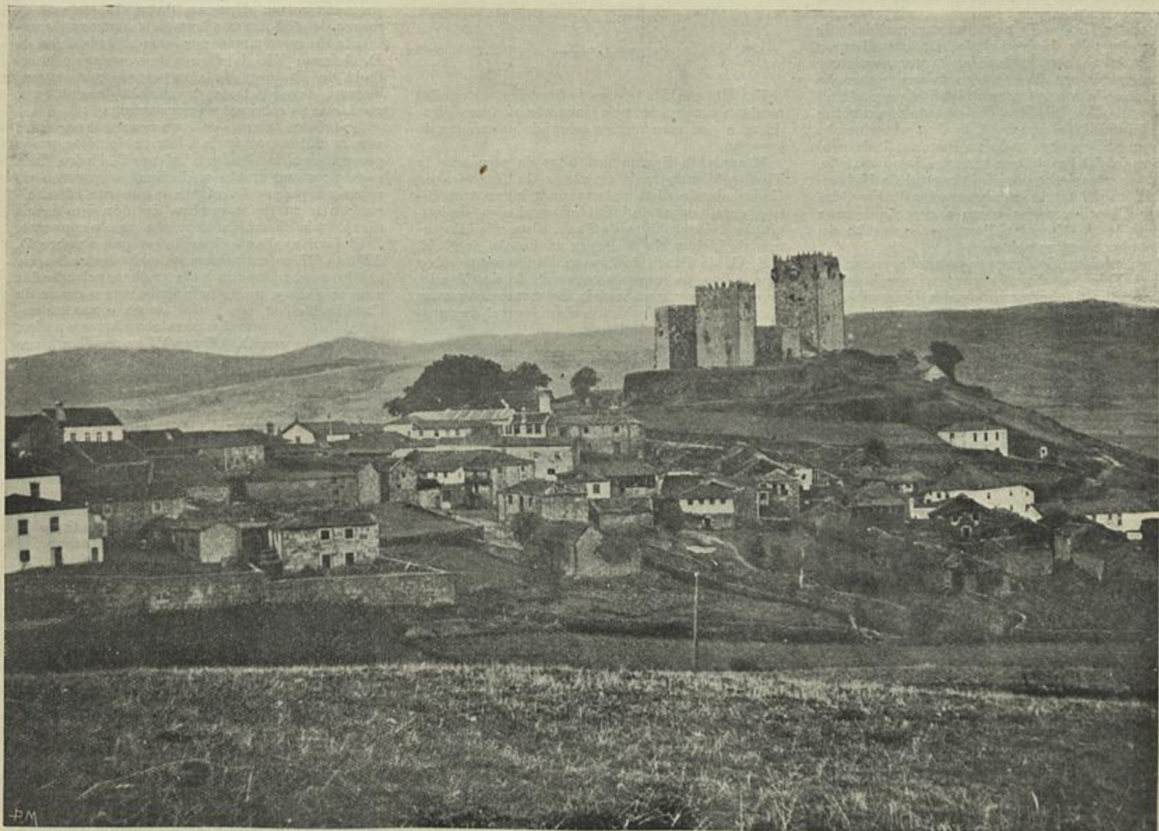
NAS FRONTEIRAS DE PORTUGAL — MONTALEGRE

Infelizmente, o sangue está correndo, mães amaldiçoarão talvez, agora mesmo, os impulsos de amor e os estímulos genesicos, e novas ambições, grandiosos sonhos de posse, occultos