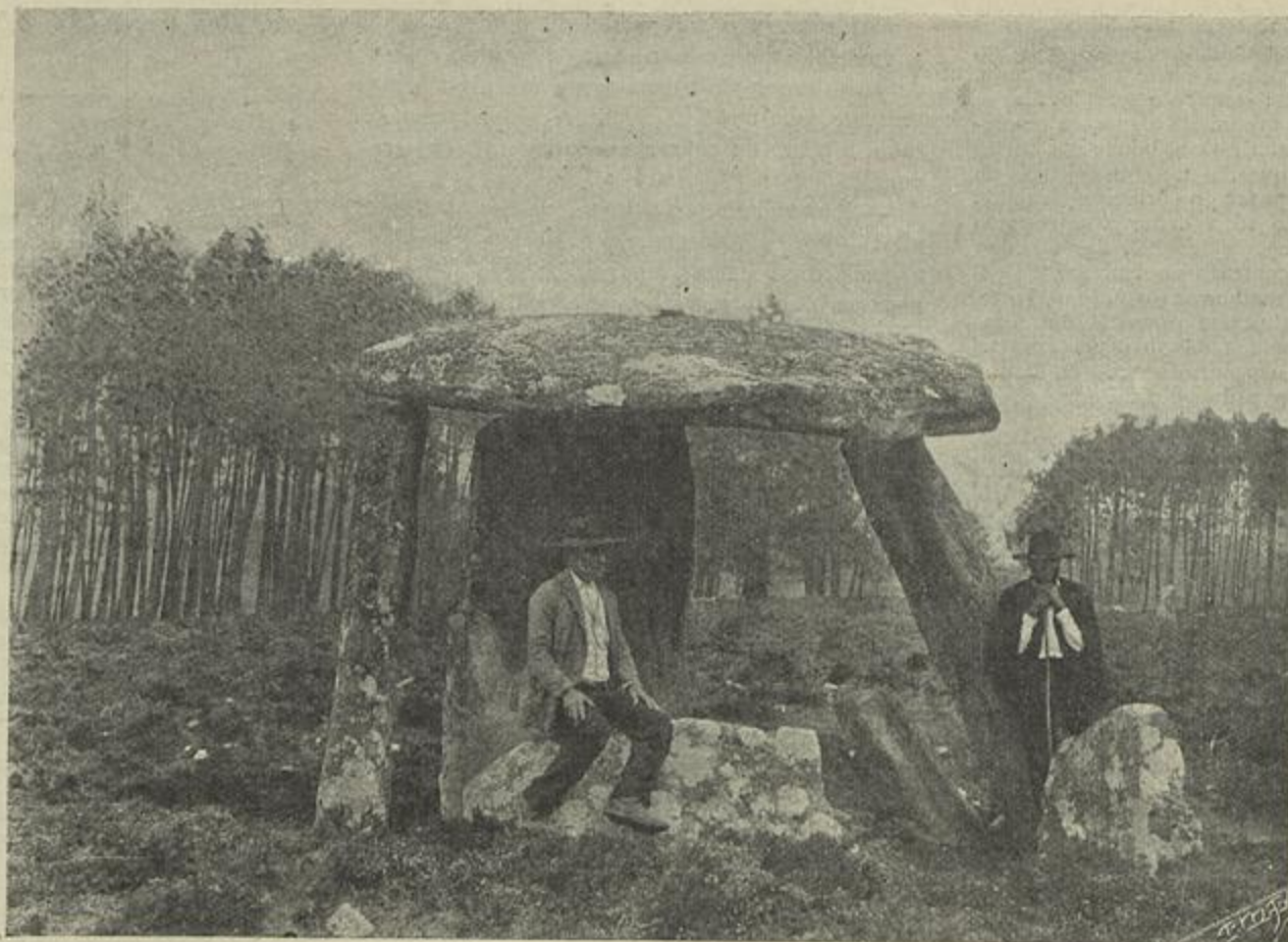
O DOLMEN DA PEDRA DE ARCA, EM PARANHO, SERRA DO CARAMULO

senta-nos a correcção do seu trabalho que bem merece aplausos porque ella sabe dar a todos os seus papeis um cunho verdadeiro e real que mais lhe faz sobressair os predicados que a tornam uma figura de destaque no nosso meio teatral.