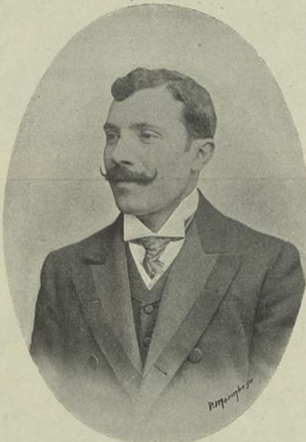
CONDE DE PENHA GARCIA

O sr. conde de Penha Garcia, que tanto se distinguuiu como parlamentar, como por seus estudos financeiros e de direito internacional, o que lhe permitiu o ser ministro da fazenda, em 1906, no gabinete organizado por Luciano de Castro, vae agora revelar uma nova applicação dos seus