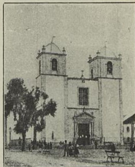
A IGREJA MATRIZ DE S. TIAGO

Aos almadenses, residentes dentro e fóra, perto e ao longe do torrão aprazivel do seu berço natal, convido a que meditem no que deixo exposto nas desataviadas linhas d'esta minha humilde prosa, filha, contudo, sem duvida alguma, do meu proprio intimo e sentido affecto a uma povoação a que me confesso grato e no cemiterio da qual, na valla commum, o indecifrável destino me fará repousar, com muitas probabilidades.