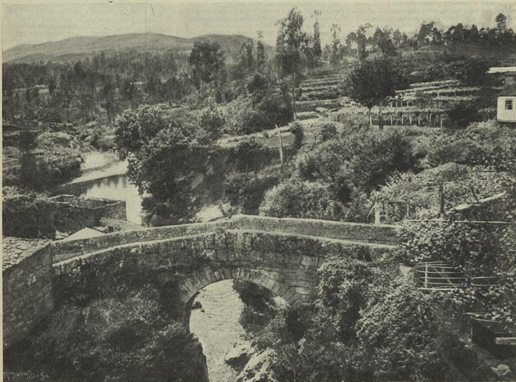
ALTO MINHO — ENTRE MONSÃO E MELGAÇO, ONDE OS CONSPIRADORES TENTAM FAZER INCURSÃO