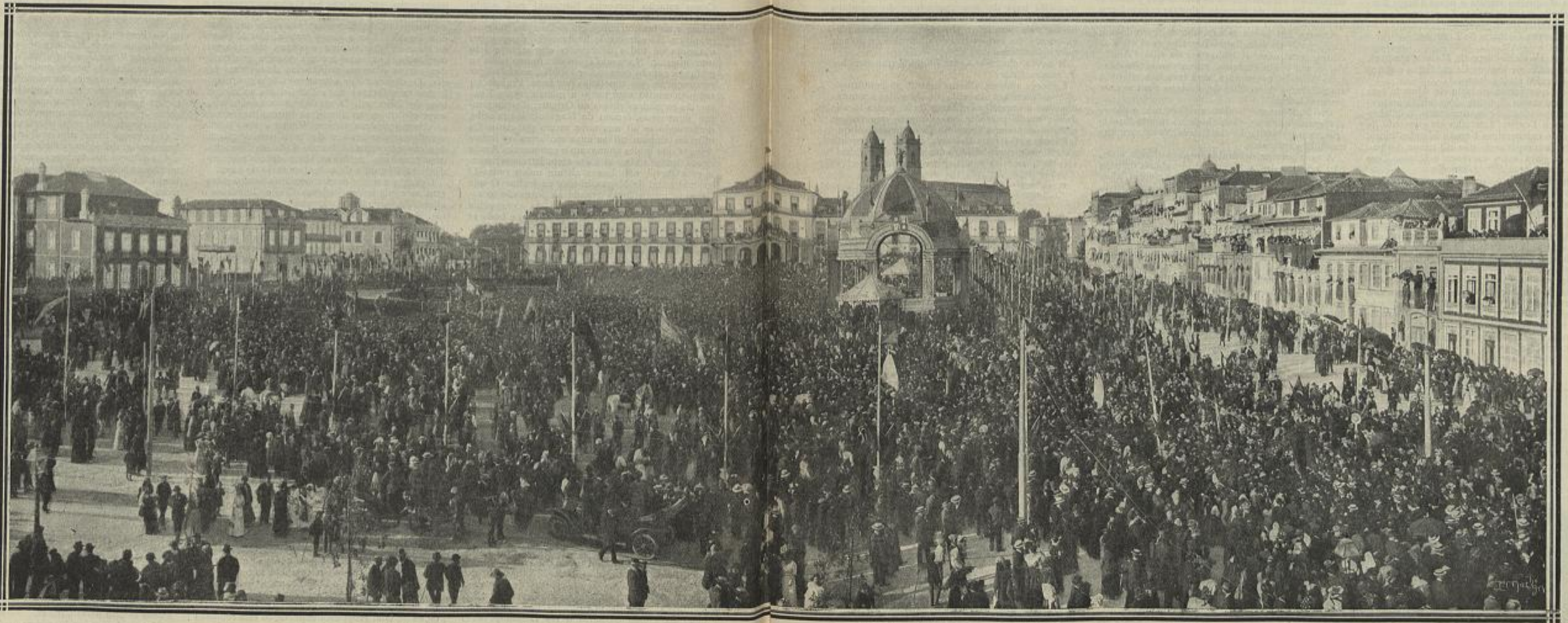
NO PORTO — CHEGADA DO CORTEJO CIVICO Á PRAÇA DA REPUBLICA, ONDE É LANÇADA A PRIMEIRA PEDRA PARA O MONUMENTO COMEMORATIVO — (Fotografia do sr. Emilio Biel, cliché da «Mala da Europa»)