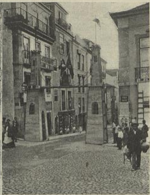
EM LISBOA — ILLUMINAÇÕES NA RUA AUGUSTA — A RUA AUREA — A LUZ DO POÇO DOS NEGROS — NO LARGO DE CAMÕES — NO LARGO DO POÇO NOVO