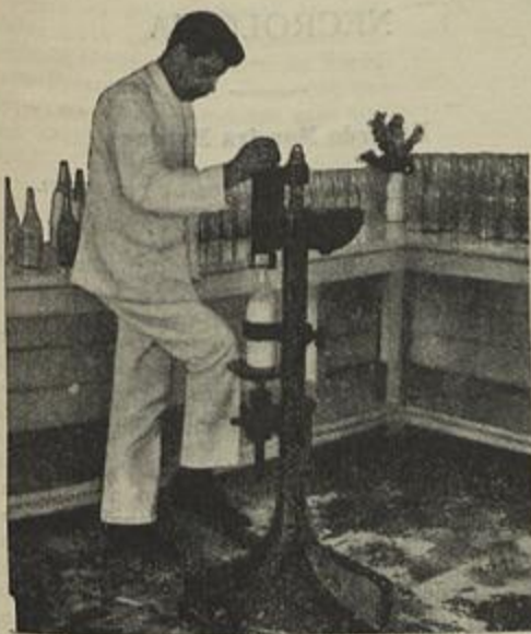
CAPSULAGEM DAS GARRAFAS

recia a nossa capital, e cuja falta era sentida, tanto na hygiene das familias como no tratamento de doentes, a cada hora verificada pelos clinicos ao prescreverem as dietas.