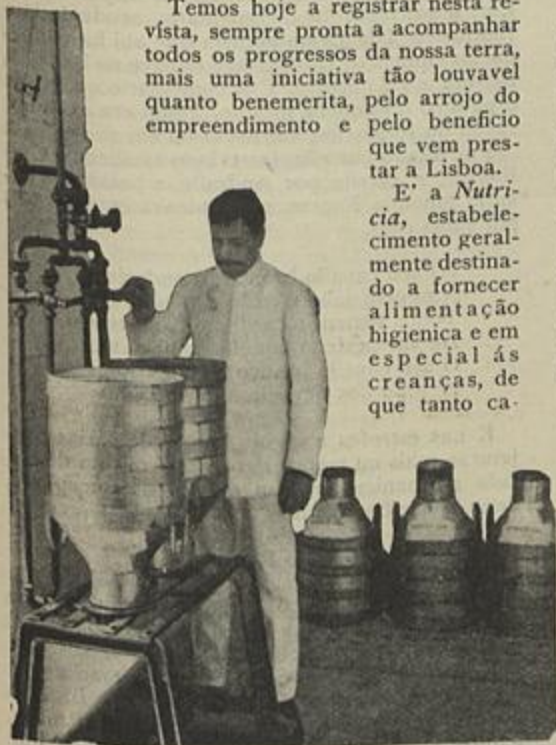
ESTERILISAÇÃO DAS VASILHAS PARA O LEITE

cedoras da Suissa, Holanda, Alemanha, França, Inglaterra, Estados Unidos e Russia, taes como Donath's, E. Barrey, Jacquemaire, Ep. Loefflund