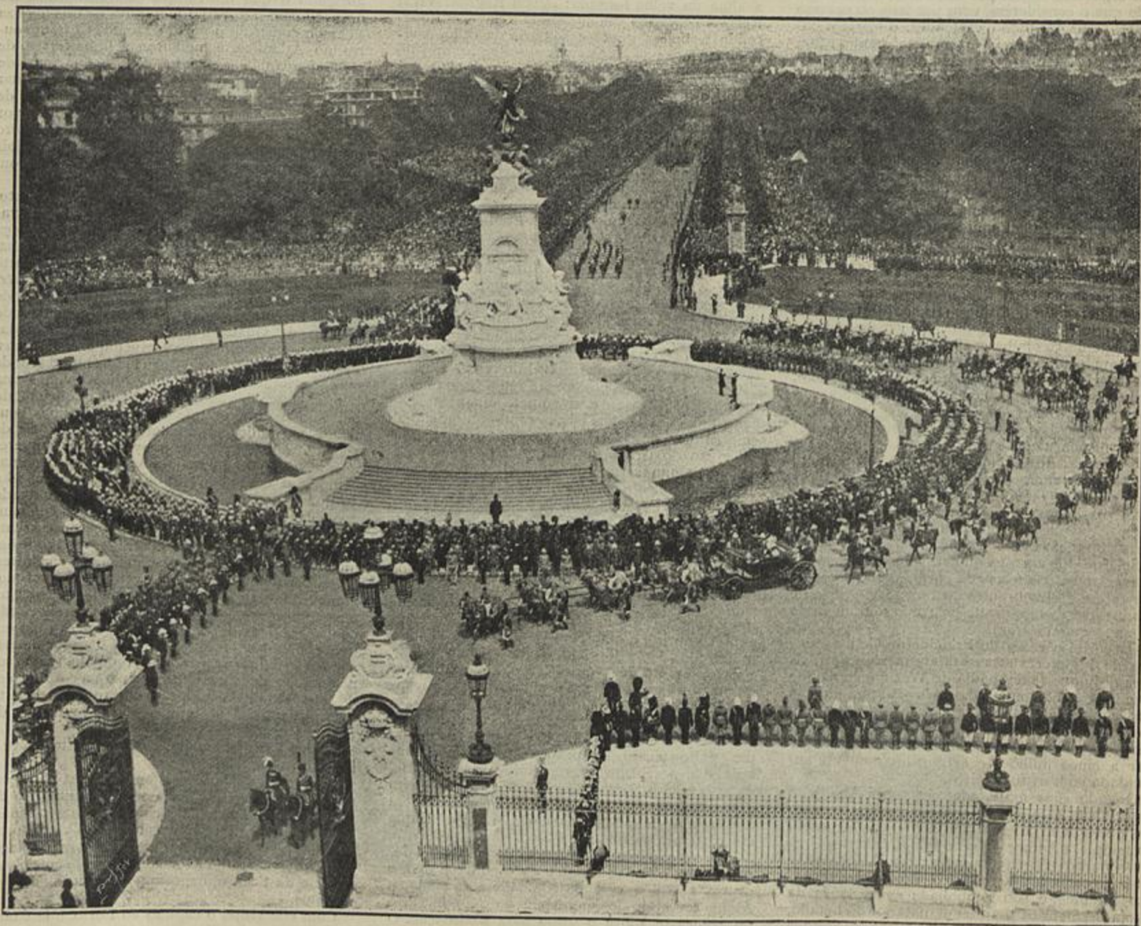
UM ASPÉTO DO CORTEJO REAL, NO REGRESSO AO PALACIO DE BUCKINGHAM — (De fotografias)