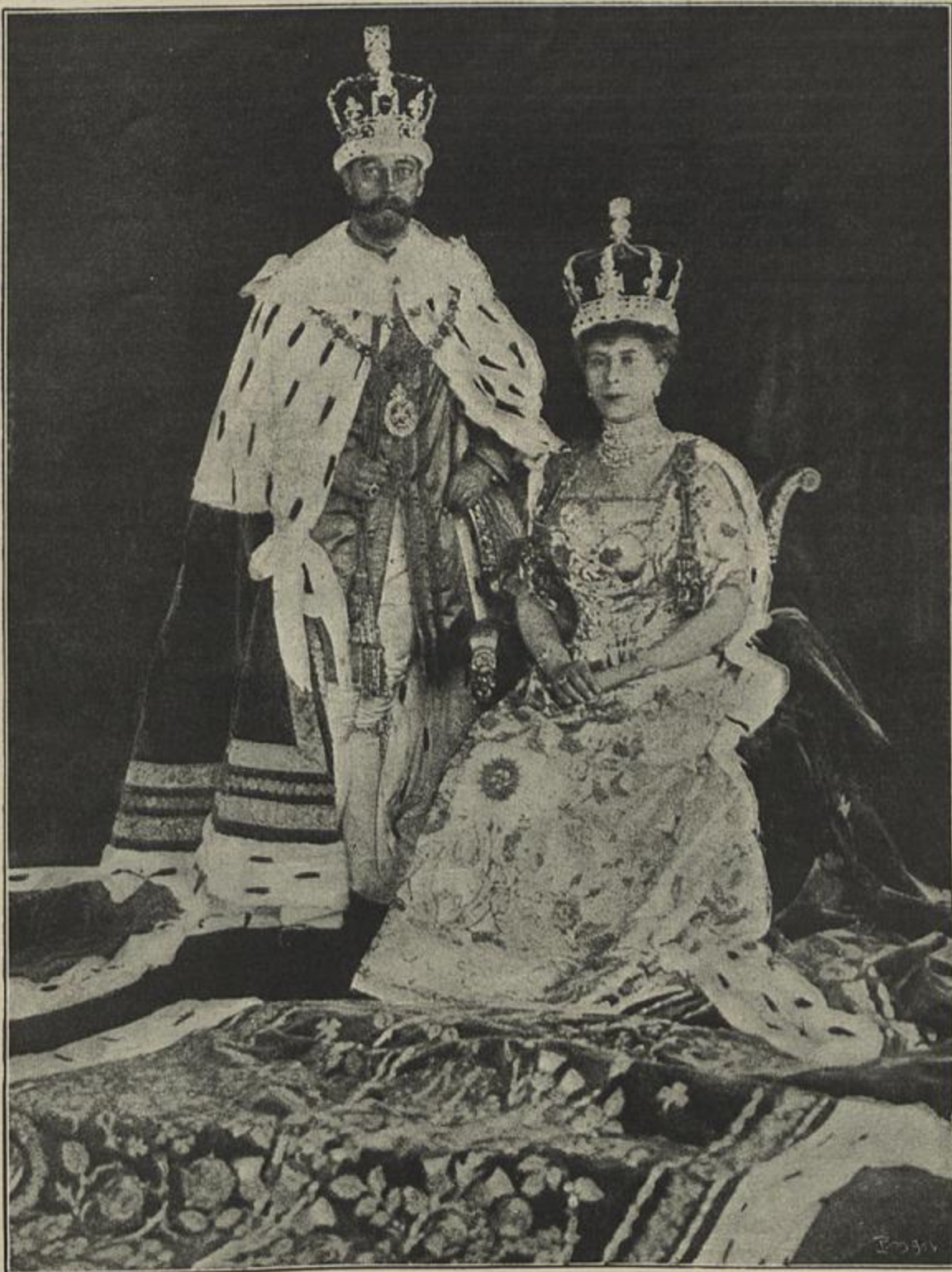
SS. MM. REI JORGE V E RAINHA MARIA DE INGLATERRA (Reproduzido do «The Ladies' Field»)