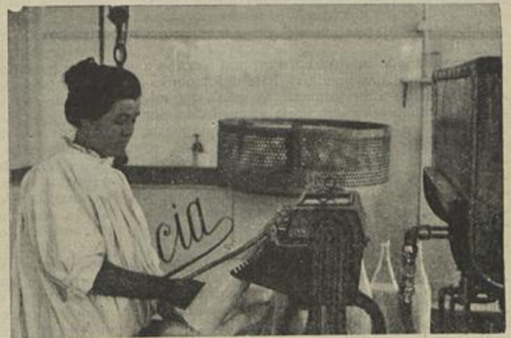
ENGARRAFAMENTO AUTOMATICO DO LEITE