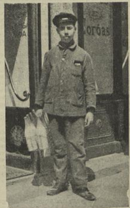
UM DISTRIBUIDOR DE LEITE DA NUTRICIA

A genuidade dos preparados amplamente garantida não corresponde menos o agradável desses preparados deliciosos ao paladar, além de