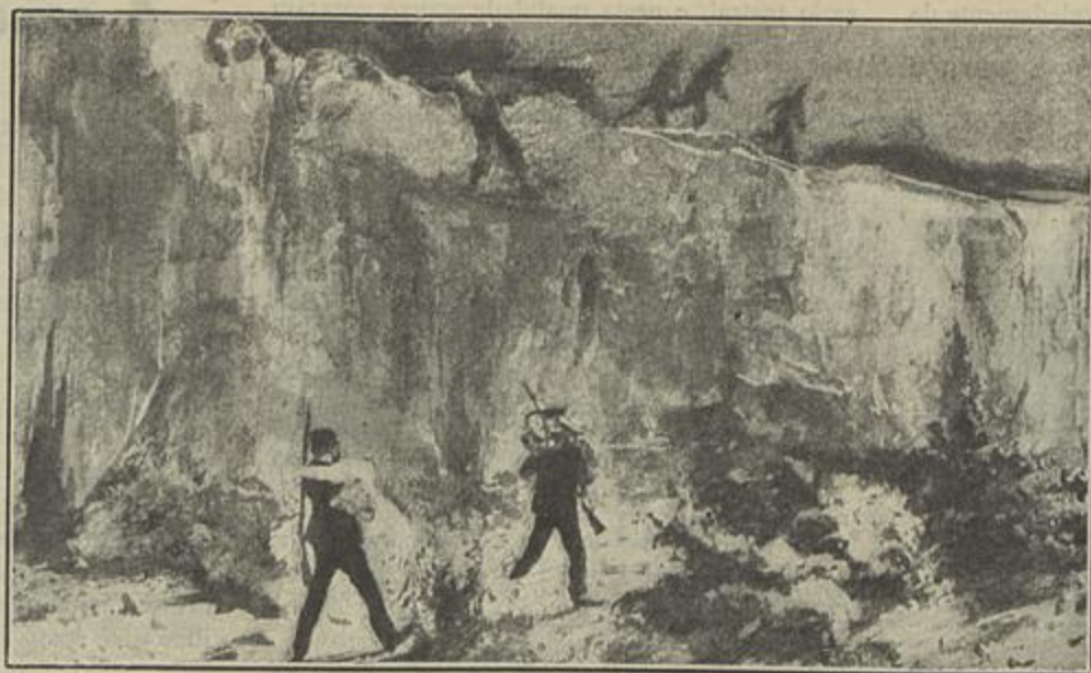
A CASA SUBMARINA, CAP. XXII — ... uns pela borda do muro com a cabeça e os braços pendidos...

«As passadas que dava, não tinham direcção fixa e umas vezes a levavam para o centro do bosque, outras para o lado da praia. Duas vezes lhe ordenei que parasse e esperasse por nós, mas inutilmente esperei a res-