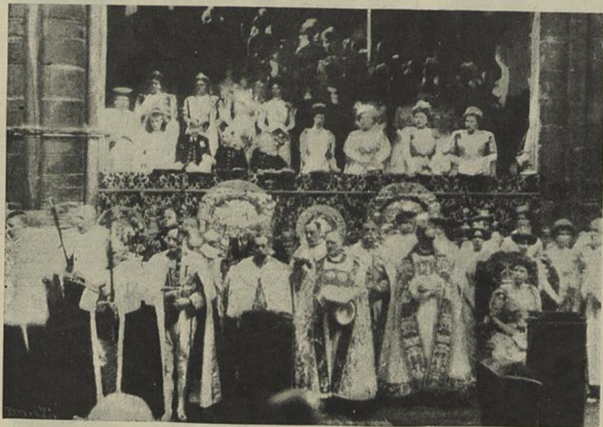
S. M. Jorge V