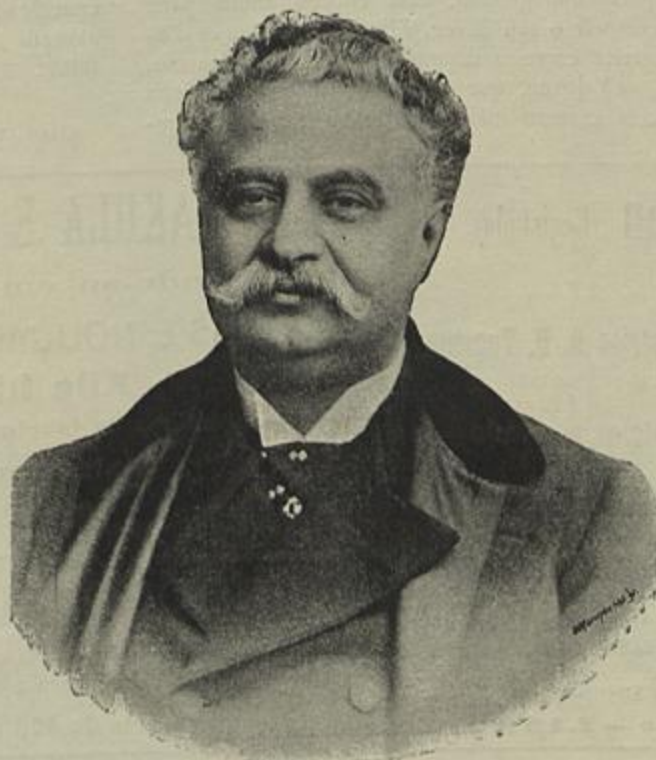
ANTONIO SOUSA BASTOS

Muito conhecedor de aristas e coisas de teatro, publicou, em 1898, A Carteira do Artista , com biografias de autores dramaticos, actores e actrizes, pontos, cenografos, etc., muitas anedotas da vida do teatro, com que fez um livro interessante. Publicou depois, Diccionario do Teatro , tratando não só da tecnologia teatral, mas tambem de autores dramaticos, actores e actrizes, emprezarios, etc.