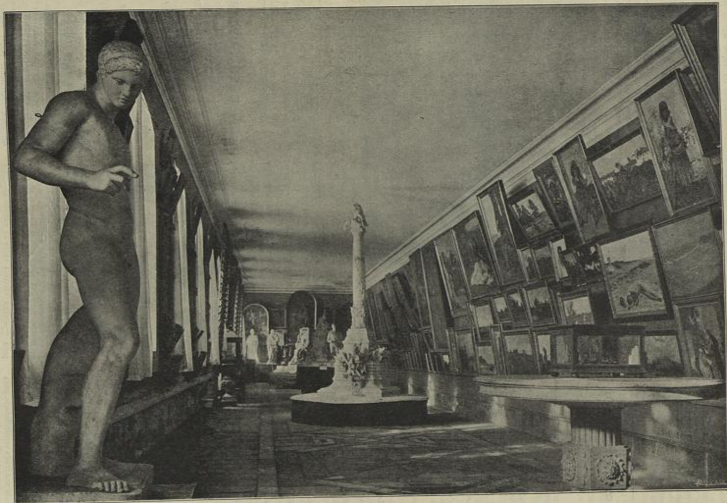
ESCOLA DE BELAS-ARTES DO PORTO — SALA DO MUSEU (Cliché e simile gravura de Marques Abreu)