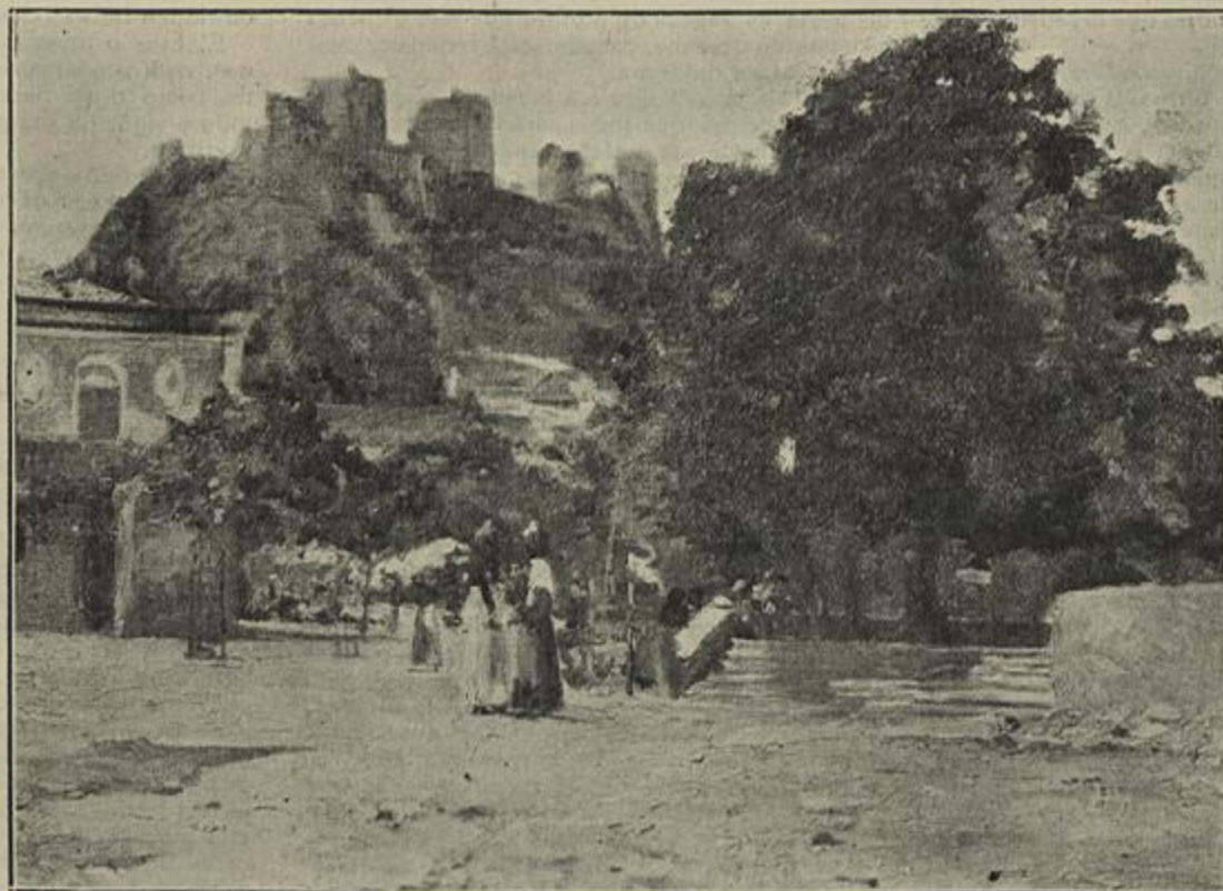
ESTE É BOM, J. Campas — UMA RUA NOS POISOS, Adriano Costa — UMA RUA NOS POISOS, Abel Santos — CASTANHEIRO — PRAÇA DE LEIRIA, Horacio Silva

O sr. Guedes de Oliveira, num artigo publicado na bela revista Arte , exhorta o Estado a olhar pela Academia de Belas-Artes do Porto e, entre os seus acertos, diz, por exemplo: «... essa