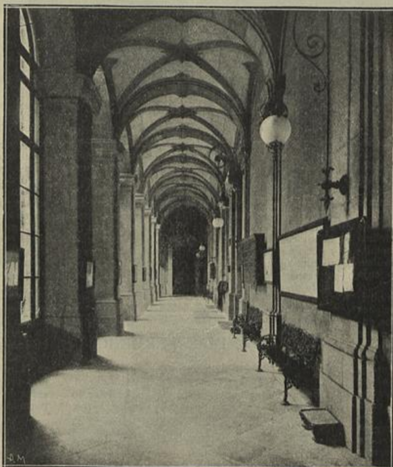
O VESTIBULO — (Clichés Biel)

breveva em opulencia a todas as mais salas do edificio, destacando-se principalmente pelo estilo de sua arquitetura arabe e respectivas decorações.