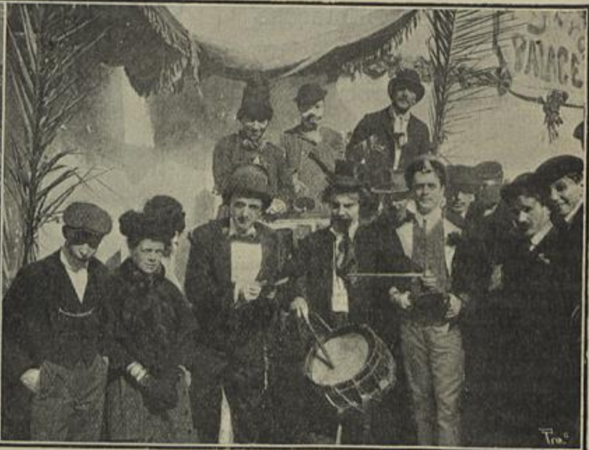
A MASCARADA DOS ESTUDANTES — A RAINHA DO CARNAVAL COM A SUA CÔRTE — O BANDO CARNAVALESCO — N'UMA BARRACA DA FEIRA

ram atraz com a sua Feira Franca, armada no pateo da Escola. Havia ali de tudo que fossem divertimentos, desde as conferencias publicas até á managerie das féras com tigres de bigode e pera, a avestruz anan e mais bicharada, o que tudo o publico podia gosar por insignificantes quantias, destinadas a obras uteis.