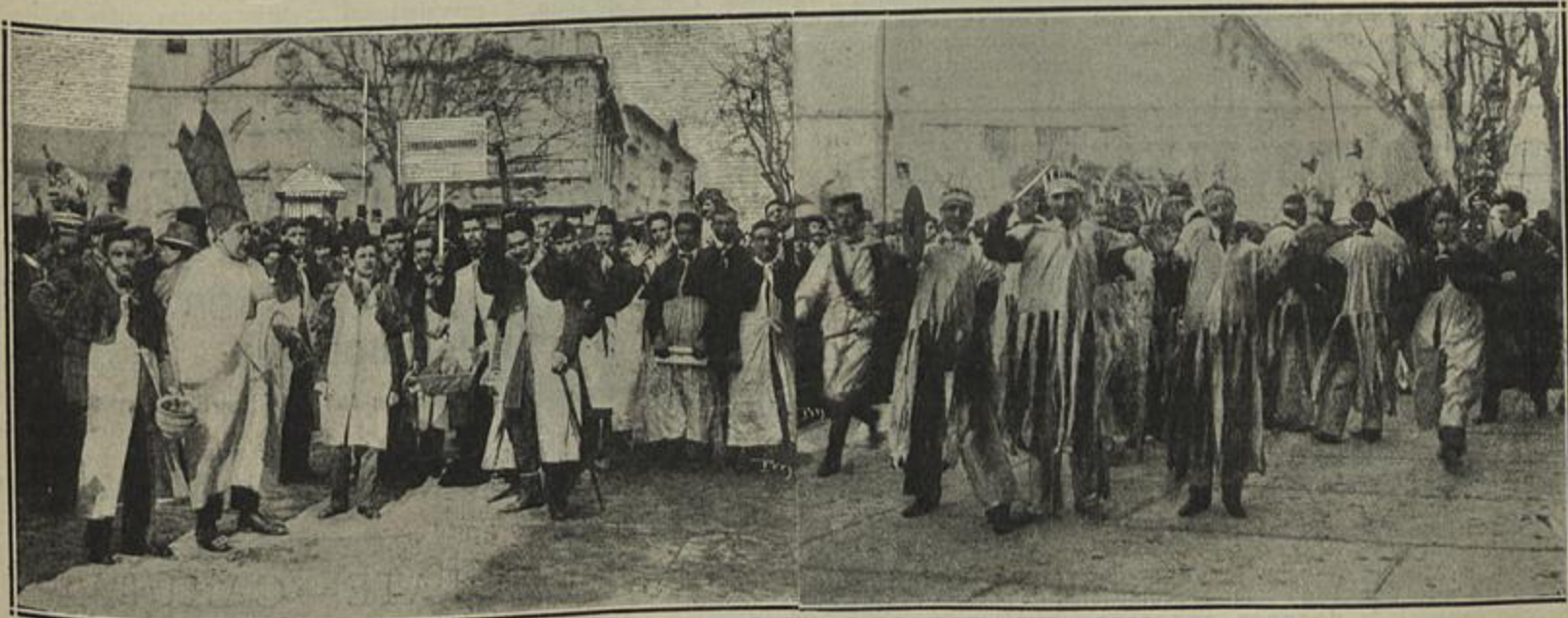
A MASCARADA DOS ESTUDANTES — PROJECTO DE BANDEIRA PARA TODOS OS GOSTOS — O ENTERRO DA «FARPA» — OS PELES VERMELHAS DE INFERNAL MEMORIA — (Clichés Pereira Cardoso)