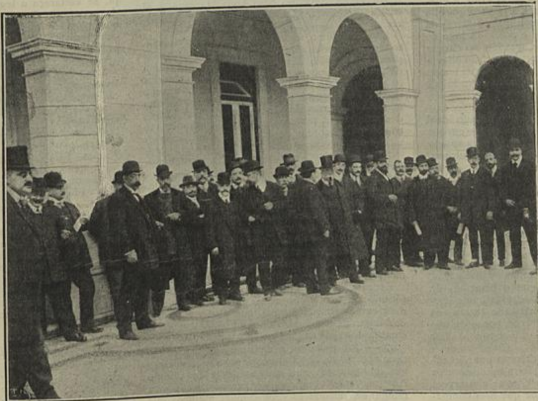
VISITA DOS CONGRESSISTAS AO NOVO EDIFICIO DA ESCOLA MEDICA DE LISBOA

A americana corre para o homem como os rios correm para o mar. Corre com o mesmo impeto, insofreado e natural. E porque a soberania dos costumes lhe não oppõem os diques e açudes, que o nosso velho convencionalismo engenhou e mantém em rigoroso estado de conservação, nem a corrente se desvia, nem as aguas transbordam, como