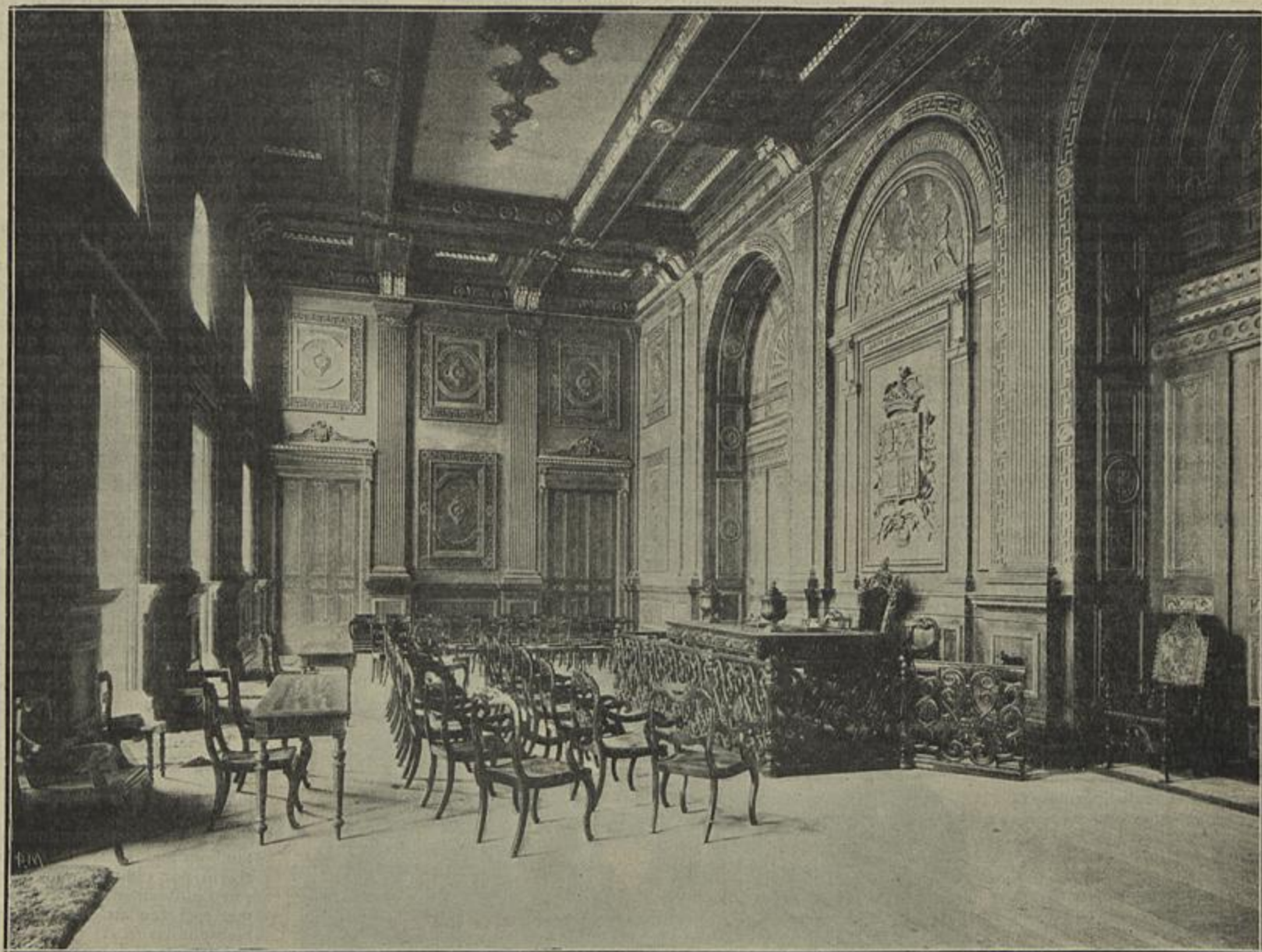
GRANDE SALA DE SESSÕES