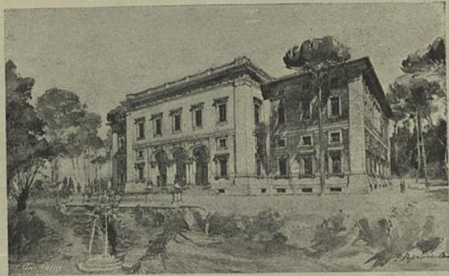
FACHADA DO EDIFICIO DO INSTITUTO INTERNACIONAL DE AGRICULTURA

Antes de vermos quem executa esta obra é necessario reportarmo-nos aos arts. 3.º, 5.º e 6.º da convenção que nos indicam os órgãos activos do Instituto. São a Assembléa geral e o Comité per-