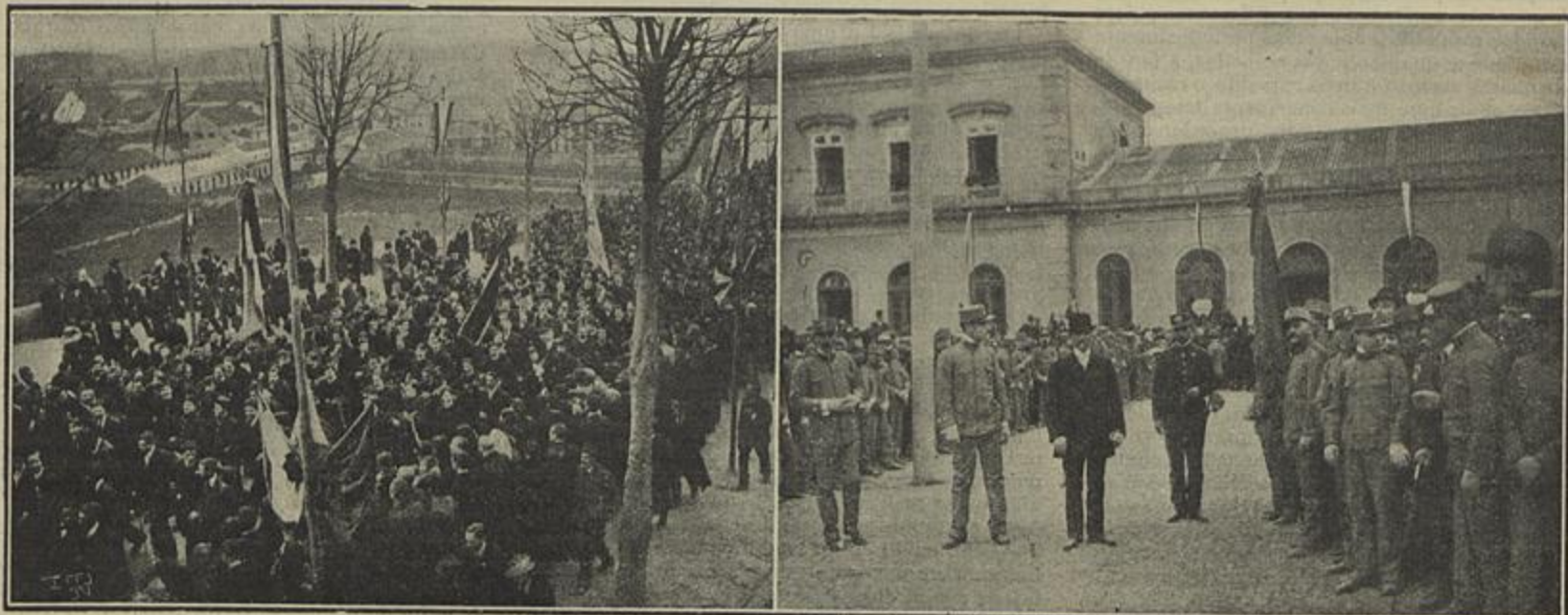
A ACADEMIA NO CORTEJO — A GUARDA DE HONRA EM CAMPANHAN PELO BATALHÃO DE VOLUNTARIOS

o estatuto que o Comité permanente se divida em tres commissões, que teem á sua disposição um pessoal cujo quadro é assim composto: 1 secretario geral com 22:000 fr., 2 chefes de divisão com 20:000 fr., 1 bibliothecario com 10:000 a 14:000 fr., chefes de secção a 10:000 e 15:000 fr.,