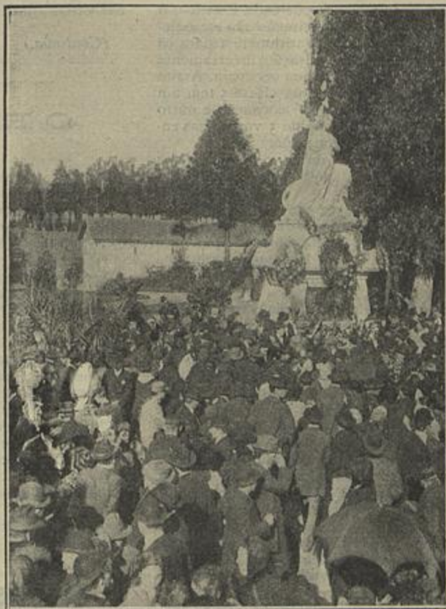
A COLOCAÇÃO DE CORÔAS NO MAUSOLEU DOS VENCIDOS DE 31 DE JANEIRO, NO CEMITERIO DO PRADO DO REPOUSO