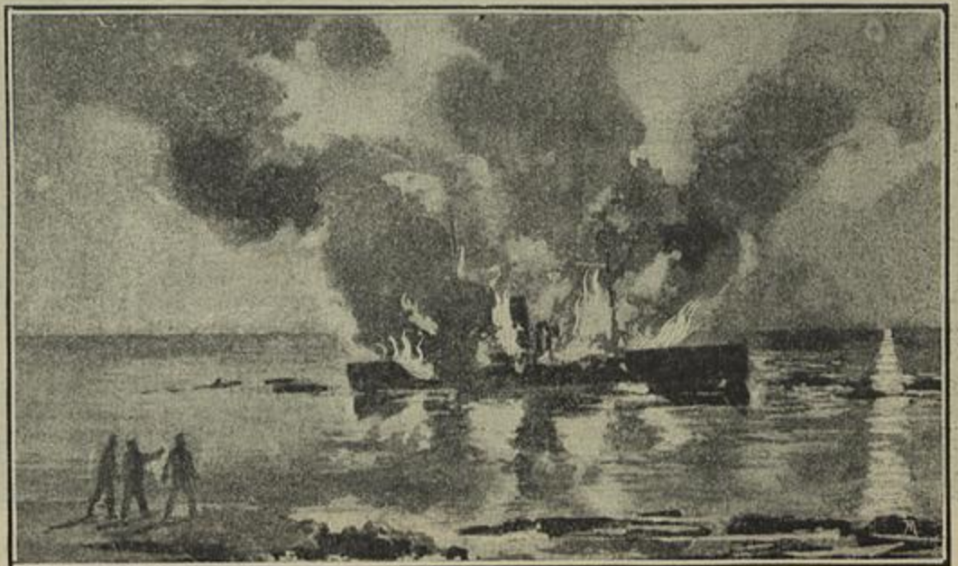
A CASA SUBMARINA, CAP. XX — As labaredas lambiam o costado do navio...

Parecia que todo o céu estava ardendo e em volta do barco em chammas, tudo brilhava; a agua parecia um tanque de ouro fundido, pelo qual se moviam sombras e figuras de seres vivos.