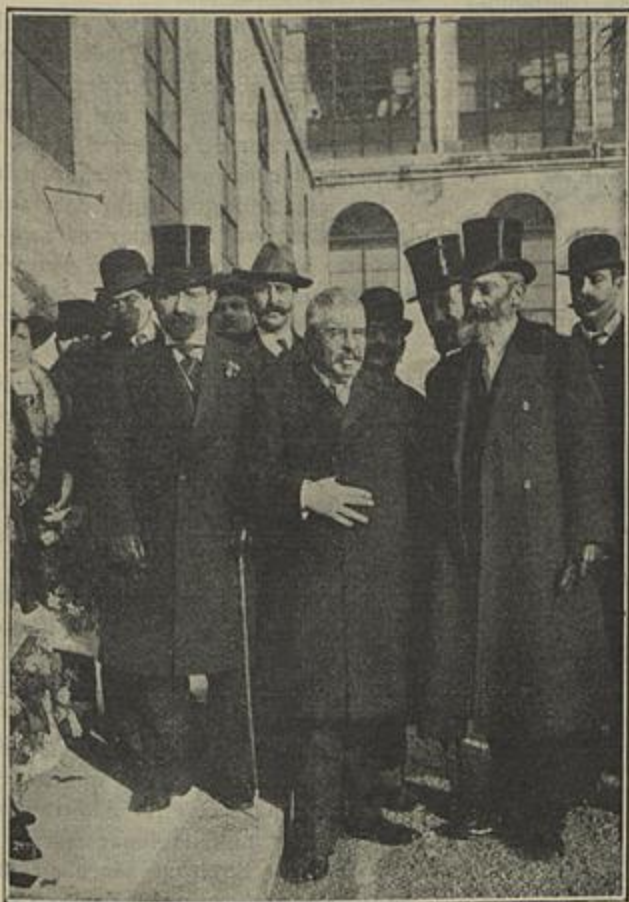
Ministro da justiça, Provedor da Misericórdia, Ministro da Marinha VISITA DOS MINISTROS AO HOSPITAL DE SANTO ANTONIO