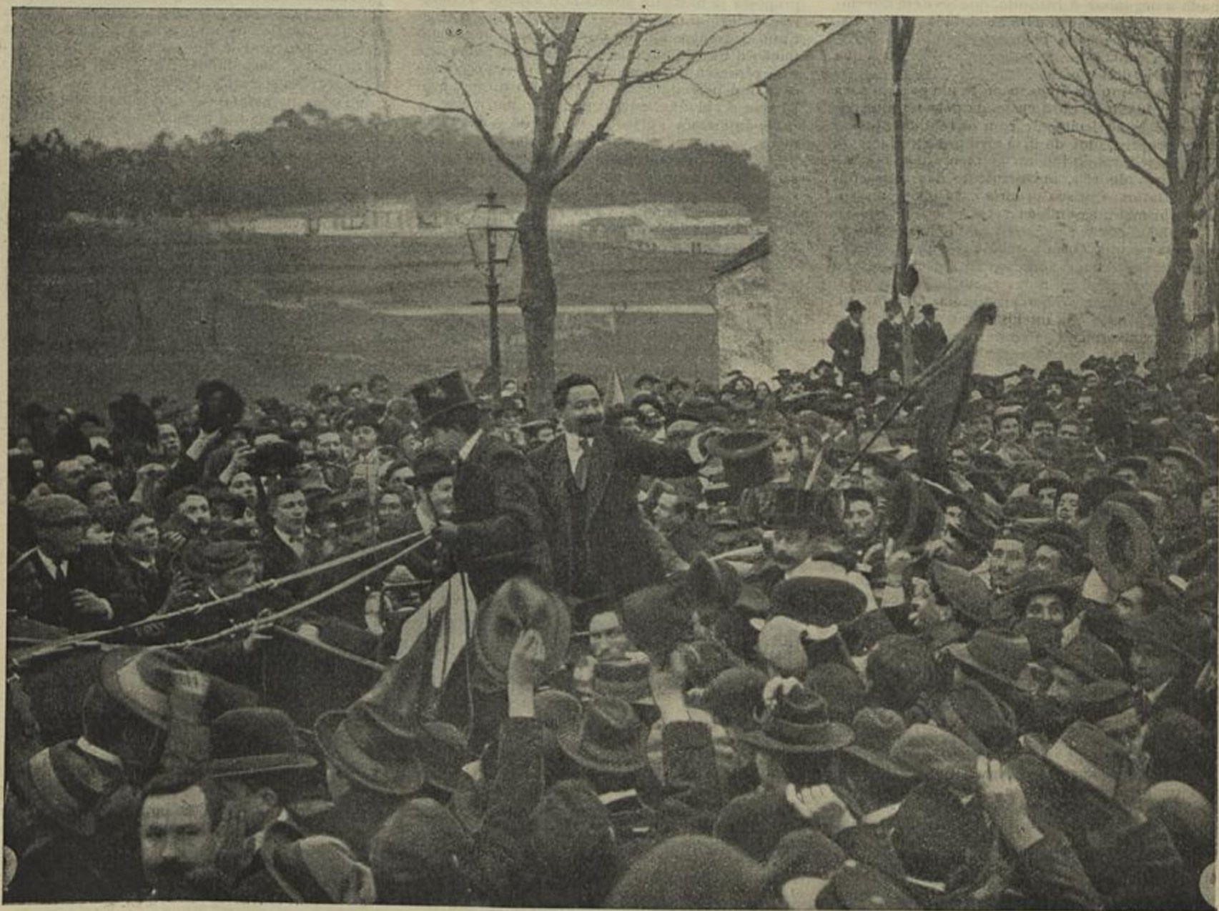
UM TRECHO DO CORTEJO: O MINISTRO DA JUSTIÇA SR. DR. AFFONSO COSTA AGRADECENDO AS MANIFESTAÇÕES

D'onde proveem os rendimentos com que se mantem este, necessariamente caro, organismo social? De 60 contos de réis annuaes do rei d'Ita-