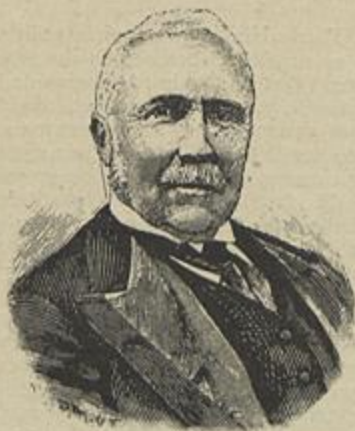
SIR HENRY CAMPBELL BANNERMAN

Foi grande partidario da paz geral e propoz á conferencia de Haya o desarmamento dos exercitos, não sendo atendido.