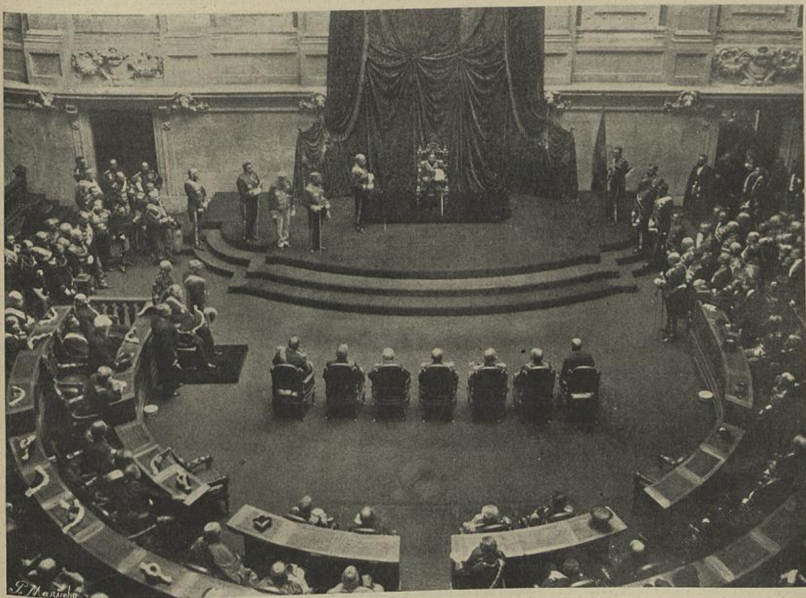
LEITURA DO DISCURSO DA CORÔA POR S. M. EL-REI D. MANUEL II, NA SESSÃO REAL DE 29 DE ABRIL.