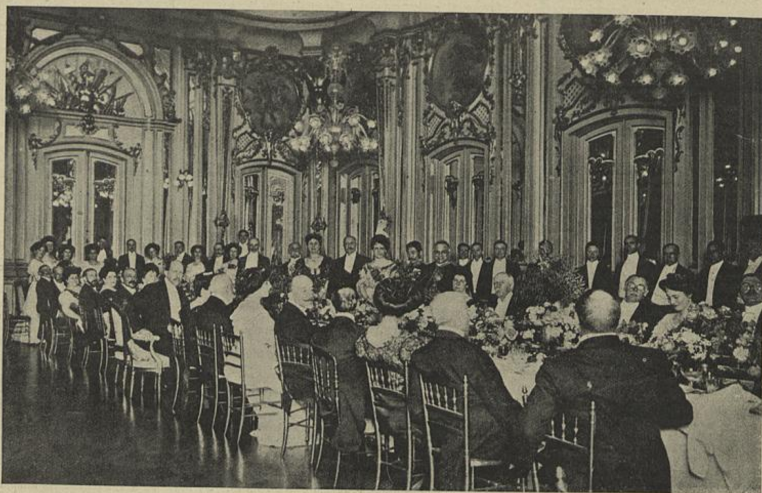
O BANQUETE DIPLOMATICO NA LEGAÇÃO DA AMERICA, EM 30 DE ABRIL.