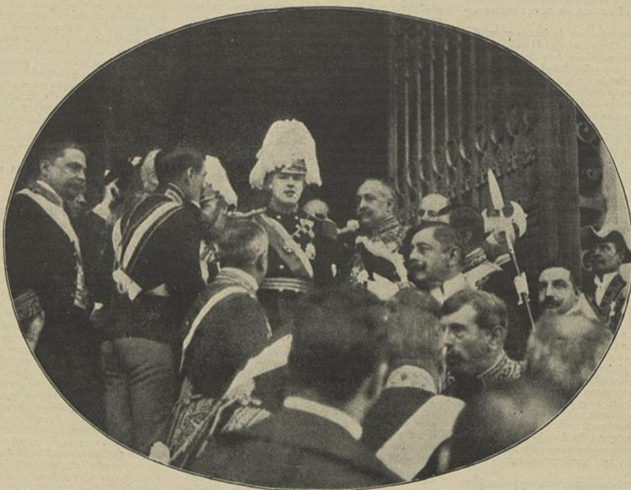
S. M. EL-REI D. MANUEL II SAHINDO DO PALACIO DAS CORTES