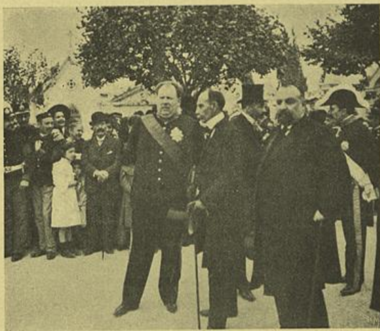
OS ORADORES — ANTES DOS DISCURSOS