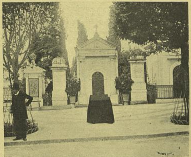
O JAZIGO EM QUE FICOU DEPOSITADO O CORPO DE HINTZE RIBEIRO