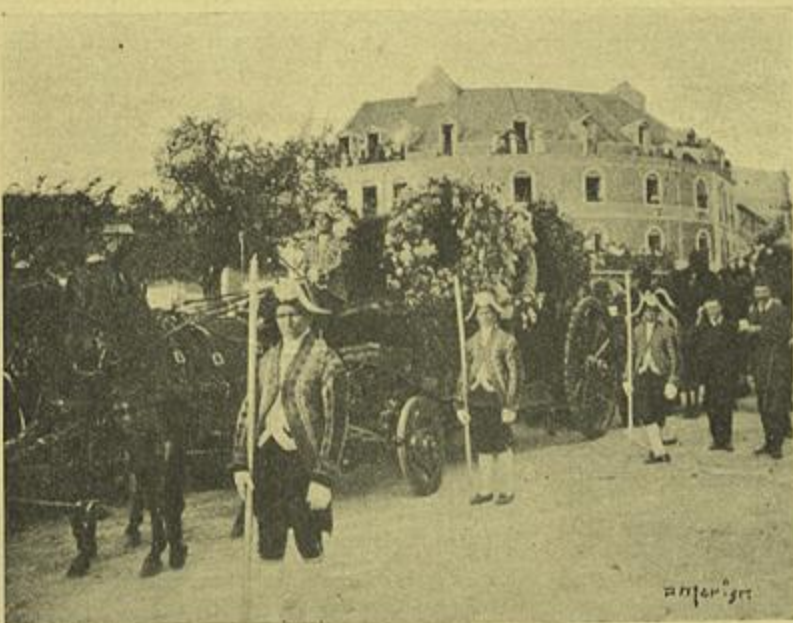
O COCHE, CONDUZINDO A URNA FUNERARIA, CHEGANDO AO CEMITERIO