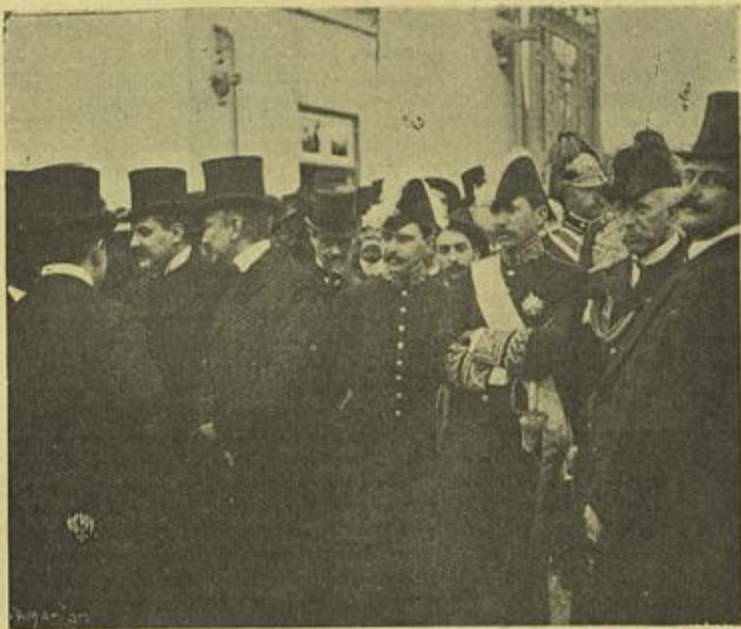
OS MEMBROS DO GOVERNO AGUARDANDO A CHEGADA DO PRESTITO A PORTA DO CEMITERIO