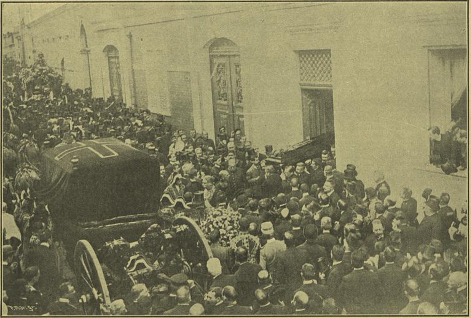
O SAHIMENTO — OS PARENTES E AMIGOS DO CONSELHEIRO HINTZE RIBEIRO CONDUZINDO A URNA FUNENARIA DE CASA PARA O COCHE