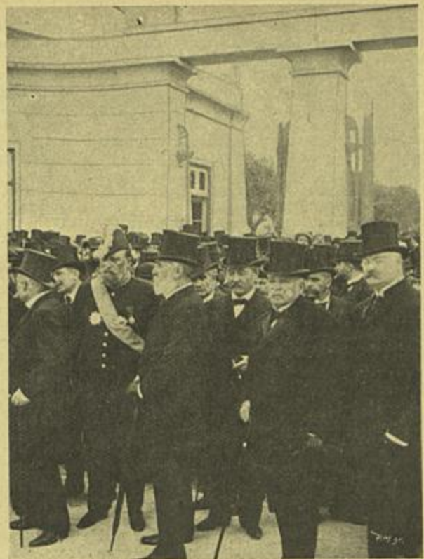
AGUARDANDO A CHEGADA DO PRESTITO A PORTA DO CEMITERIO