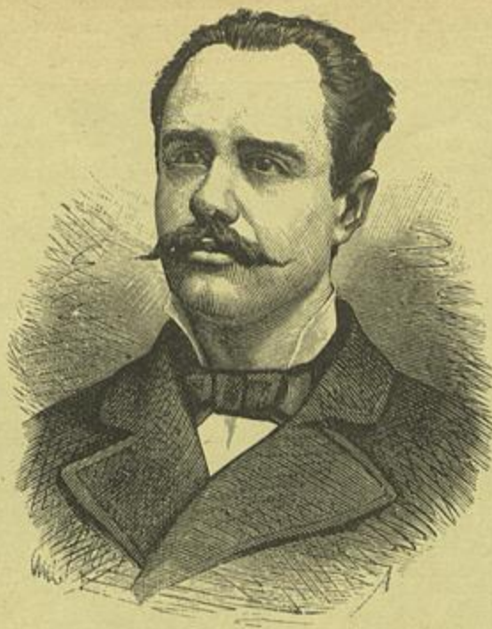
CONSELHEIRO HINTZE RIBEIRO EM 1881 QUANDO PELA PRIMEIRA VEZ MINISTRO DAS OBRAS PUBLICAS

A eloquencia é uma nobre arte; mas, sendo uma cumplicidade com as assembléas, não raro, illusão das illusões de quem escuta, e vae enlevado no timbre sympathico da voz que falla, na figura atrahente do orador, ou na sua paixão indignada, que, certamente, e muita vez desperta a paixão indignada de quem escuta; — a eloquencia porque refere de mil cousas, idéas, sentimentos e circumstancias do tempo, em que discorre o orador,