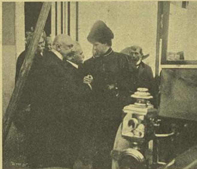
VISITA DE S. M. A RAINHA D. AMELIA Á VIUVA DE HINTZE RIBEIRO — A SAHIDA DE CASA

timentos e fizeram-se representar no enterro. Liberaes, progressistas, republicanos, pegaram ás borlas do caixão. Olhos lavados em lagrimas eram muitos n'aquelle cemiterio aonde o transportaram. Eram sem conta, na casa da rua de S. Bento, as lagrimas da esposa, que nem o beijo da despedida pudera dar em vida ao querido amigo.