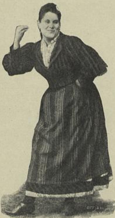
NO «SOLAR DOS BARRIGAS»

Quando se estreou no theatro da Rua dos Con-