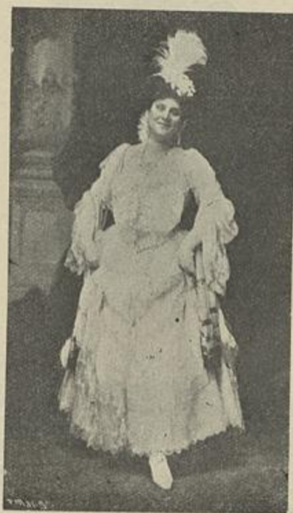
NO «SERÃO DAS LARANJEIRAS»