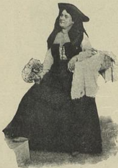
NO «AMOR DE PERDIÇÃO»

des, em 1890, na peça Lobos do mar , tinha uns vinte annos, (nasceu em Lisboa a 15 de novembro de 1869) e em pouco tempo conquistou um primeiro logar entre as actrizes portugêsas.