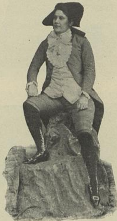
NO «BURRO DO SR. ALCAIDE»