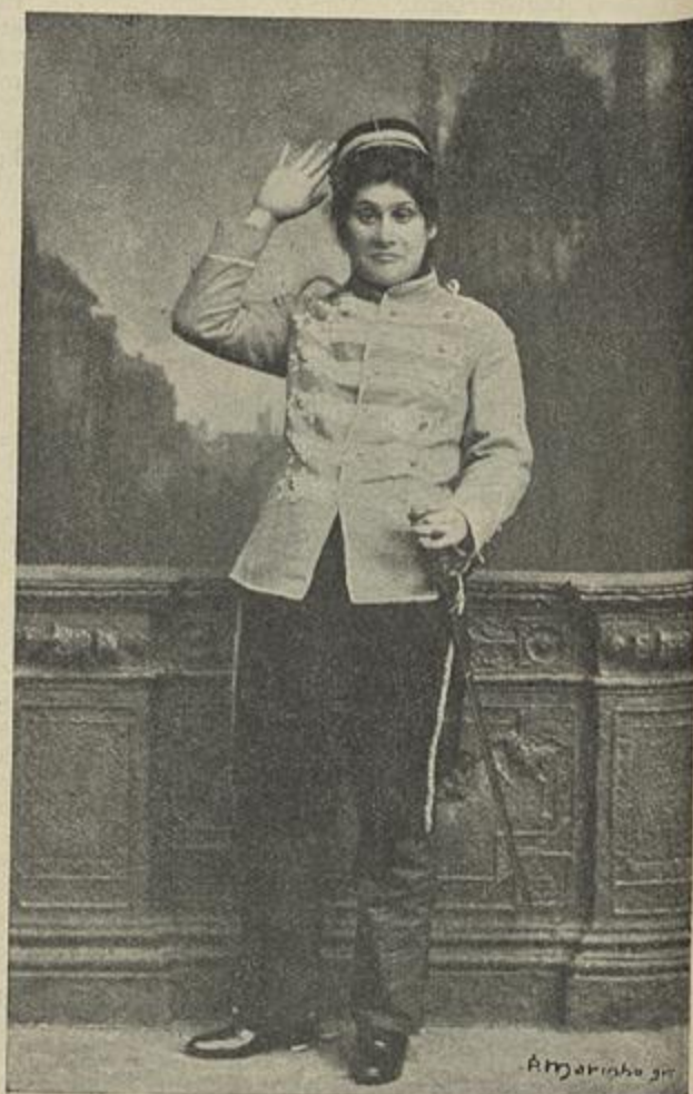
NOS «28 DIAS DE CLARINHA»