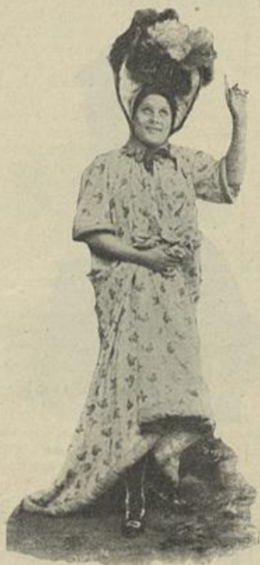
NO «BURRO DO SR. ALCAIDE»