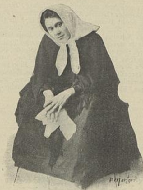
NA «ROSA ENGEITADA»