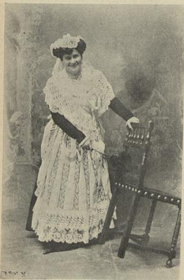
NA «NELLY ROSIER»