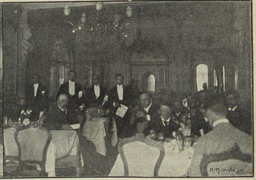
VISTA EXTERIOR — SALA DE ENTRADA, ESTYLO LUIZ XV — SALA DE VISITAS, ESTYLO LUIZ XV — QUARTO DE DORM R, ARTE MODERNA — SALA D E JANTAR, ESTYLO D. JOÃO V O GRANDE HOTEL D'INGLATERRA