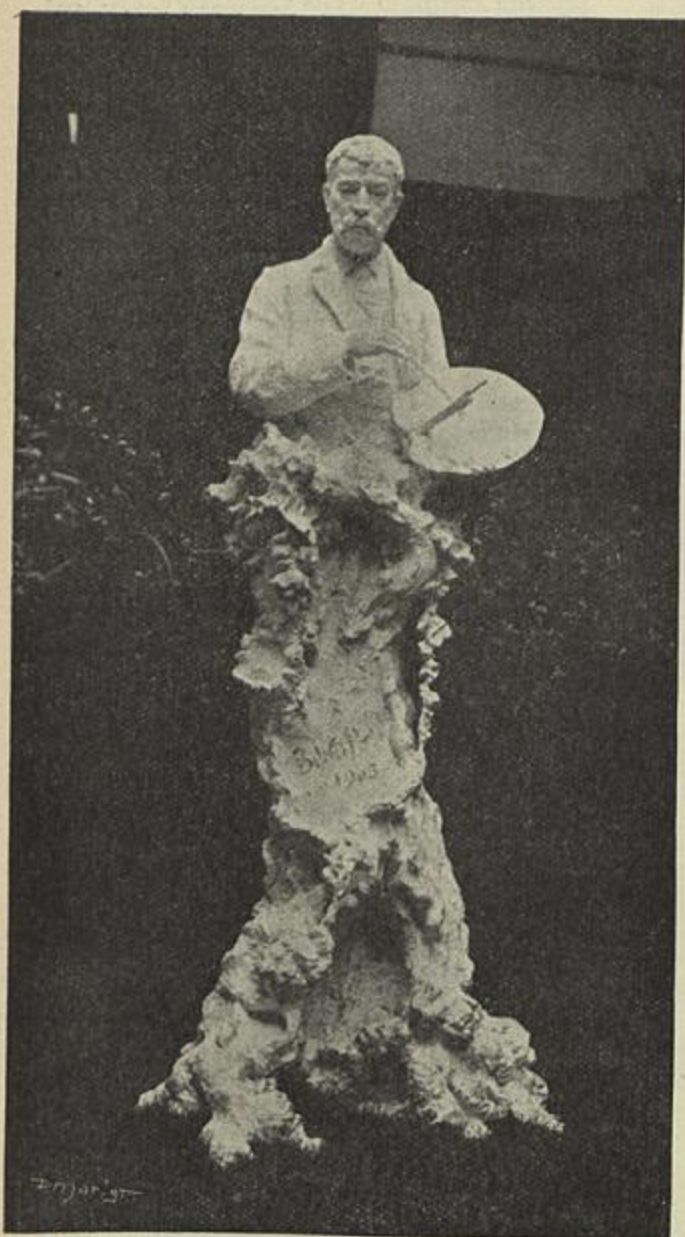
PROJECTO DO MONUMENTO A SILVA PORTO