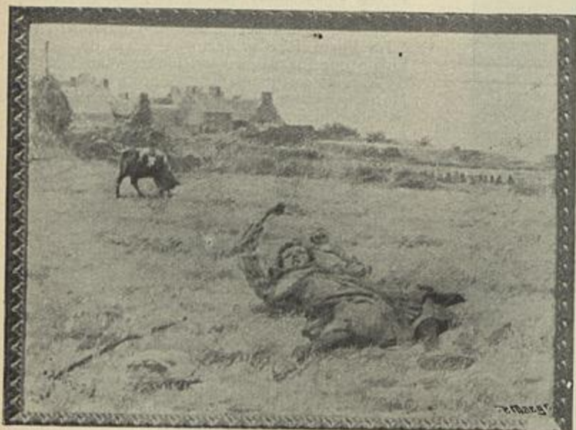
FIM DE UMA TEIMA