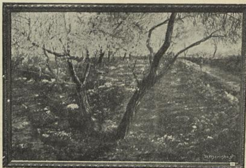
A' BEIRA DO VOUGA (MANHÃ)