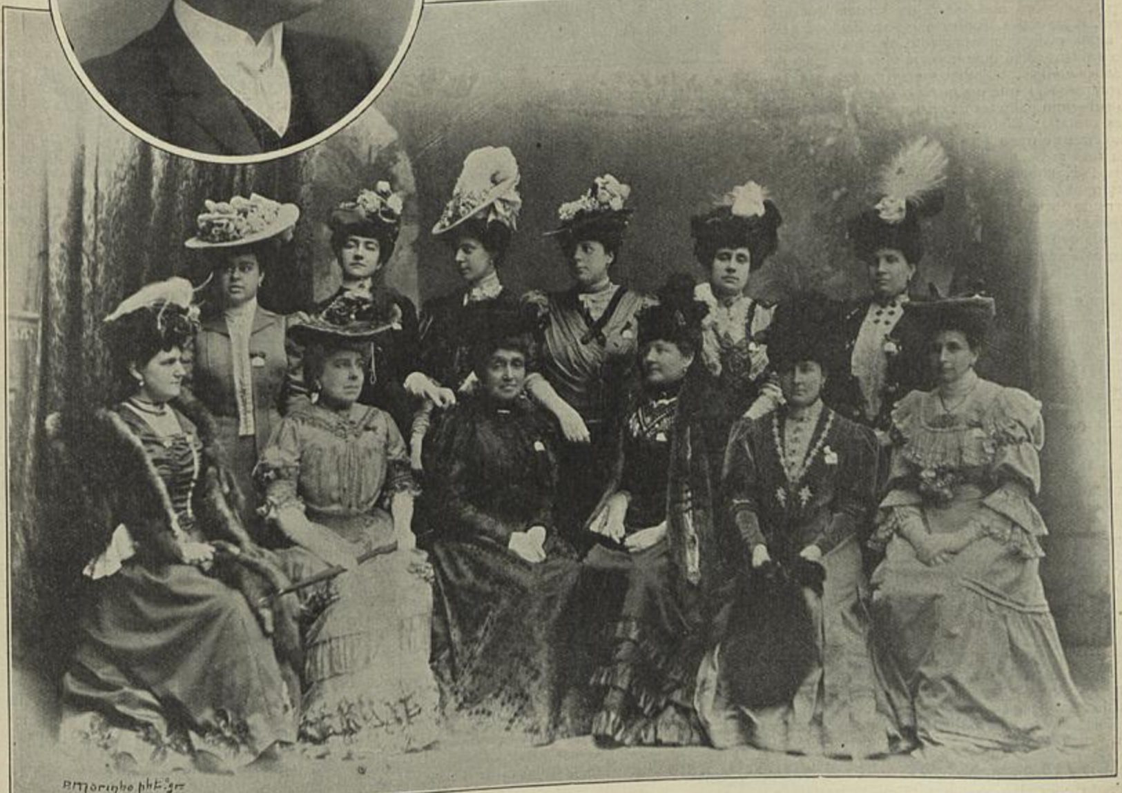
DR. MIGUEL BOMBARDA Secretario Geral do Congresso