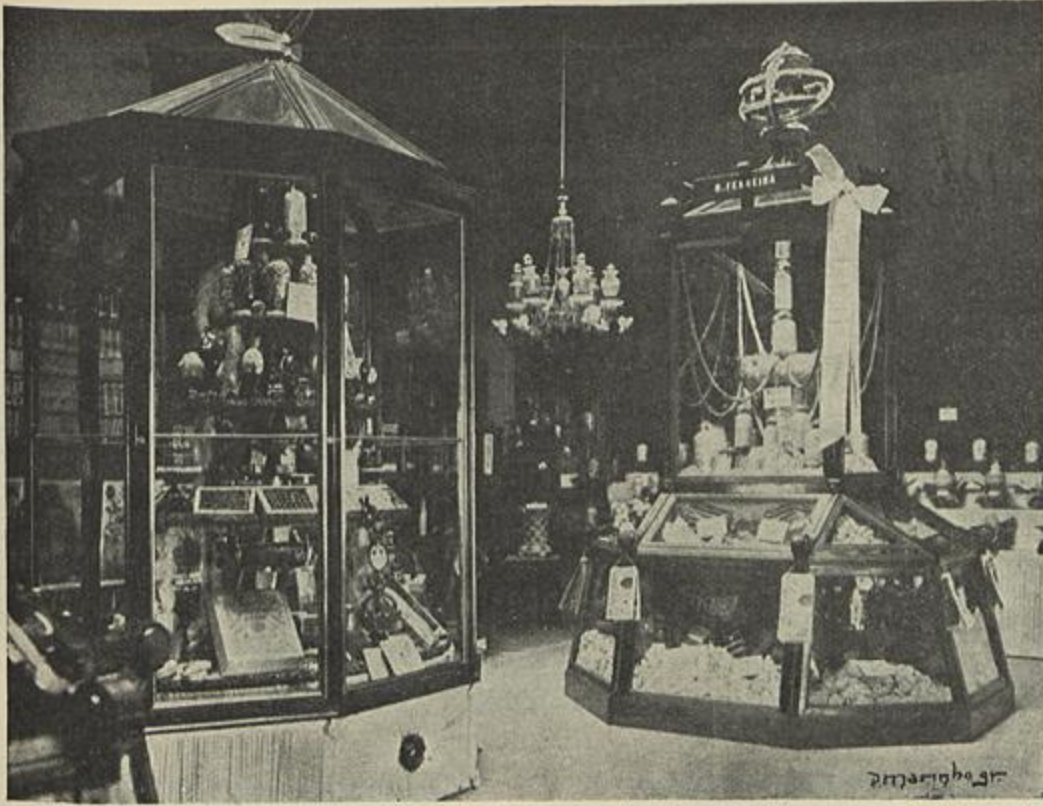
EXPOSIÇÃO DE CACAU E DE ALGODÃO

phones, correio, restaurante, venda de tabacos, de jornaes, tudo emfim de que possam carecer os congressistas, além de pessoal habilitado falando diferentes linguas, para lhes servir de guias, etc.