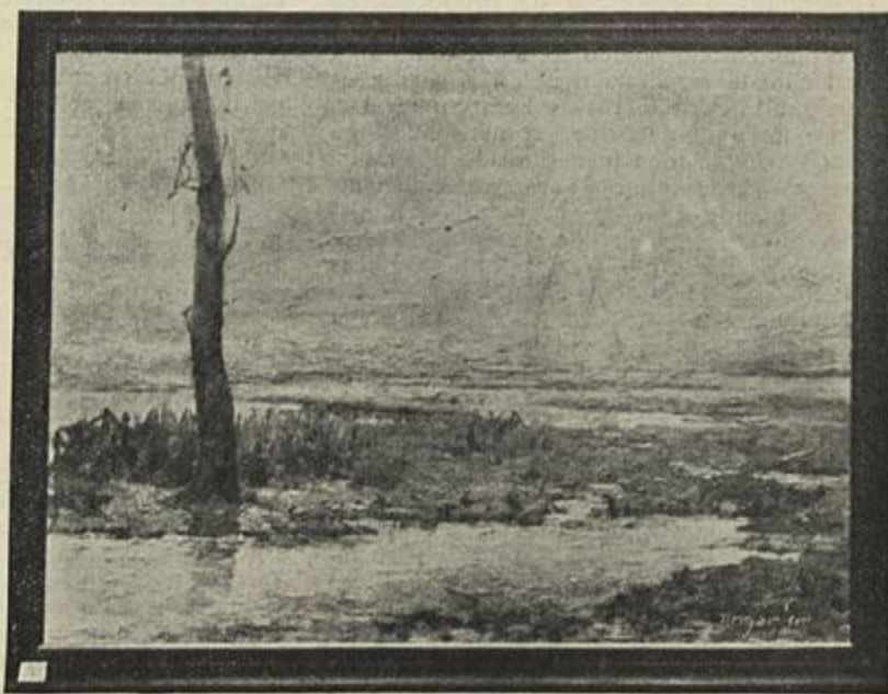
MANHÃ (VALLE DE SANTAREM)