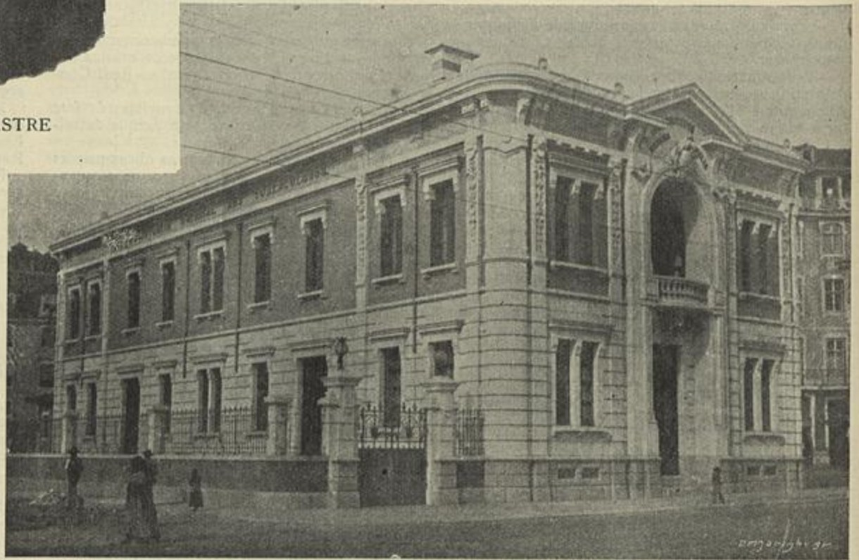
O DISPENSARIO «D. AMELIA» EM LISBOA

O projecto d'este edificio deve-se ao architecto sr. Rosendo Carvalheira, que n'este importante trabalho provou mais uma vez a sua grande competencia scientifica e gosto de artista. Collaboraram tambem n'esta obra os srs. engenheiros Severiano Monteiro e Falcão Rodrigues, tendo dirigido os trabalhos de construcção o sr. Rafael de Castro que a conseguiu concluir no curto espaço de dez mezes.