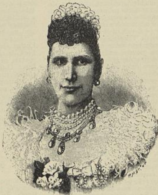
S. M. A RAINHA LUIZA