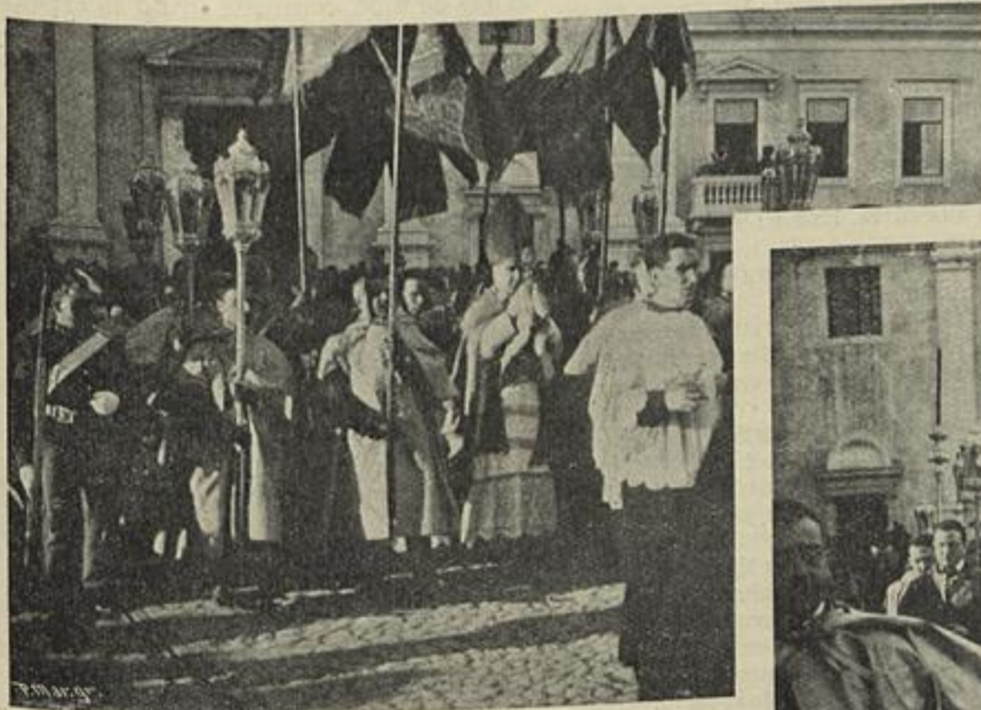
SAHIDA DA PROCISSÃO DA EGREJA DE S. ROQUE, S. Ex.ª O ARCEBISPO DE MITYLENE CONDUZINDO O SANTO LENHO

Não é meu o titulo que encima este estudo, e nem são minhas as seguintes quatro proposições que abranjem outros tantos periodos :