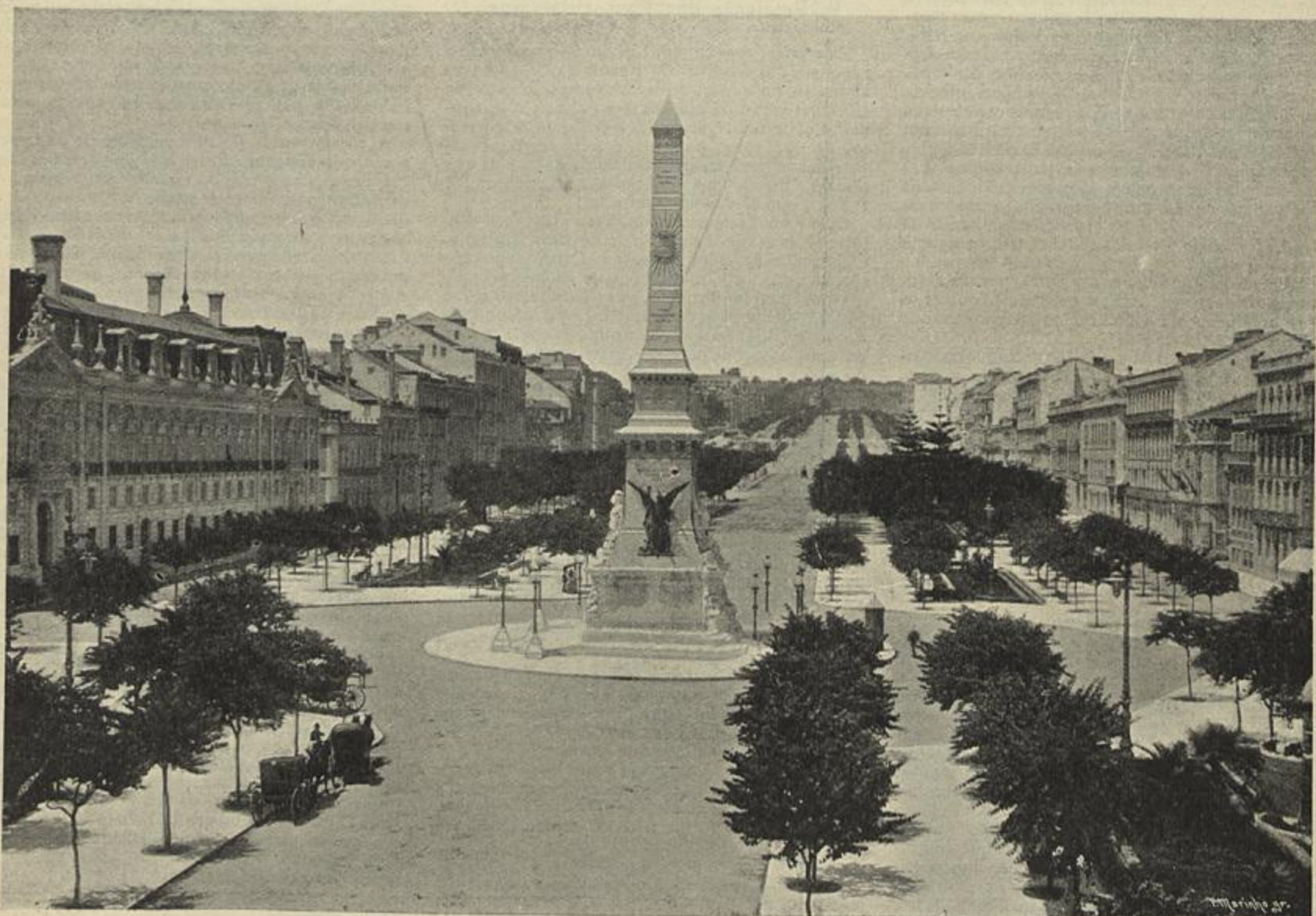
A AVENIDA DA LIBERDADE