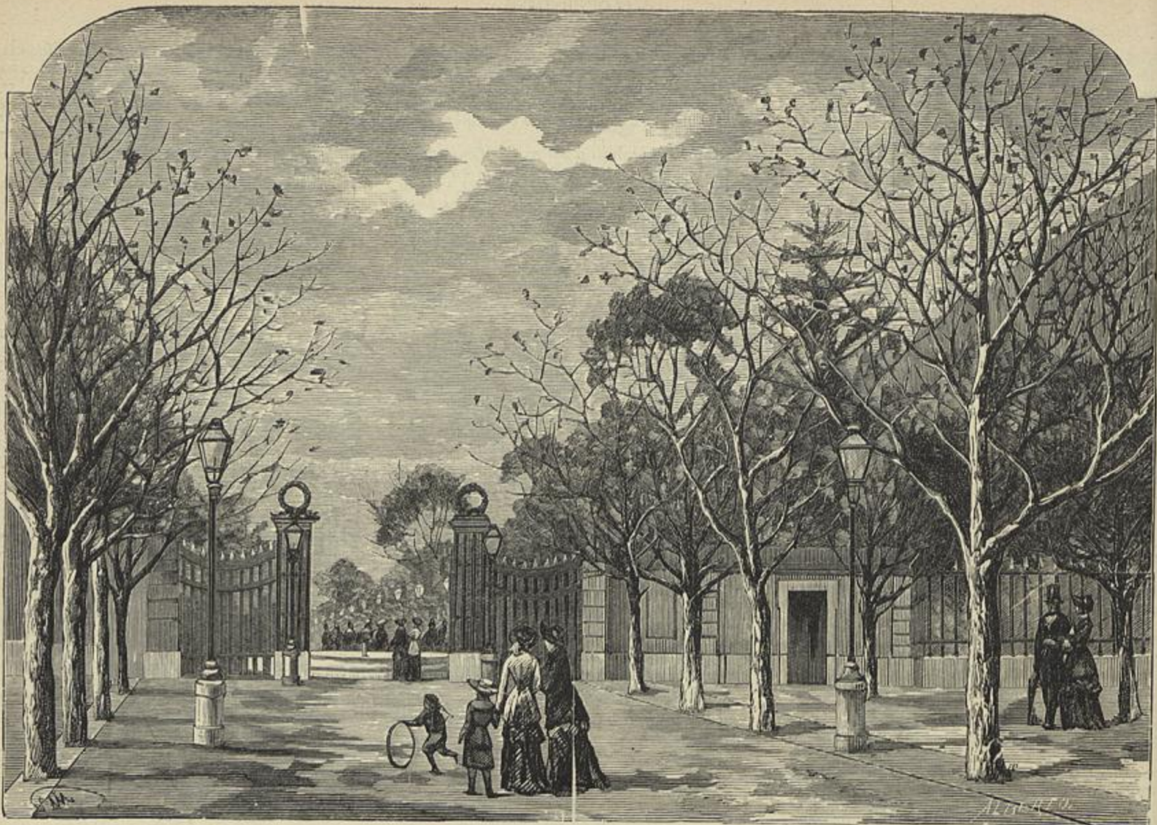
O ANTIGO PASSEIO PUBLICO DO ROCIO, DEMOLIDO EM 1883