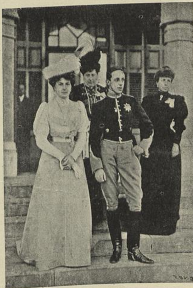
O Rei Affonso XIII e Sua Noiva, a Princesa Victoria de Battenberg, sahindo da Capella Real de Miramar, onde se realisou a conversão da Princesa ao Catholicismo

Foi o sr. Hintze Ribeiro chamado ao paço e, domingo á noite, já os nomes dos novos ministros eram quasi todos conhecidos: teremos o sr. Antonio de Azevedo na marinha o sr. Wenceslau de Lima nos estrangeiros, o sr. Teixeira de Sousa na fazenda,