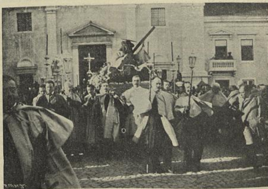
O SENHOR DOS PASSOS DA GRAÇA