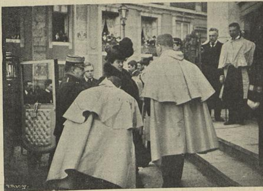
CHEGADA DE S.S. MM. EL-REI D. CARLOS, R. D. AMELIA E S. A. O PRINCIPE D. LUIZ, Á EGREJA DE S. ROQUE