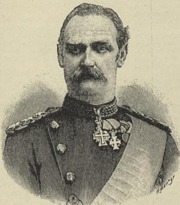
S. M. O REI FREDERICO VIII