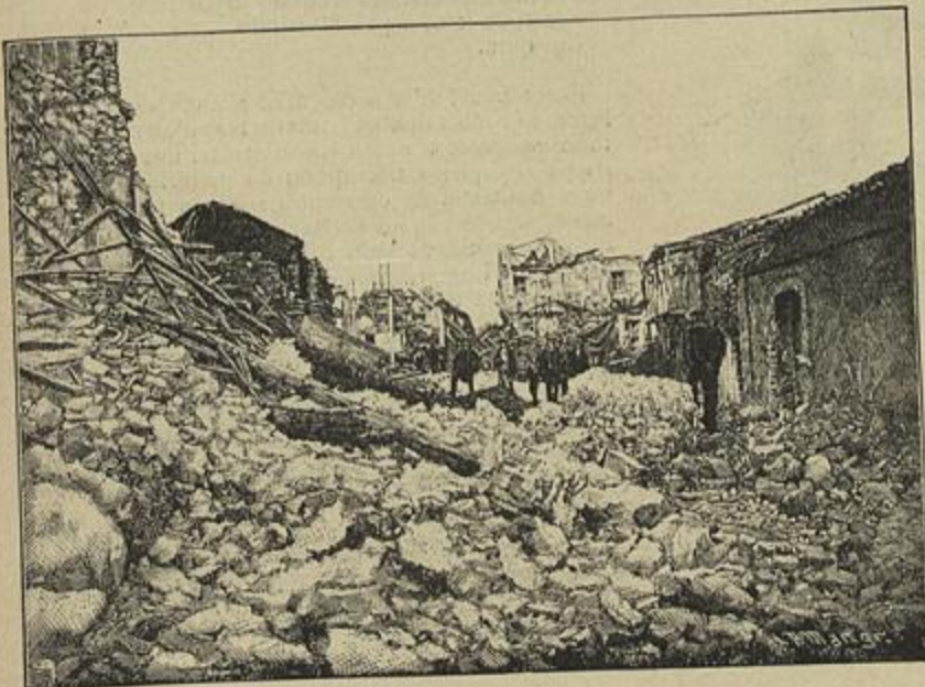
AS RUINAS EM ZAMMARO