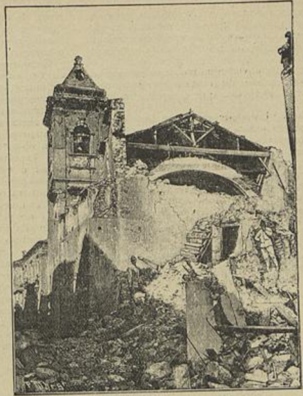
RUINAS DA EGREJA DE PARGHELIA