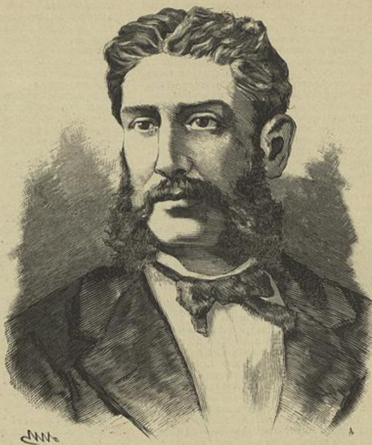
O EXPLORADOR CONDE DE BRAZZA