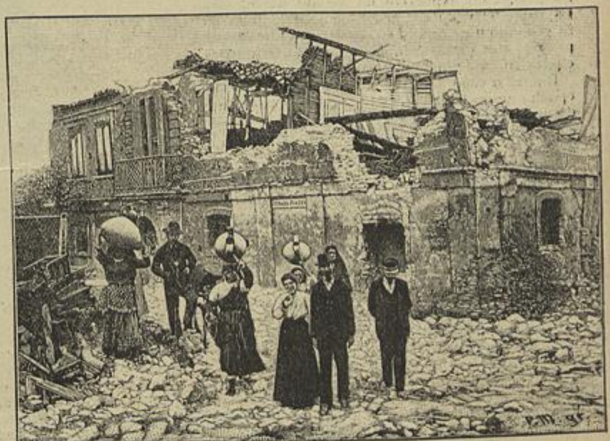
AS RUINAS EM STEFANAONI