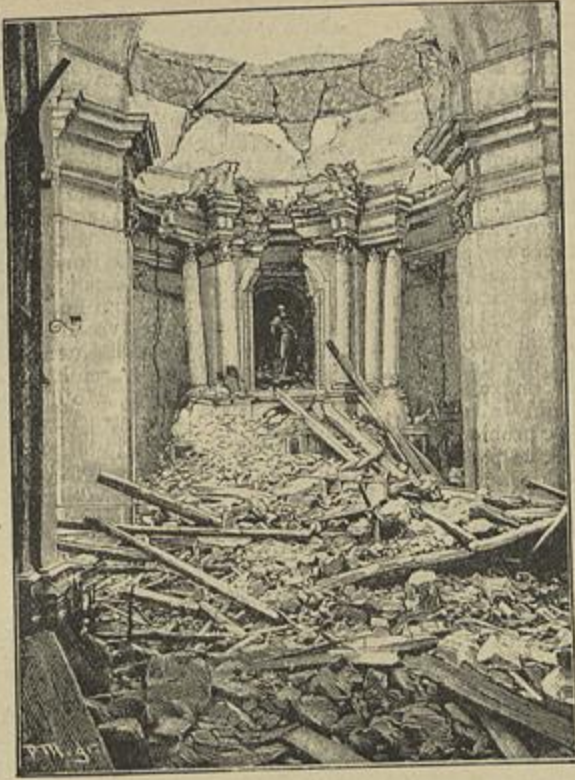
RUINAS DA EGREJA DE STEFANAONI