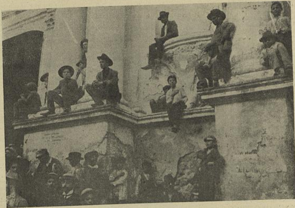
POPULARES E ALGUNS CORRESPONDENTES DE JORNAES SOBRE OS PILARES DA EGREJA PAROCHIAL DE MONTELEONE CALABRO