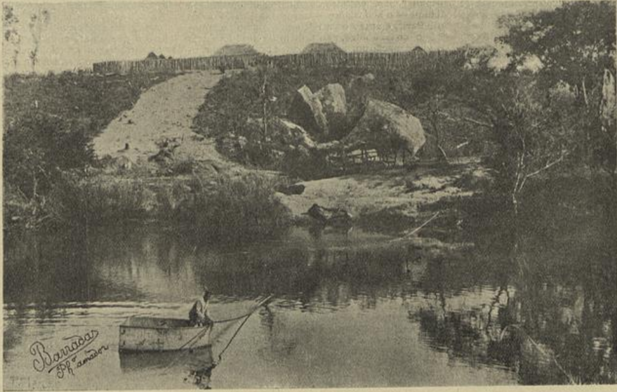
O FORTIM «D. LUIZ FILIPPE» NAS MARGENS DO CUNENE