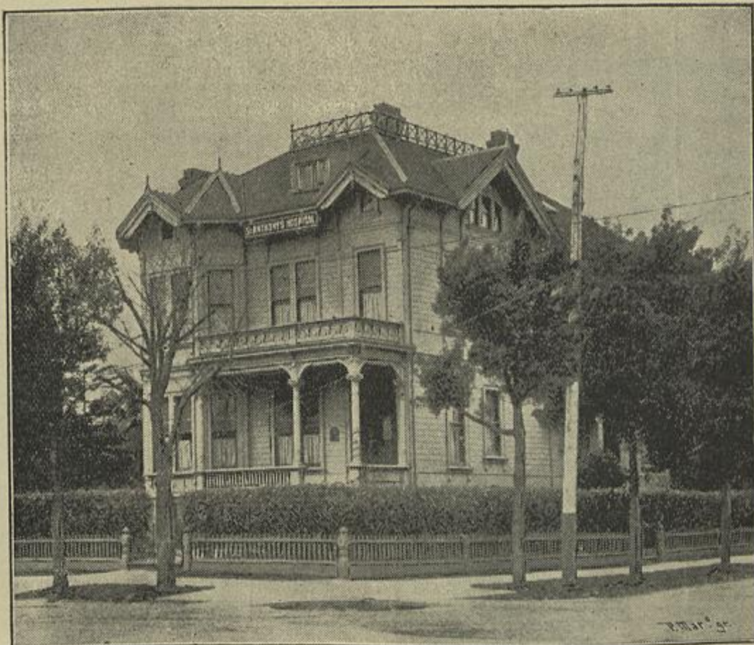
O HOSPITAL DE SANTO ANTONIO EM OAKLAND

O que apresentasse maior fausto ou riqueza, era uma outra California , de modo que esta palavra que até ali só figurava na geographia como