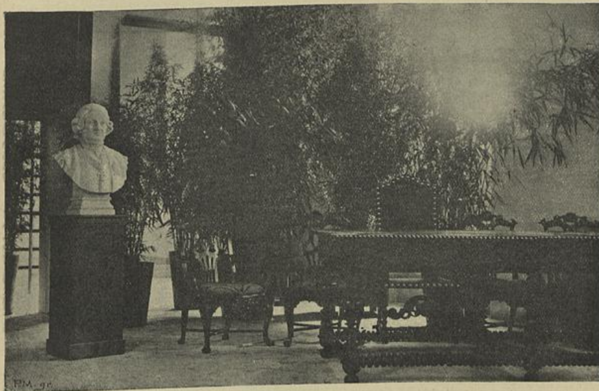
O BUSTO DE PINA MANIQUE INAUGURADO NA REAL CASA PIA DE LISBOA

O presidente do conselho hespanhol e o novo ministro partiram para San Sebastian, depois dos funeraes de Villaverde.