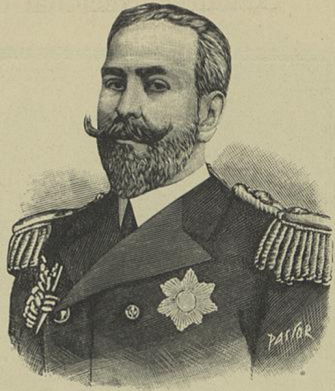
S. A. O PRÍNCIPE LUIZ DE BATTENBERG, ALMIRANTE DA ESQUADRA

Uma educação solida e sabia, propria a afeiçoar bons cidadãos, era o que se precisava para combater de frente o mal d'aquella época, mal que ameaçava assoberbar tudo.