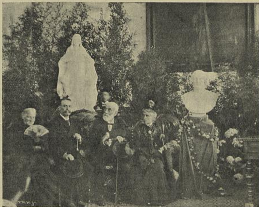
OS REPRESENTANTES DA FAMILIA DE PINA MANIQUE NA INAUGURAÇÃO DO BUSTO DO FUNDADOR DA REAL CASA PIA DE LISBOA

A ninguem, de hoje em diante, deixarão de ser licitas ambições d'essa ordem, depois da nomeação para esta pasta de D José Echegaray, o maior dramaturgo de Hespanha. Foi no domingo que o lemos com a maior surpresa, embora não ignorassemos a fama de Echegaray como não vulgar mathematico, auctor como foi de excellentes memorias scientificas, mathematicas e physicas. Mas cuidavamos que ao auctor do Grande Galeoto já pouco lhe importava problemas financeiros.