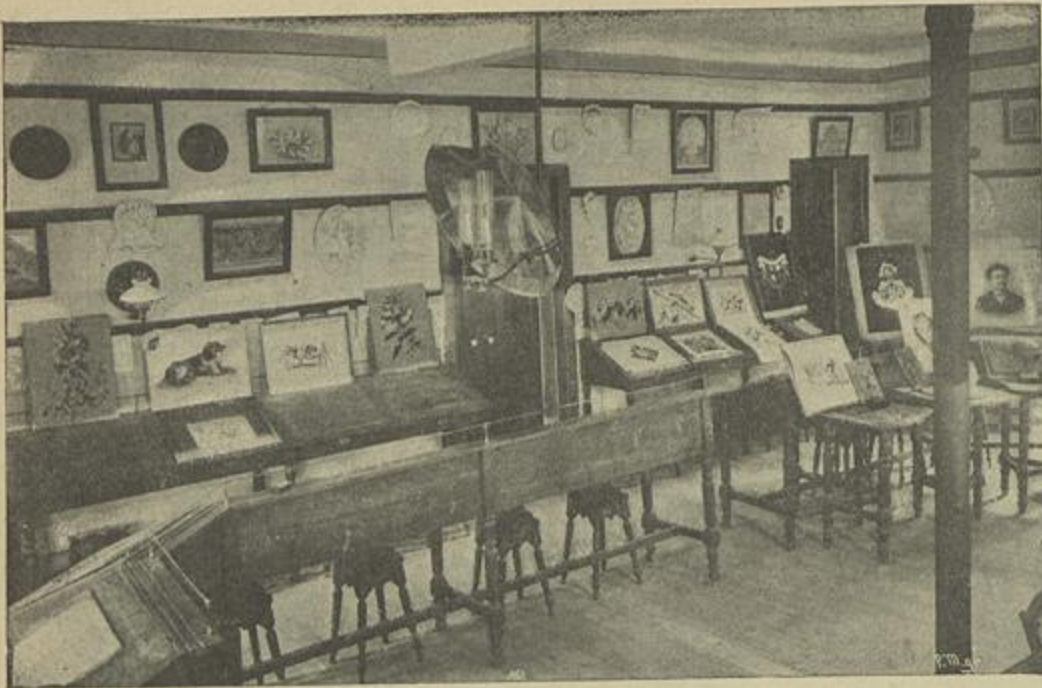
AULA DE DESENHO E MODELAÇÃO

com 13 associados, realisando-se a primeira reunião em 13 de junho na casa do cartorio da igreja de Santo Antonio da Sé.