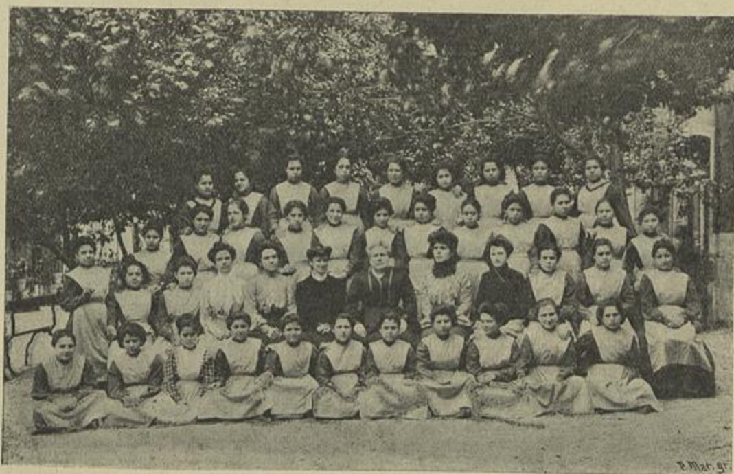
GRUPO DE ASYLADAS COM A REGENTE E AJUDANTES