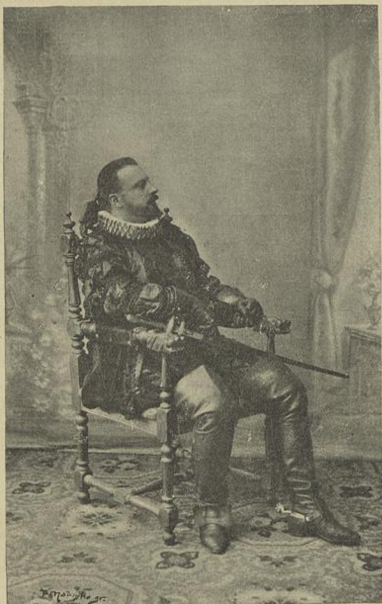
GIOVACCHINI NO «ERNANI»