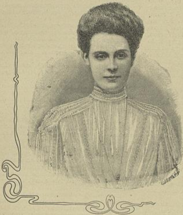
GRÃ-DUQUEZA CECILIA DE MECKLEMBOURG-SCHWÉRIN