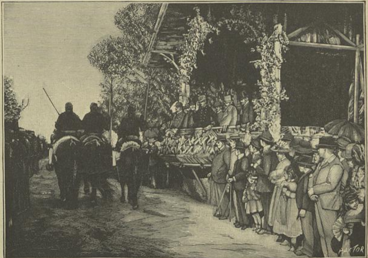
EXPOSIÇÃO NA TAPADA DA AJUDA — S. A. O PRINCIPE D. LUIZ FILIPPE ASSISTINDO AO DESFILLAR DO GADO

A associação foi fundada a 22 de março de 1891,