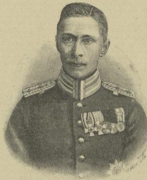
PRINCIPE FREDERICO GUILHERME, HERDEIRO DO THRONO DA ALLEMANHA

No dia 6 do corrente celebrou-se na grande cathedral protestante de Berlin o casamento do principe Frederico Guilherme, herdeiro presumpitivo do throno da Allemanha, com a Grã-Duqueza Cecilia de Mecklembourg Schwérin.