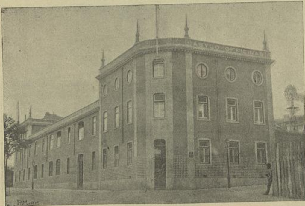
EDIFICIO DO ASYLO

N'essa mesma tarde entrava Luiz XVIII nas Tulherias e a imprensa que na vespera adulava Napoleão apressava-se em cortejar o novo idolo e tomava expressões de desprezo para o que acabava de cahir.