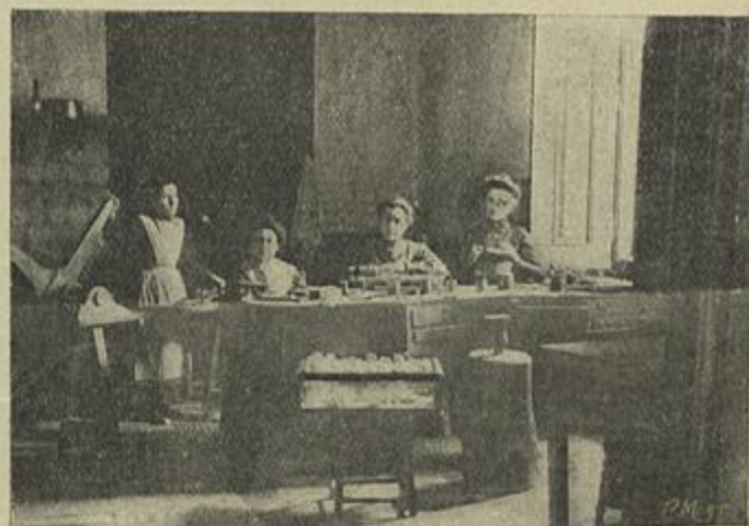
OFFICINA DE OURIVES