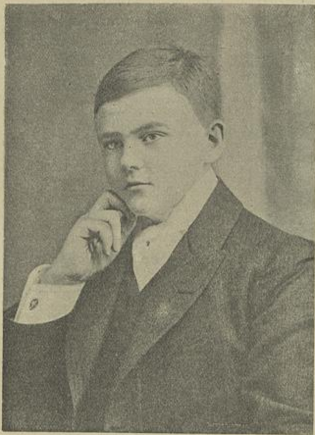
S. A. O PRINCIPE D. LUIZ FILIPPE PRESIDENTE HONORARIO DA ASSOCIAÇÃO DA INFANCIA SANTO ANTONIO DE LISBOA