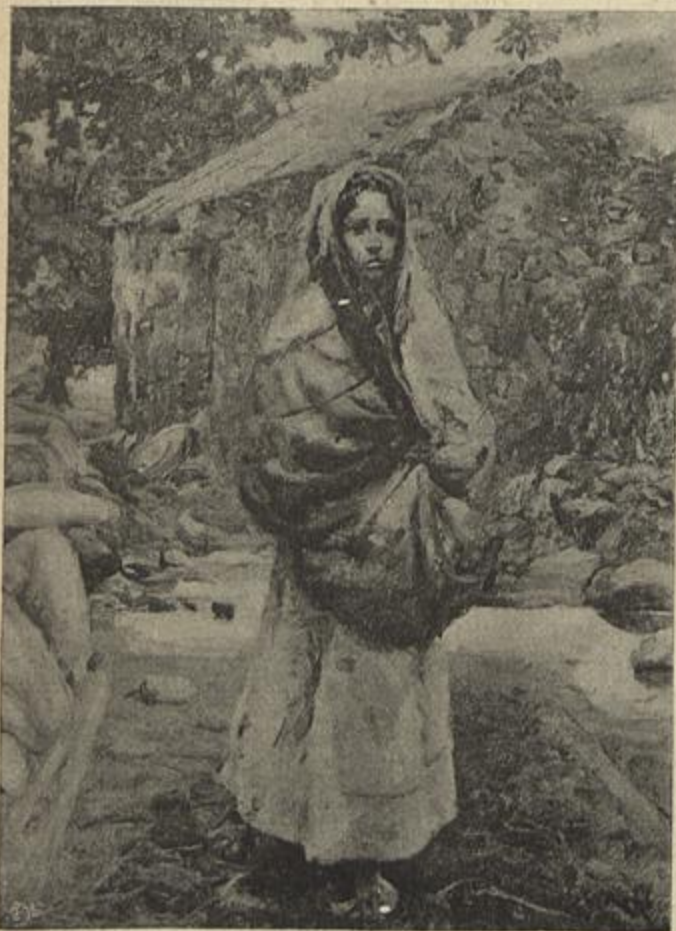
MENDIGA — (Carlos Reis)