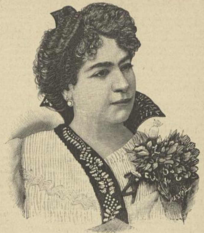
ACTRIZ GEORGINA PINTO FALLECIDA NO RIO DE JANEIRO EM 12 DO CORRENTE

A mallograda artista já por diversas vezes havia ido ao Brazil, onde foi sempre recebida com agrado.