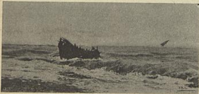
PRAIA DA NAZARETH — (Thomaz de Mello Junior)