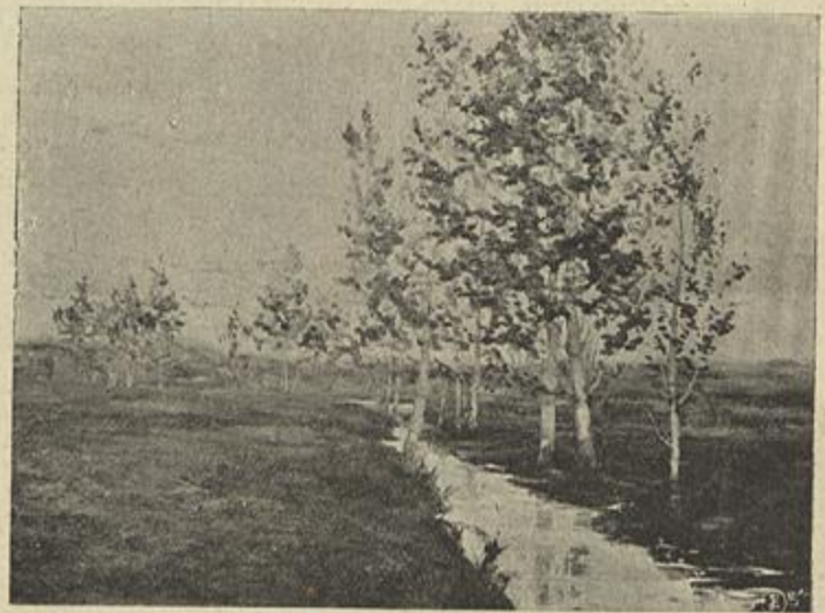
POENTE DE ABRIL — (Carlos Reis)