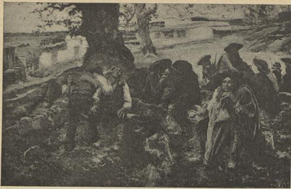
O BARBEIRO DE ALDEIA — (José Malhóa)