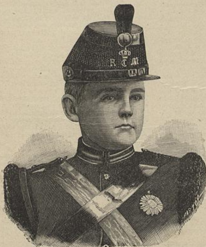
S. A. O PRINCIPE LUIZ FILIPPE