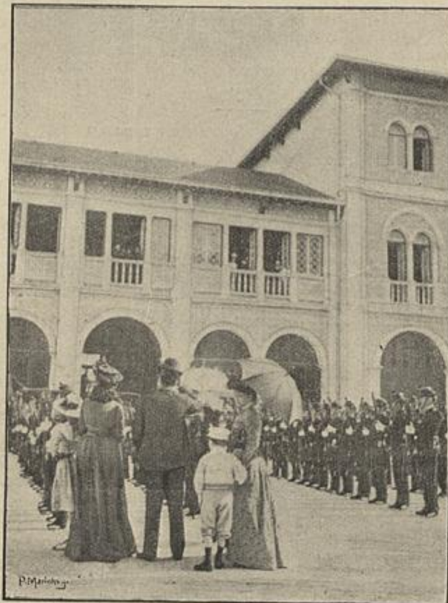
PARADA DO COLLEGIO MILITAR