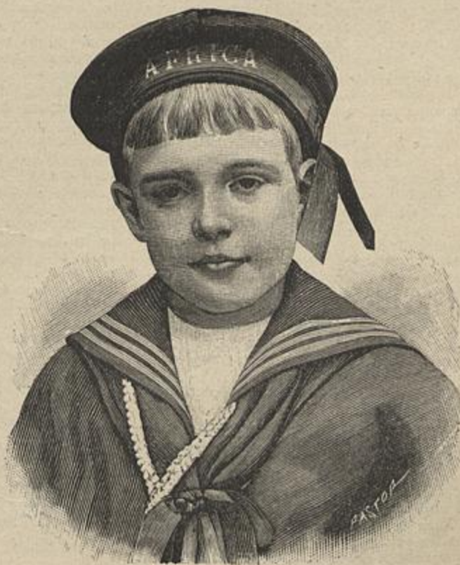
S. A. O INFANTE D. MANOEL