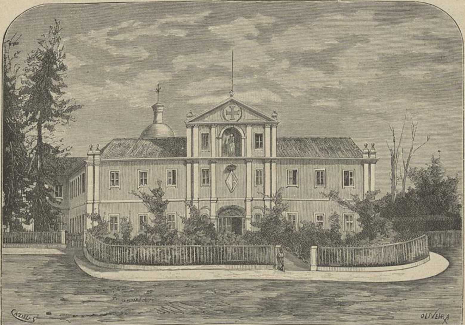
COLLEGIO MILITAR, VISTA EXTERIOR