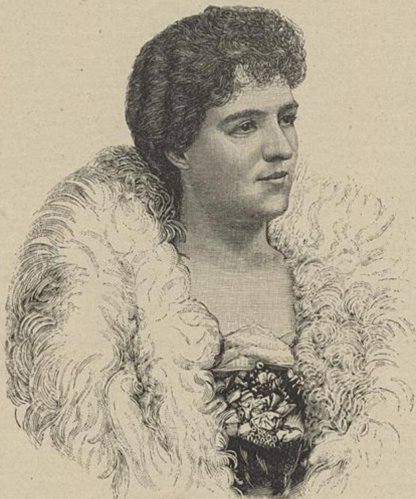
S. M. A RAINHA D. AMELIA