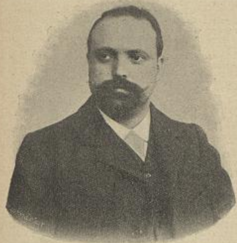
O ARCHITECTO VENTURA TERRA

dados mantem a criação proveitosa do bicho de seda, adoptaríamos alguns systemas de cultura e fabrico admissíveis em n'osso meio, n'uma palavra, seríamos expeditos para lhes tomar os exemplos de valor moral e de significação utilitaria e pratica na vida rural e não faríamos caso de tudo quanto abunda entre elles de maior ou menor futilidade e mais ou menos pernicioso.