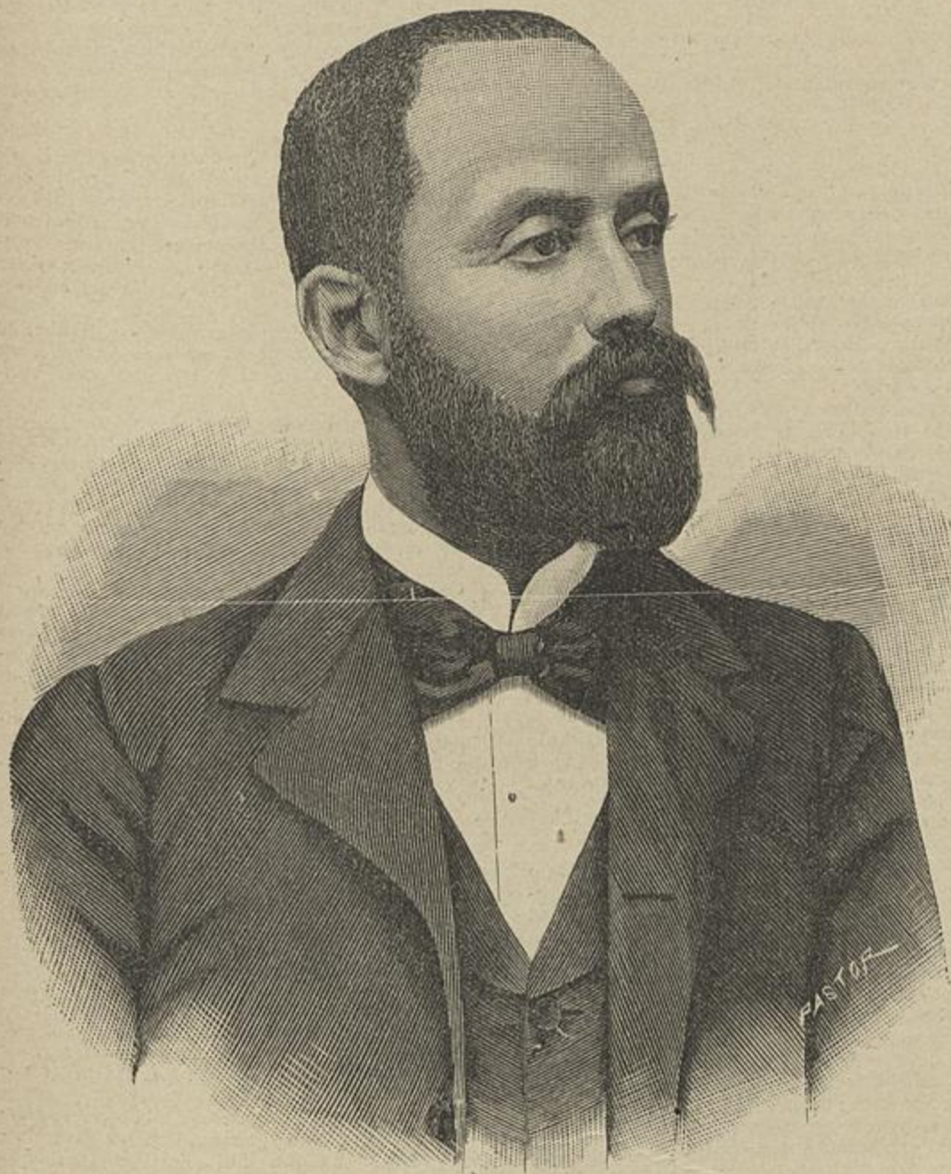
CYPRIANO CASTRO — PRESIDENTE DA REPUBLICA DE VENEZUELA