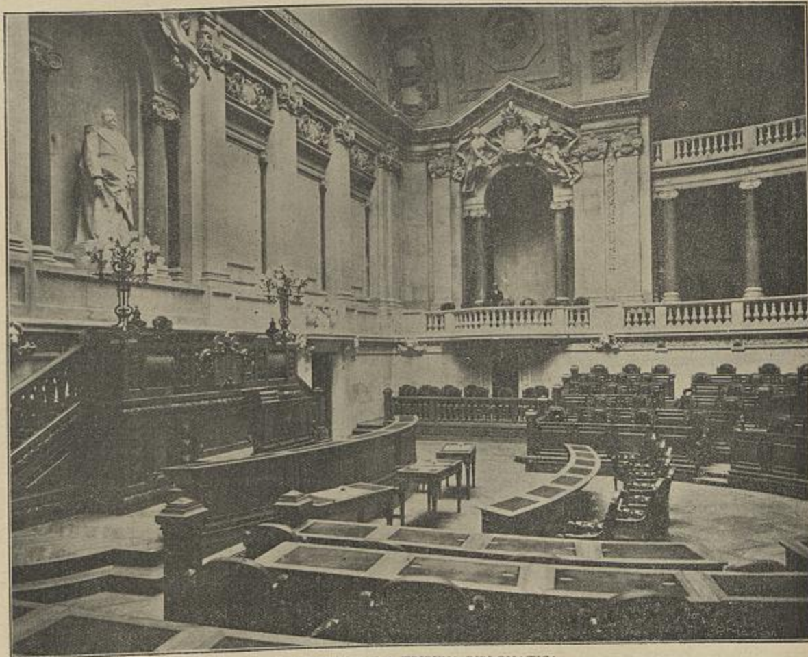
A PRESIDENCIA E A TRIBUNA DIPLOMATICA