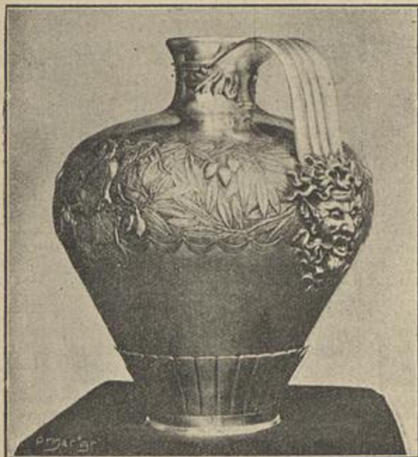
UMA QUARTA DO RIBATEJO

Um bello brinde artistico que muito agradecemos.