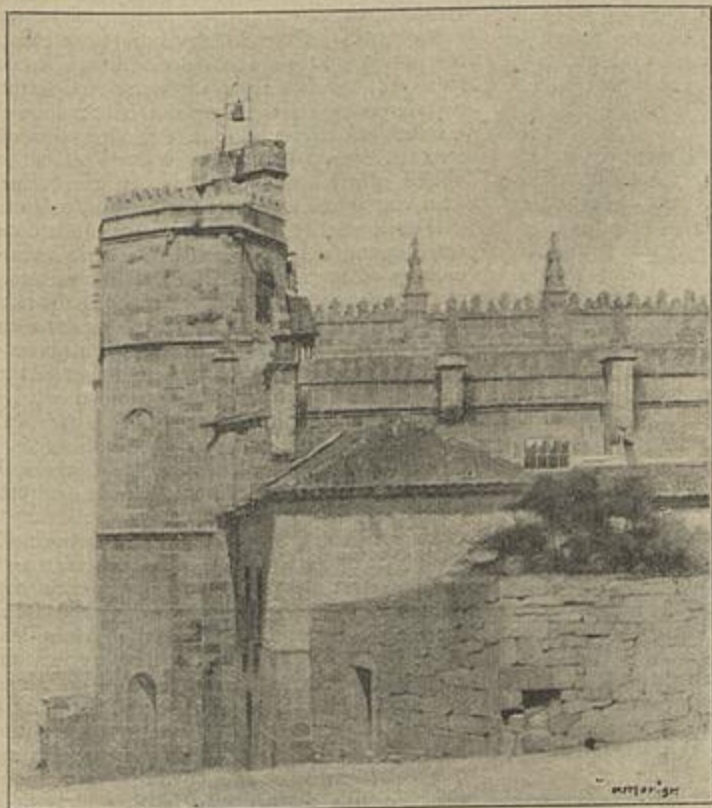
FACHADA DO SUL