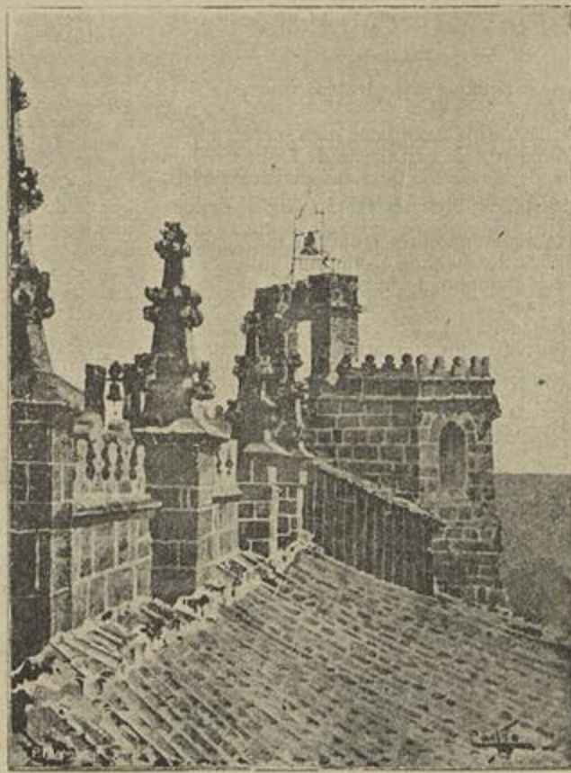
PARTE SUPERIOR DA TORRE, NA FACHADA NORTE