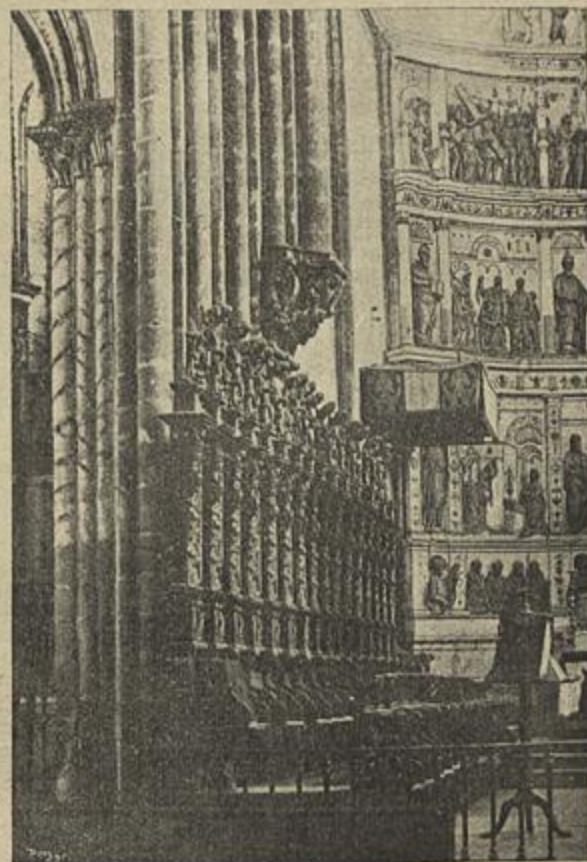
ALA ESQUERDA DO CORO DE BAIXO NA CAPELLA-MOR

Este deploravel factio, não só prejudicou intencionalmente as condições estheticas do formosissimo e magestoso arco, mas até cerceou profundamente as condições de estabilidade do edificio.