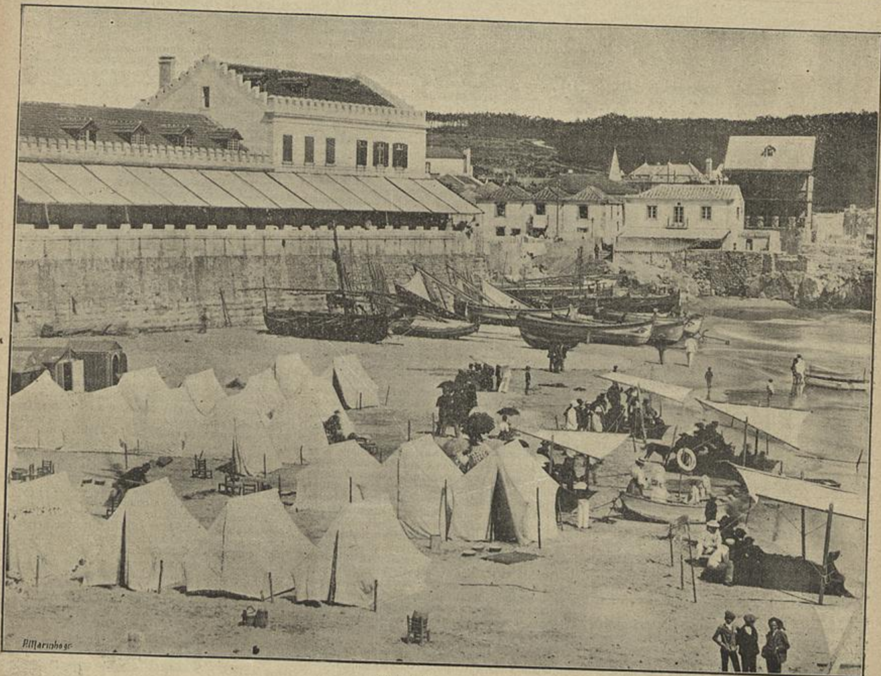
A PRAIA DE CASCAES

Todo o monumental edificio da Sé da Guarda, é caracterizado inteiramente, por uma grande sobriedade ornamental, que mais admiravel torna a extraordinaria harmonia das suas soberbas linhas; raros ornatos se vêem e esses de larga e rasgada factura, circumstancia principalmente devida á qualidade do granito regional, que é d'uma granulação grossa e de muito difficil lavôr. Das raras peças decoradas, avultam pela typica maneira com que foram tratadas, os capiteis do referido arco da capella mór, que a nossa estampa apresenta. Esses graciosos agrupamentos de que emergem simultaneamente, o arco da capella-mór, um arco gerador da nave-cruzeira e os artezões que