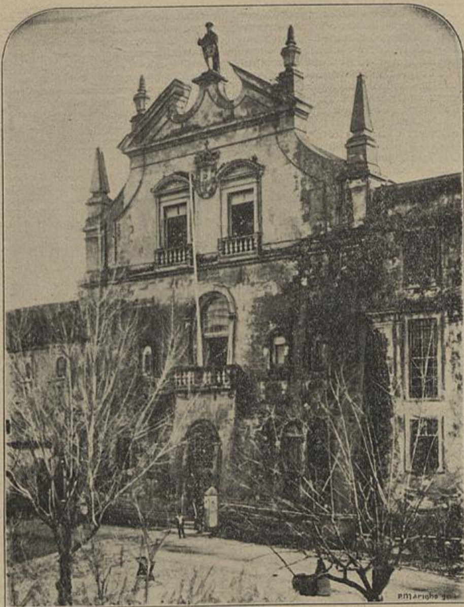
OS REFUGIADOS BOERS EM ALCOBAÇA — QUARTEL

tramarino, houve 1.º e 3.º actos da opera Bohème , de Puccini, 4.º da Carmen , de Bizet, e 4.º do Otello , de Verdi.