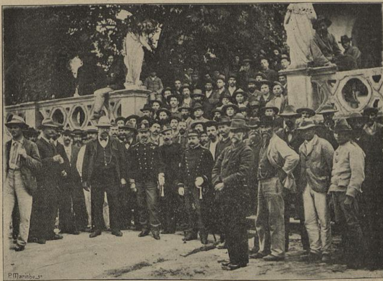
REFUGIADOS BOERS EM ALCOBAÇA — UM GRUPO

Disse-se que Francisco Andrade estava doente; se tal boato representava a verdade, o celebre barytono não devia ter cantado. Outros affirmavam, entre elles alguns cantores da companhia lyrica, que estava completamente estragado; se era verdade, e o proprio se conhecesse a si mesmo, ainda menos deveria ter voltado á scena de Lisboa.