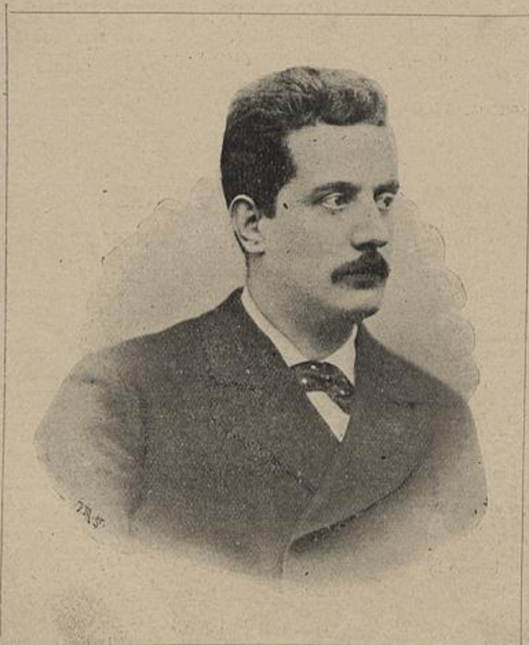
MAESTRO GIACOMO PUCCINI