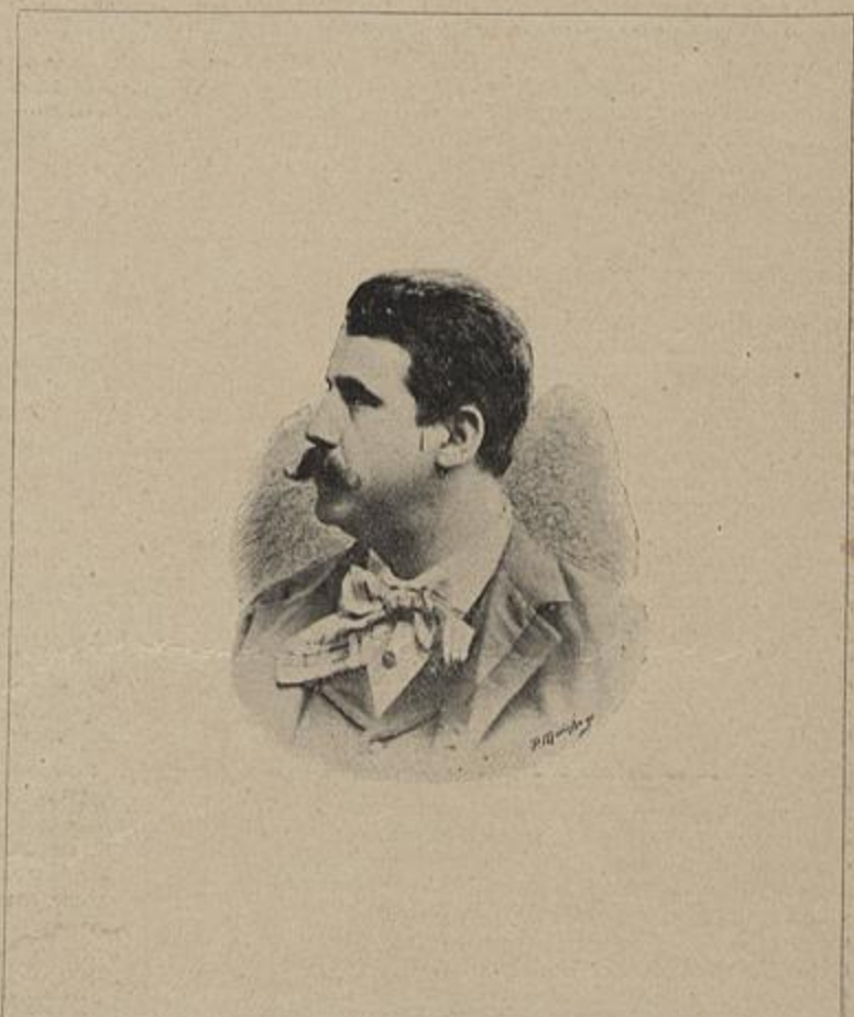
MAESTRO R. LEONCAVALLO