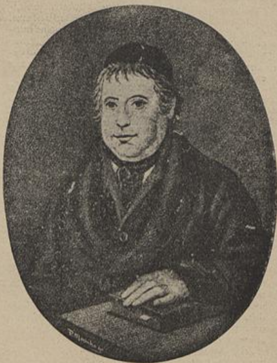
JOSÉ AGOSTINHO DE MACEDO