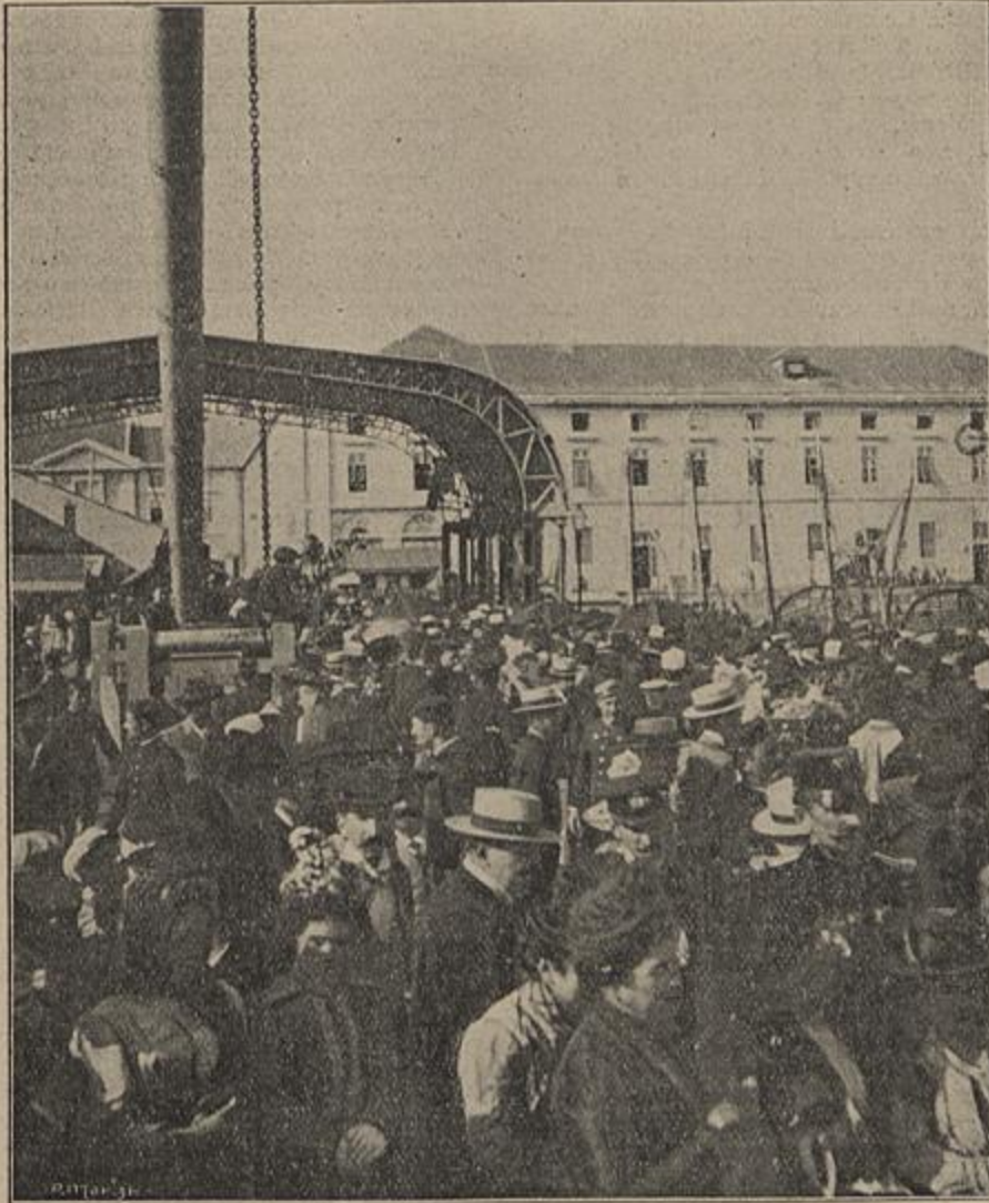
A EXPEDIÇÃO MILITAR PARA LOURENÇO MARQUES