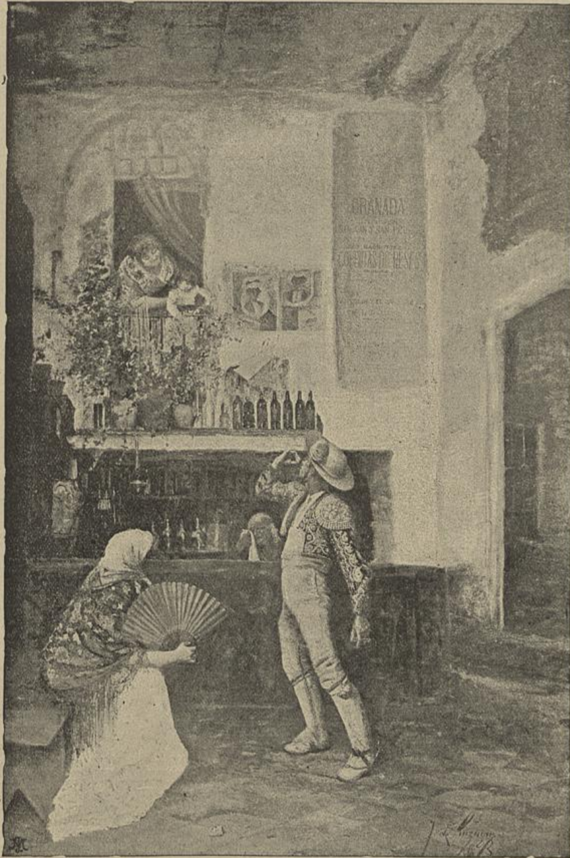
A DESPEDIDA DO TOUREIRO

Instillar na alma do povo, qual nectar delicioso, tudo quanto póde afervorar o sentimento de patria é excellencia propria no ministerio de governação publica e timbre pundonoroso que con-