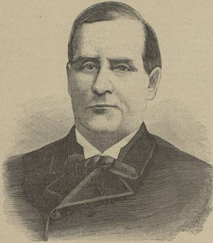
O PRESIDENTE MAC-KINLEY

VICTIMA DO ATTENTADO, EM BUFFALO, EM 6 DO CORRENTE