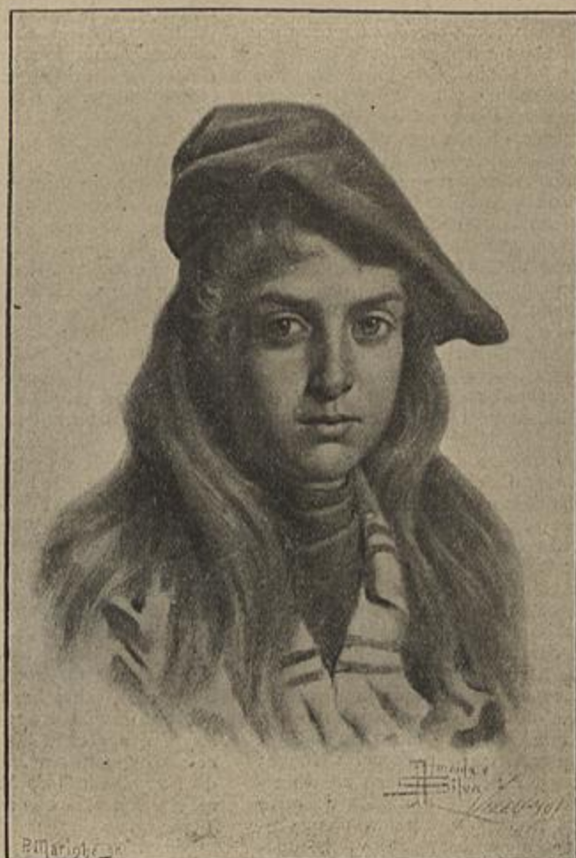
RETRATO DE UMA MENINA — De Almeida e Silva