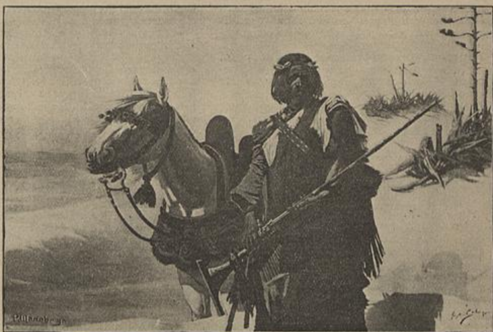
UM NOMADA — Quadro de Jorge Collaço