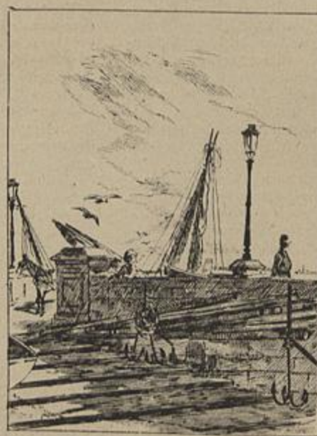
CAES DAS COLUMNAS — Aquarella de Alfredo Moraes