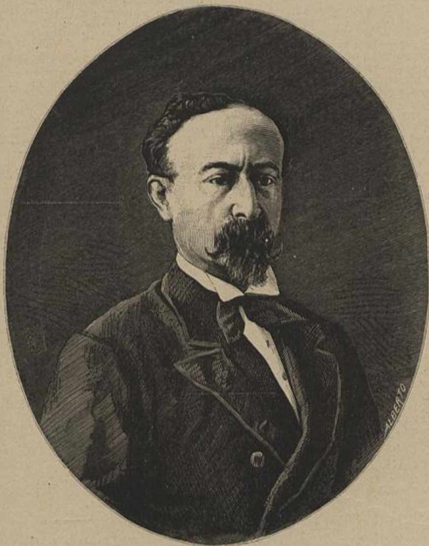
CONDE DE S. JANUARIO

Todos os pedidos de assignaturas deverão ser acompanhados do seu importe, e dirigidos à administração da Empresa do OCCIDENTE, sem o que não serão attendidos. — Editor responsável Caetano Alberto da Silva.