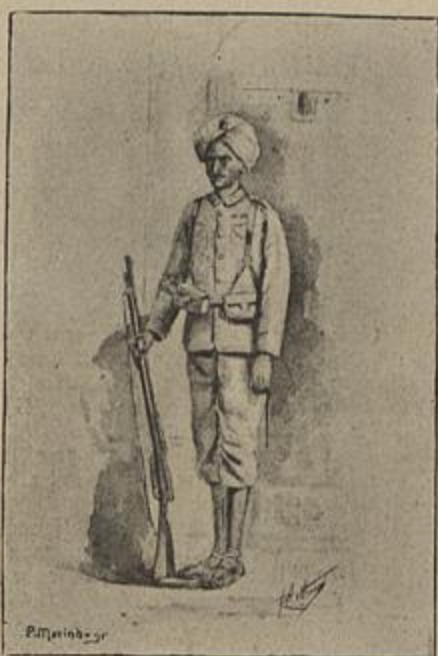
SOLDADO INDIGENA (INDIA) — Aquarella de Ribeiro Arthur