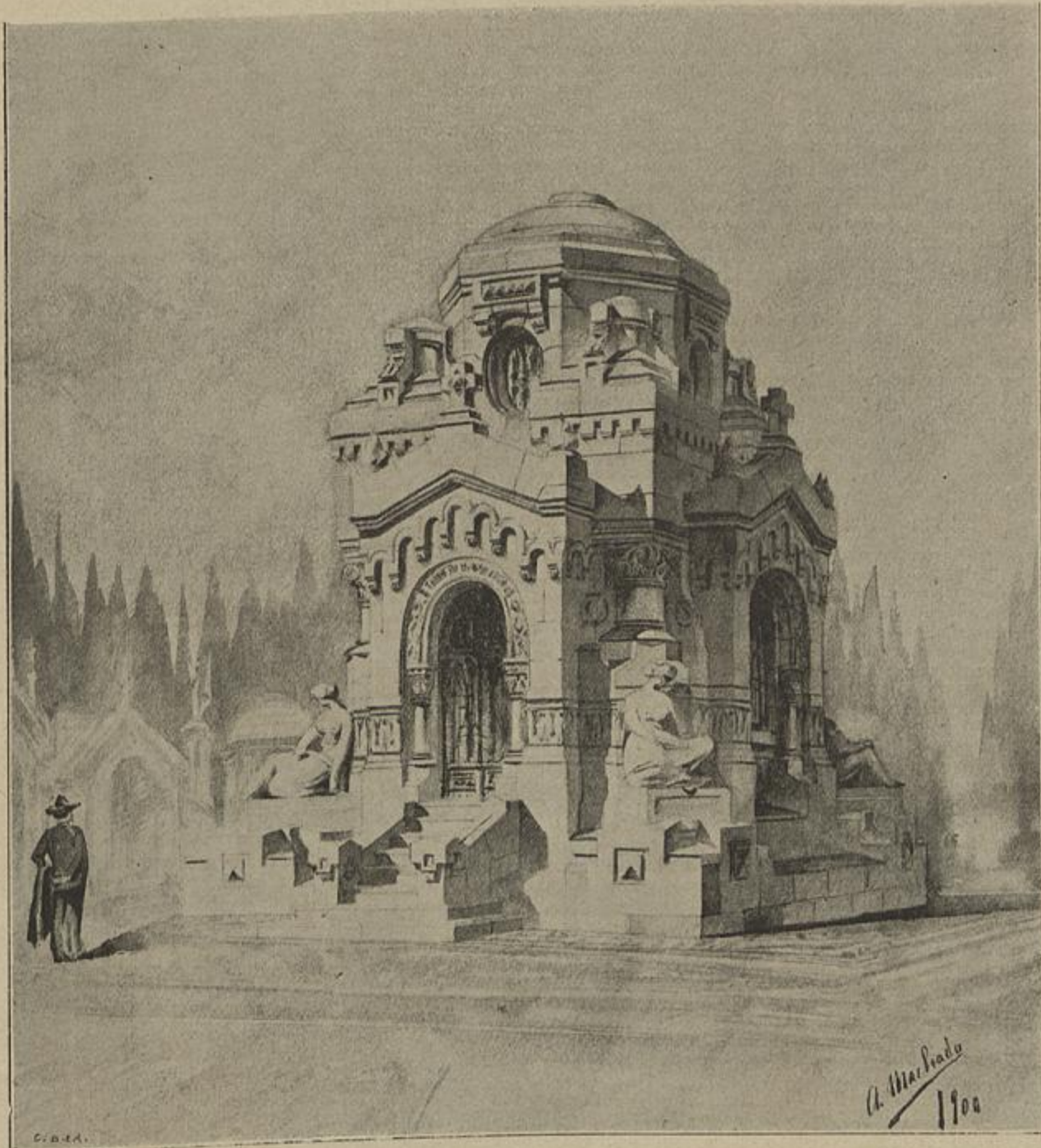
TUMULO DO VISCONDE DE VALMOR — PROJECTO DO ARCHITECTO SR. ALVARO MACHADO

e especulações, trouxe grandes perturbações ao regimen economico d'aquelle grande paiz, e, por consequencia, foi fatal ás relações commerciaes e financeiras em Portugal, sendo a grande baixa que se produziu no cambio de um effeito desastroso sobre este paiz; as remessas de ouro diminuiram consideravelmente, de modo que tendo que se fazer com ouro de Portugal os pagamentos no estrangeiro, começou este vil, ou excelso, metal a ter agio, e portanto as libras esterlinas, a que no anno do ultimatum inglez (1890) os portuguezes chamaram piratas , começaram a subir de valor e a retrairem-se, e como consequencia veio a crise monetaria; o Banco de Portugal deixou de pagar