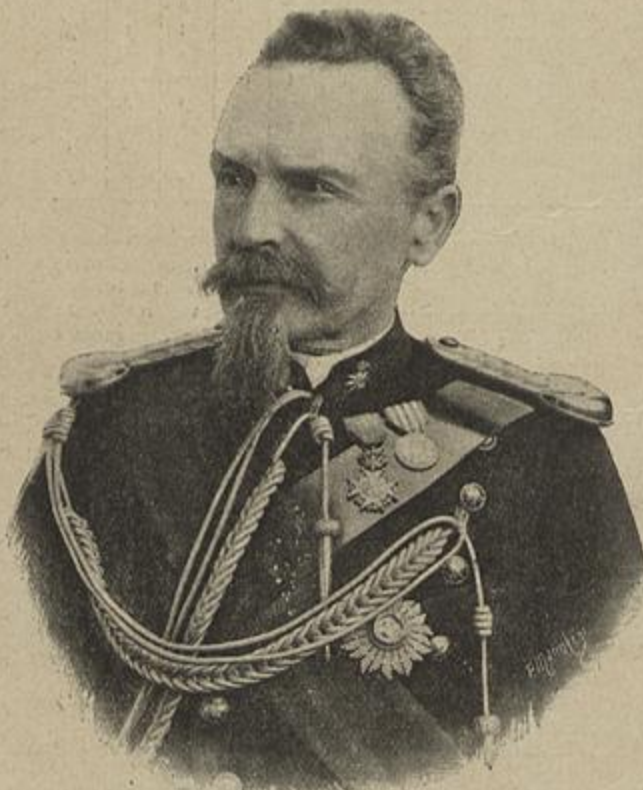
GENERAL WENCESLAU TELLES

Não era no sitio que o sedusira que elle devia de morar; era defronte para poder vel-o, era nas