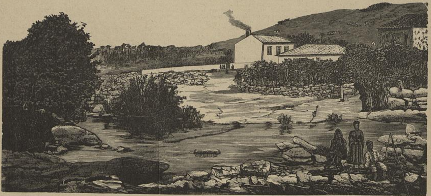
OS EMIGRADOS BOERS EM PENICHE — Vidé Chronica Occidental

O' minha Branca! escondámo-nos nas ervinhas a nossa felicidade, sejamos felizes sem que ninguem o saiba. O infortunio anda sempre de vigia e a procurar-nos.