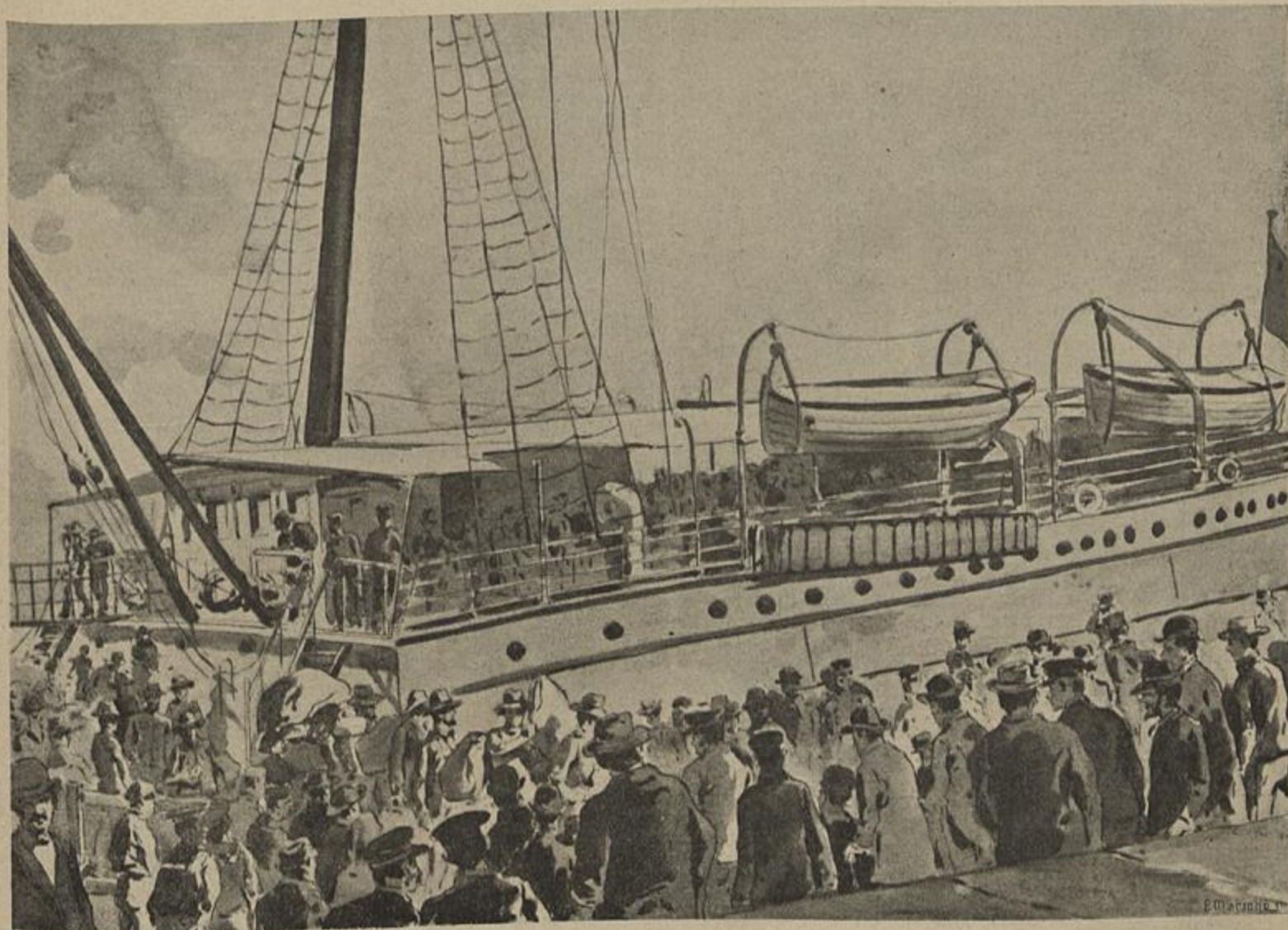
DESEMBARQUE DOS EMIGRADOS BOERS, EM LISBOA — Vid. Chronica Occidental

Haja clero á altura de sua missão augusta e e cola de ensino obrigatorio em cujo programma figure a palavra Deus, e estará ganha a batalha travada contra os inimigos mais perfidios da ordem social; os antros que