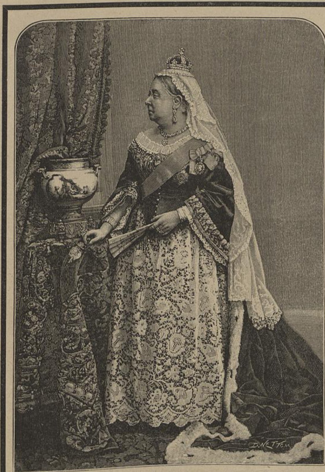
SUA MAGESTADE A RAINHA VICTORIA, IMPERATRIZ DAS INDIAS FALLECIDA EM 22 DO CORRENTE