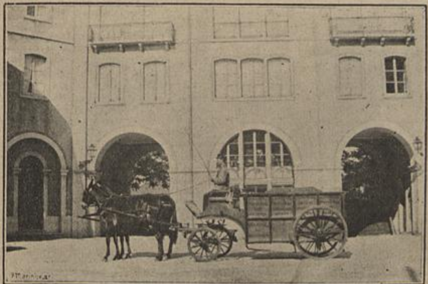
CARRO PARA CONDUO DE ANIMAES DOENTES

No desanimaram mesmo assim as grandes da-