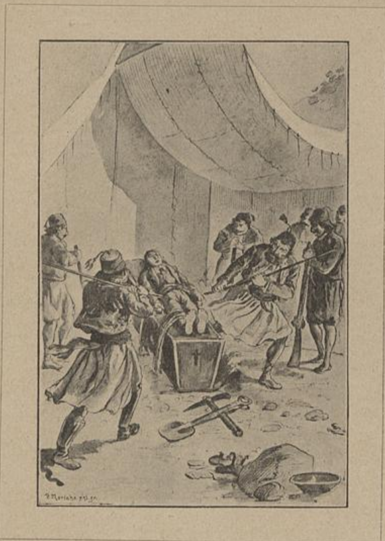
«O REI DAS SERRAS» — Senti todas as bordoadas, uma apoz outra.